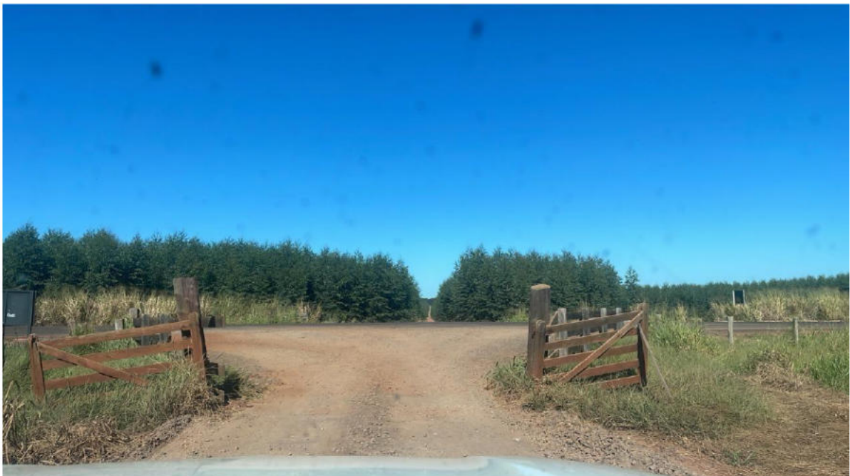
CONVERSÃO A DIREITA - ACESSO A RODOVIA MS-040