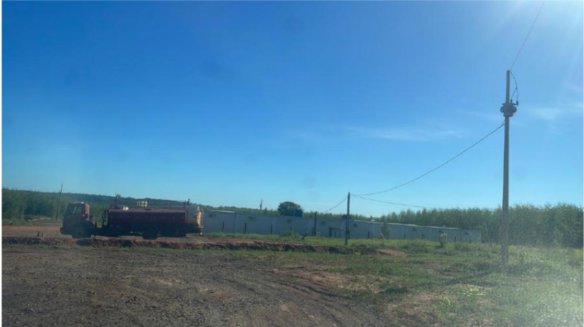
INÍCIO DA LINHA - PONTO 01 - FAZ. ESTRELA