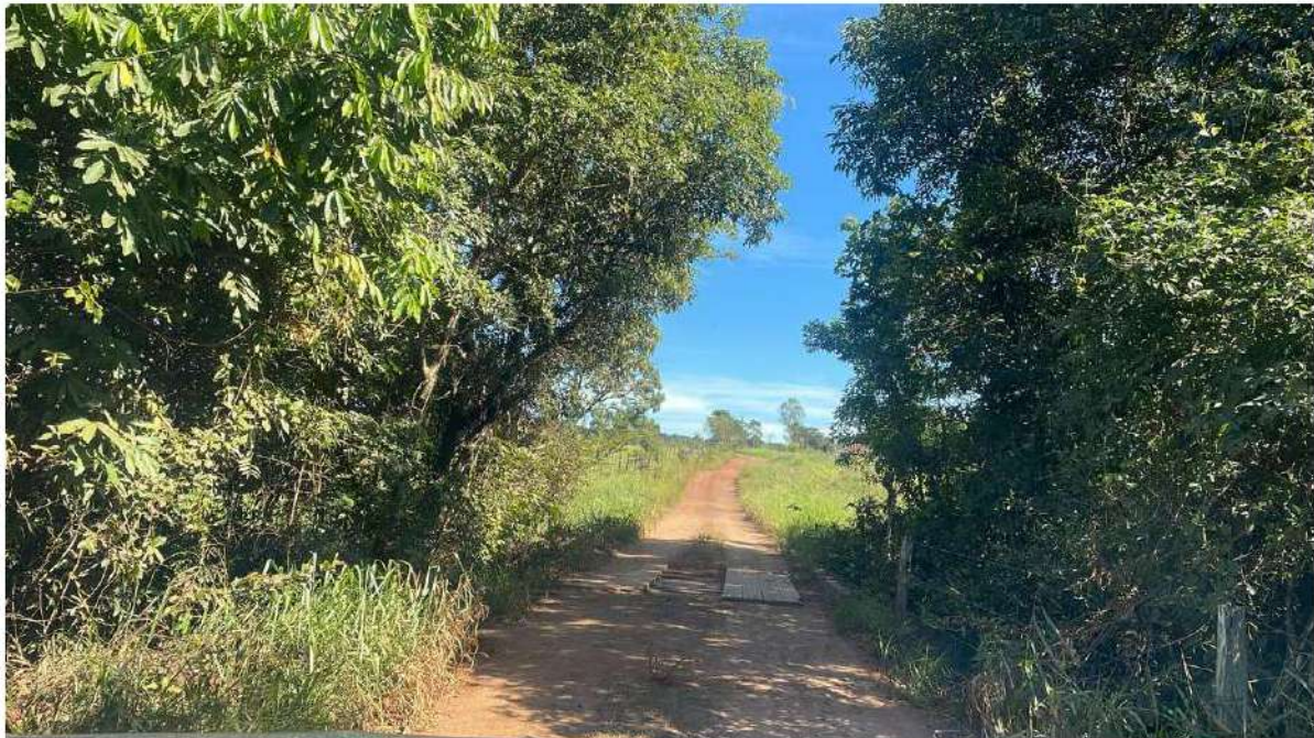
PONTE CÓRREGO CACHOEIRA