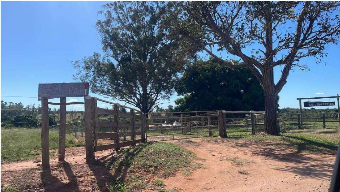
PONTO 06 - CHÁCARA HERANÇA DO PAI / RANCHO NOSSA SENHORA APARECIDA