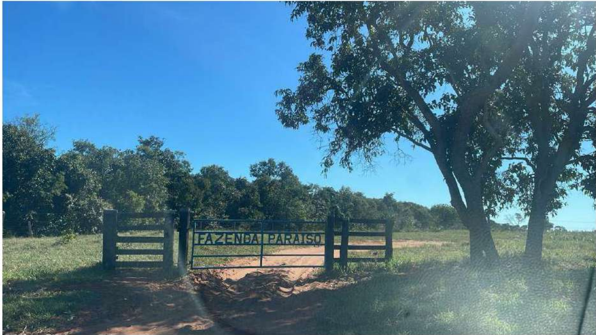
INÍCIO - FAZ. PARAÍSO