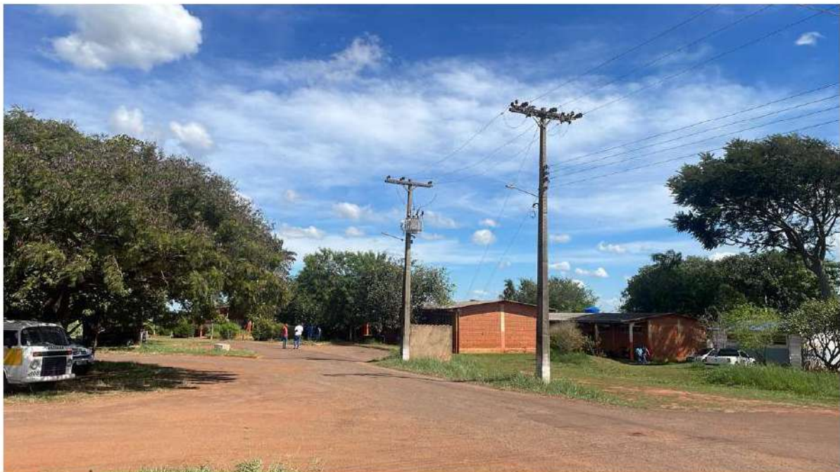
FINAL - E.M. AGRÍCOLA GOV. ARNALDO ESTEVÃO DE FIGUEIREDO