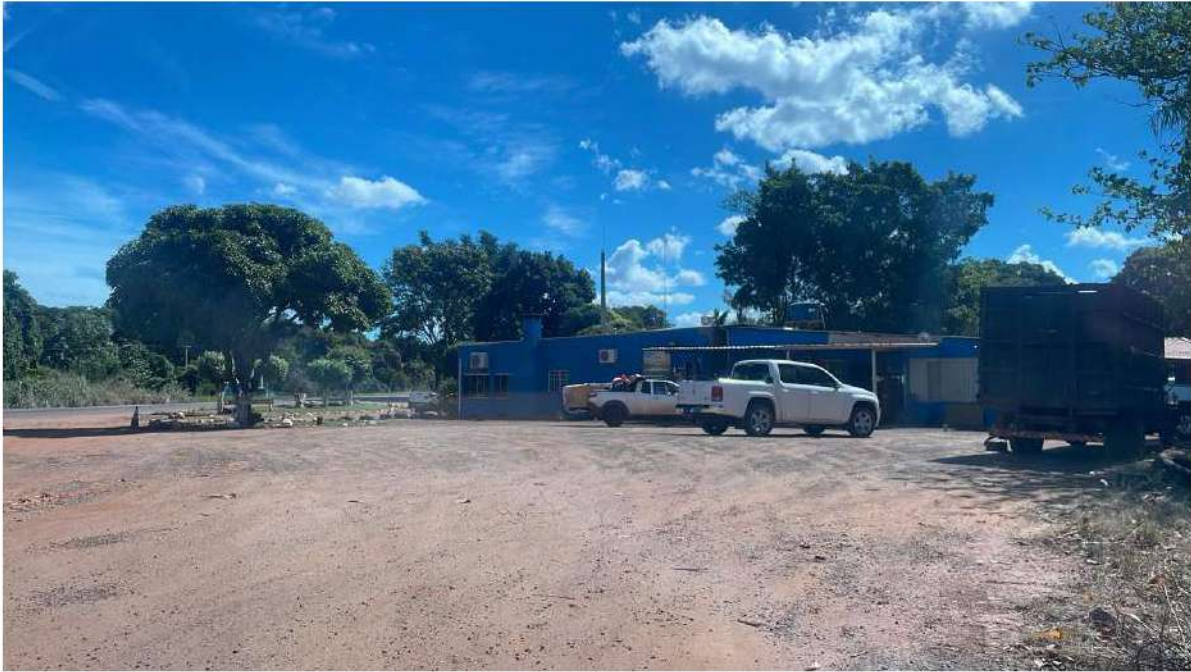
PONTO 14 - AGROPECUARIA SUPERA