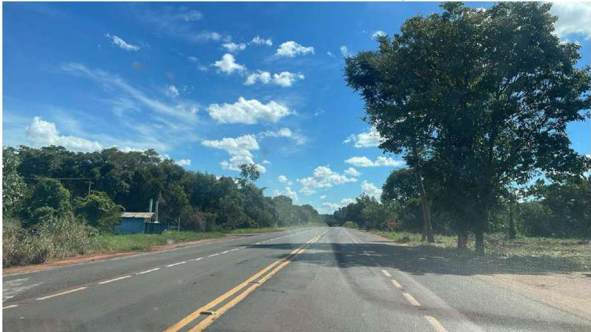
CONVERSÃO A ESQUERDA - ACESSO A E.M GOV. ARNALDO ESTEVÃO DE FIGUEIREDO