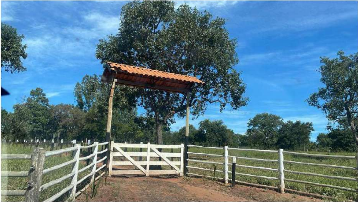
PONTO 05 - CHÁCARA AGRO HORSE