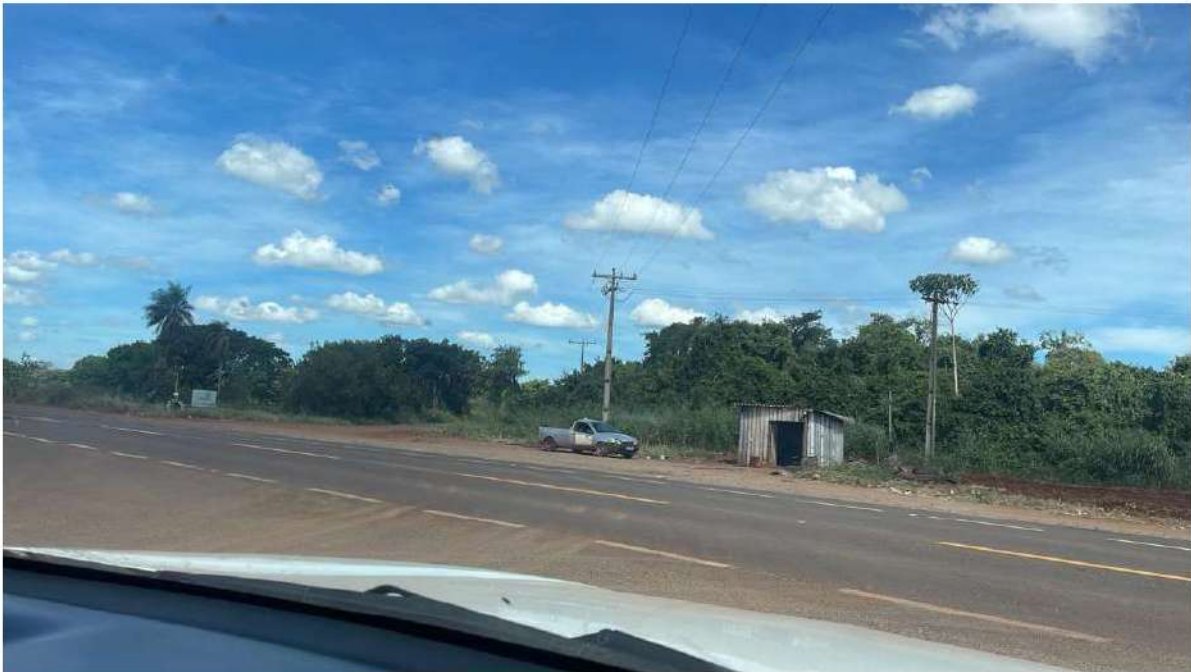
CRUZAMENTO RODOVIA MS-040