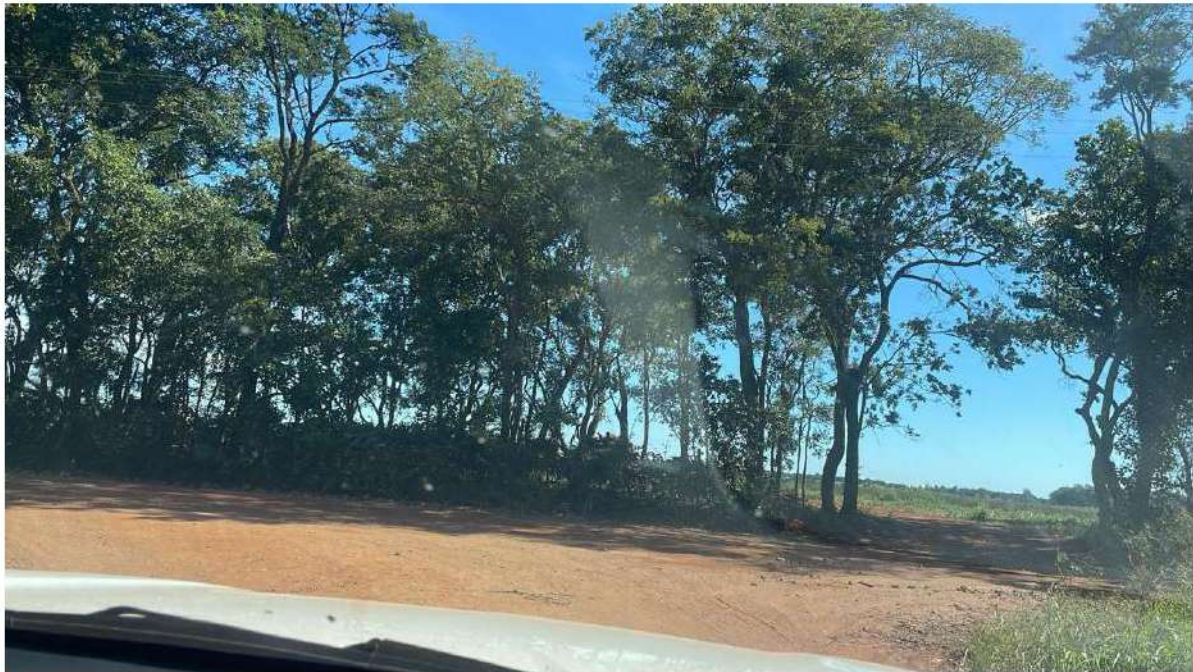
CONVERSÃO A DIREITA