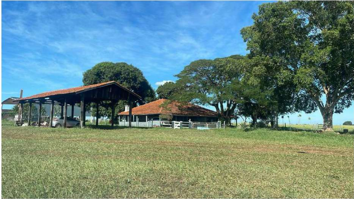
PONTO 02 - FAZ. ÁGUA VIVA