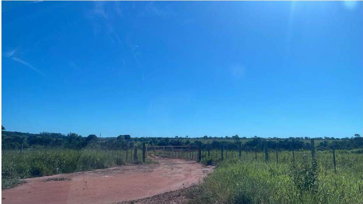
PONTO 04 - FAZ. TRÊS COQUEIROS