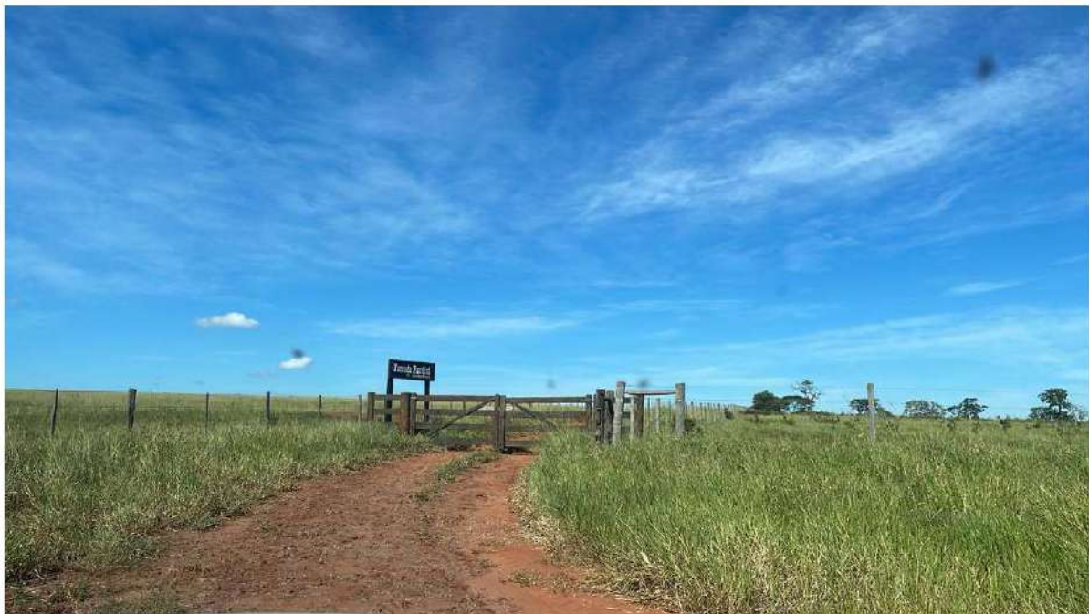
PONTO 03 - FAZ. PASOLINI