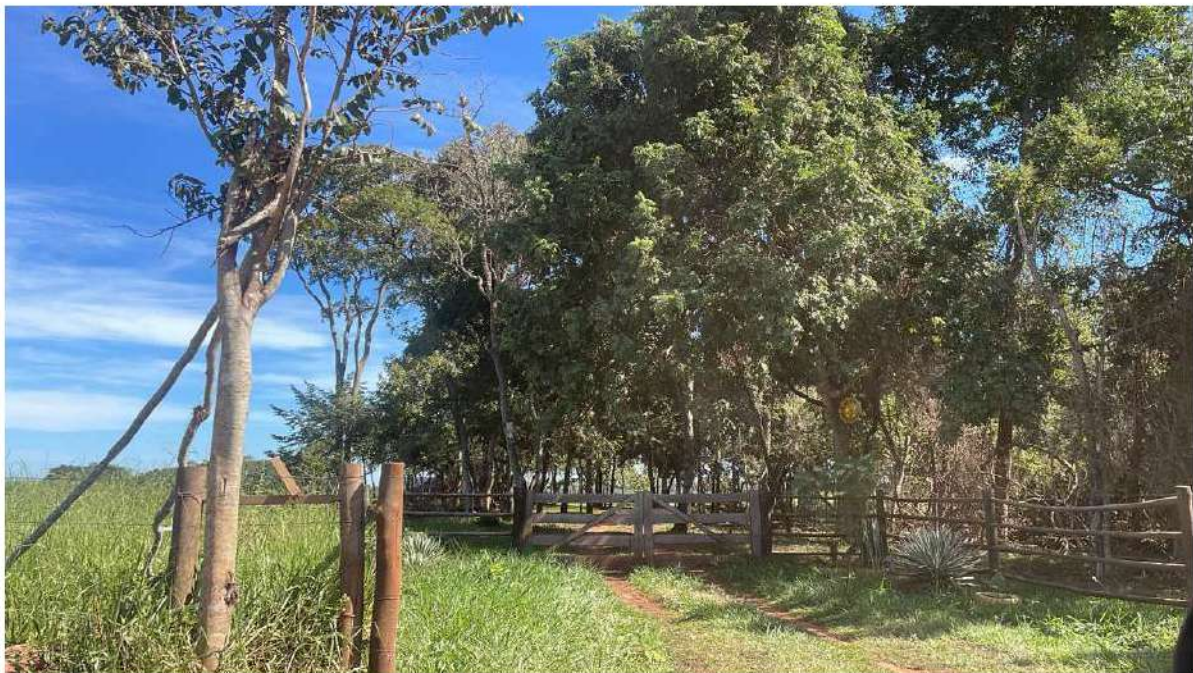
PONTO 11 - CHÁCARA LEMBRANÇA