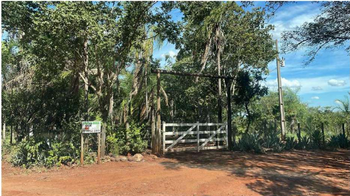
PONTO 16 - VIVEIRO / RETORNO