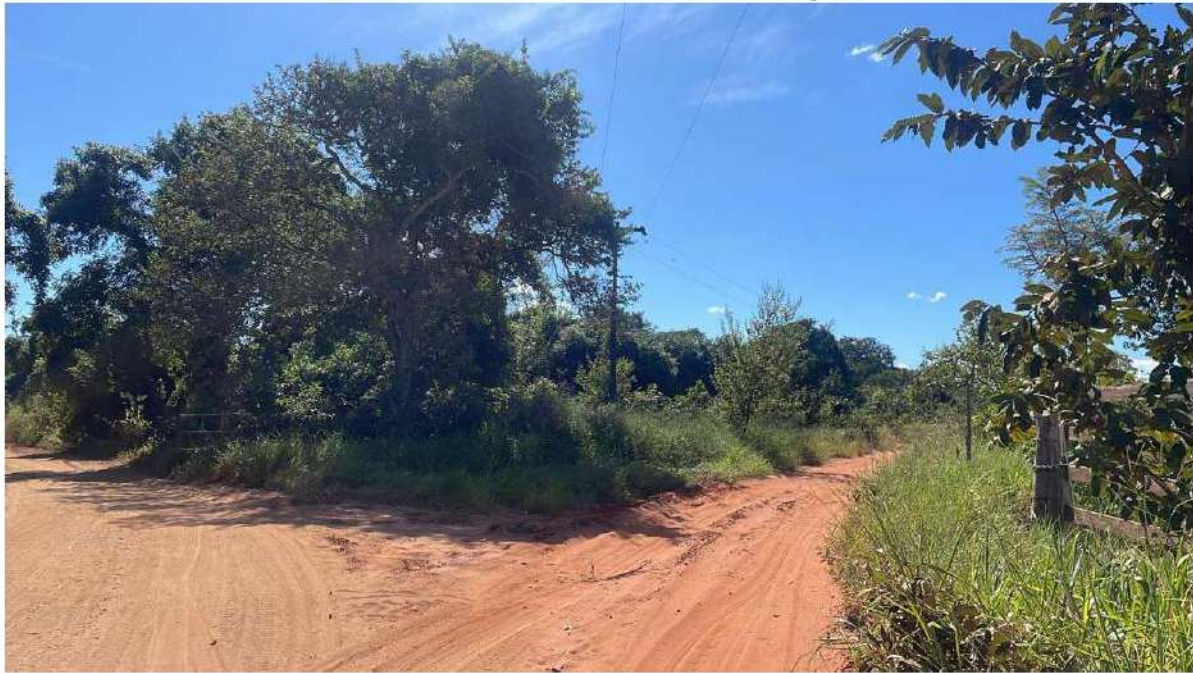
CONVERSÃO A DIREITA