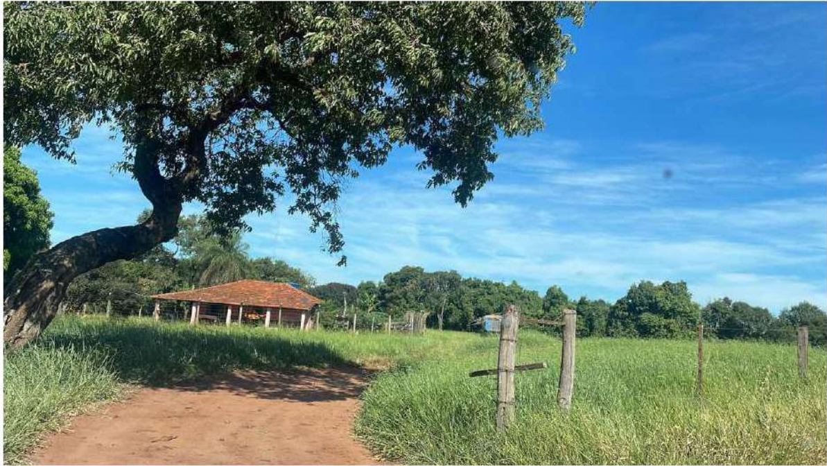
PONTO 09 - PSICULTURA PIRACEMA