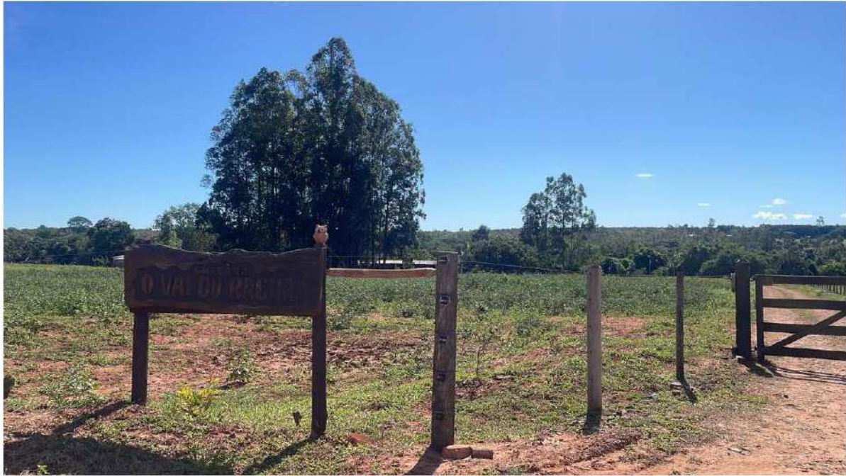
PONTO 07 - CHÁCARA O VAI OU RACHA