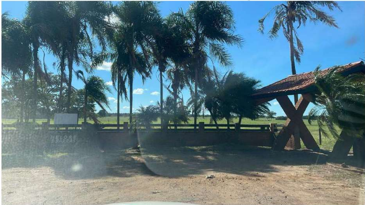
PONTO 10 - FAZENDA NELORE TRÊS BARRAS