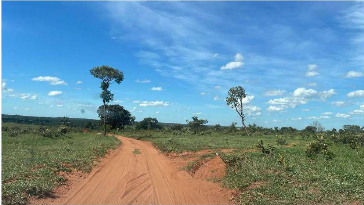
PONTO 12 - FAZ. CACHOEIRA / RETORNO