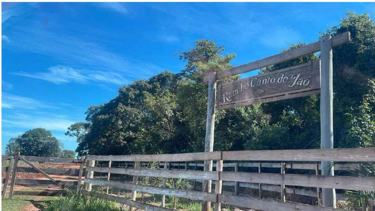
PONTO 08 - RANCHO RECANTO DO JAÓ