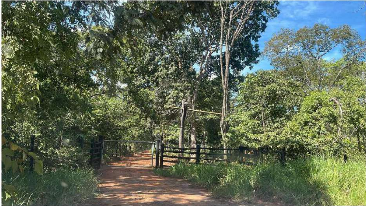
PONTO 15 - RANCHO WF