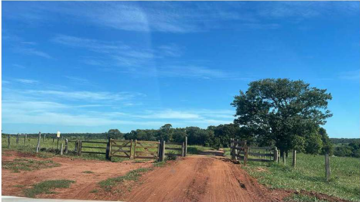
PORTEIRA 05 / FAZ PASOLINI