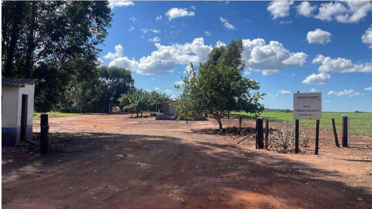
PONTO 13 - FAZ. NÓRDICA AGRO / FILIAL I - FAZ. CACHOEIRA - KM 17