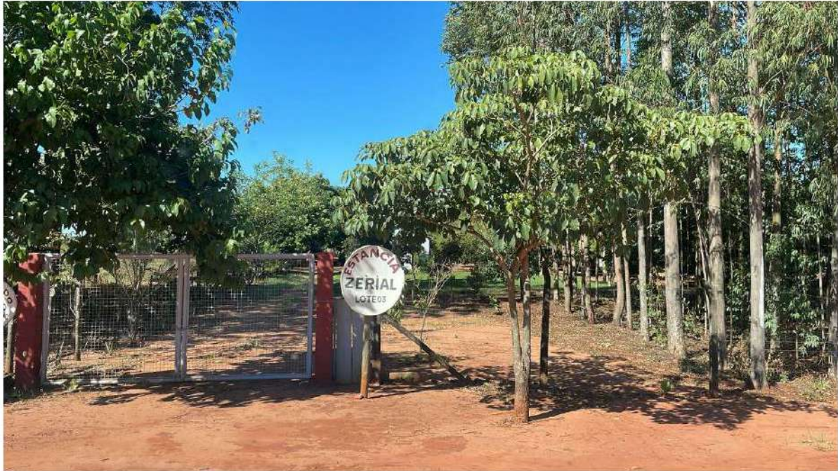
PONTO 08 - FAZ. ZERIAL