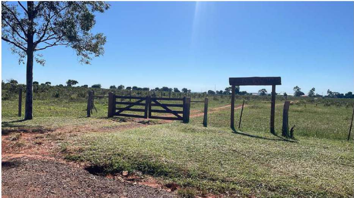
PONTO 05 - FAZ. NATALIA