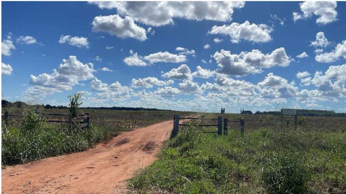
PONTO 19 - FAZ. ESTÂNCIA DOIS AMORES