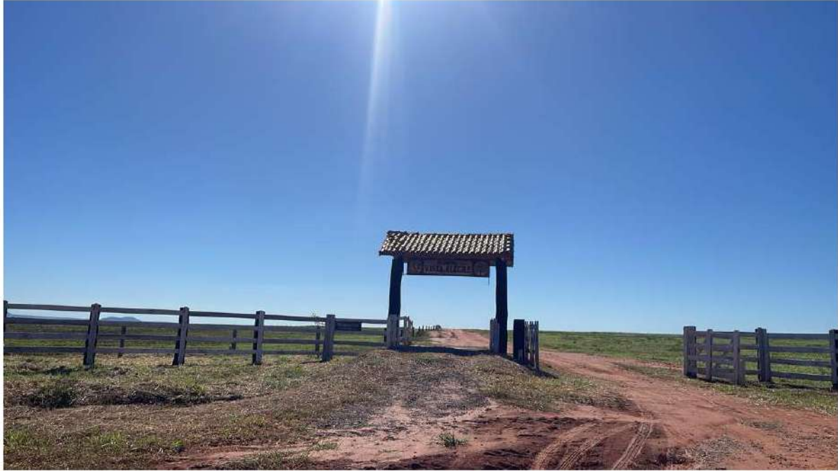
PONTO 02 - FAZ. VISTA ALEGRE