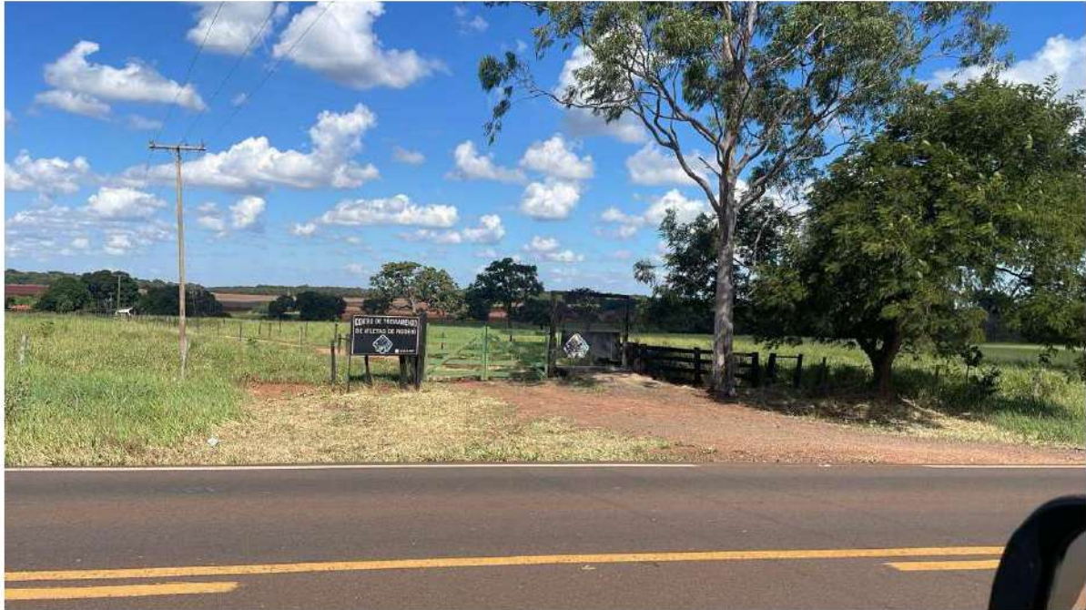
PONTO 15 - CT DE ATLETAS DE RODEIO