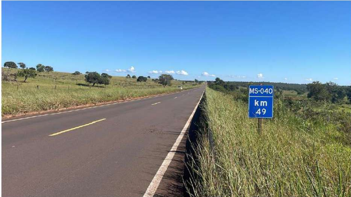
PONTO 04 - KM 49