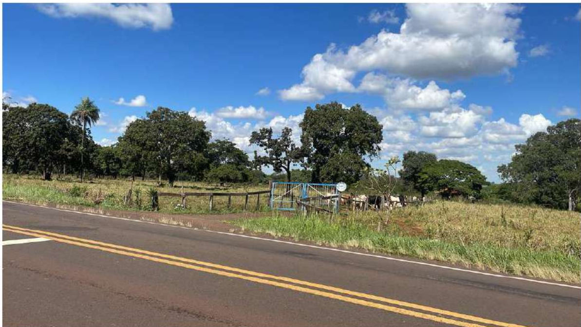
FAZ. OURO VERDE