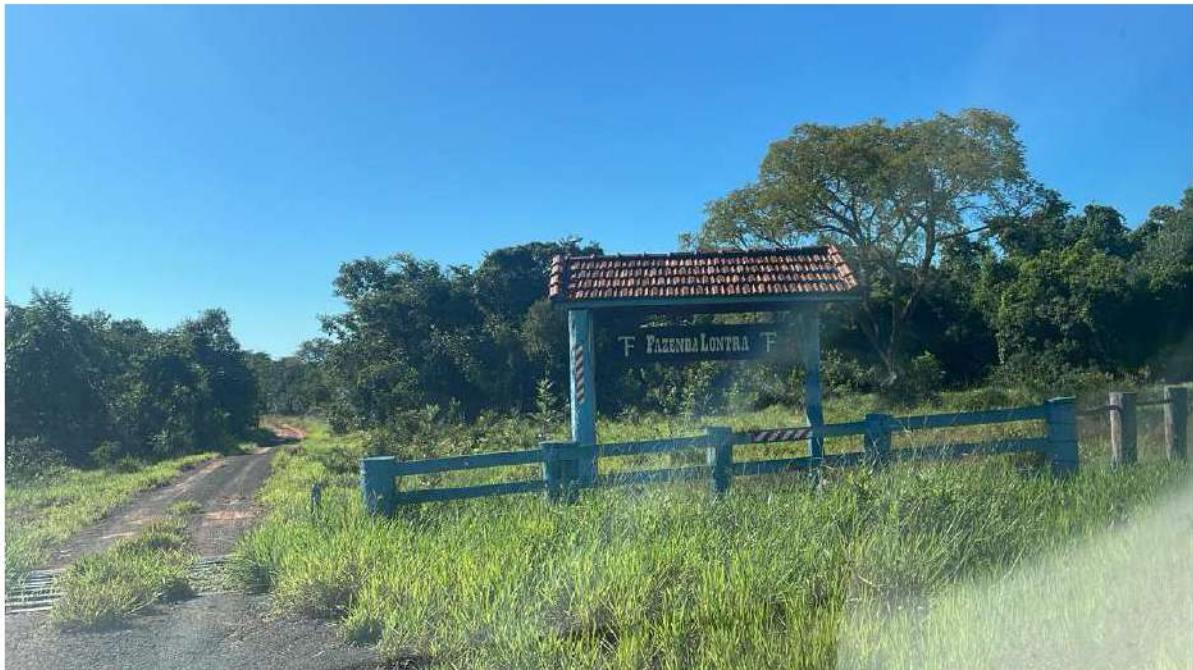
PONTO 03 - FAZ. LONTRA