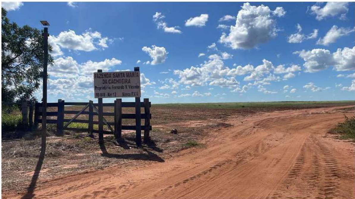
PONTO 14 - FAZ. SANTA MARIA DA CACHOEIRA - KM 12