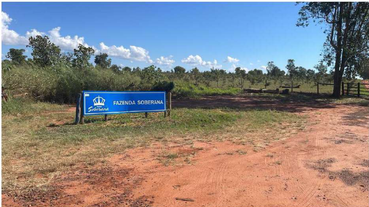
PONTO 07 - FAZ. SOBERANA