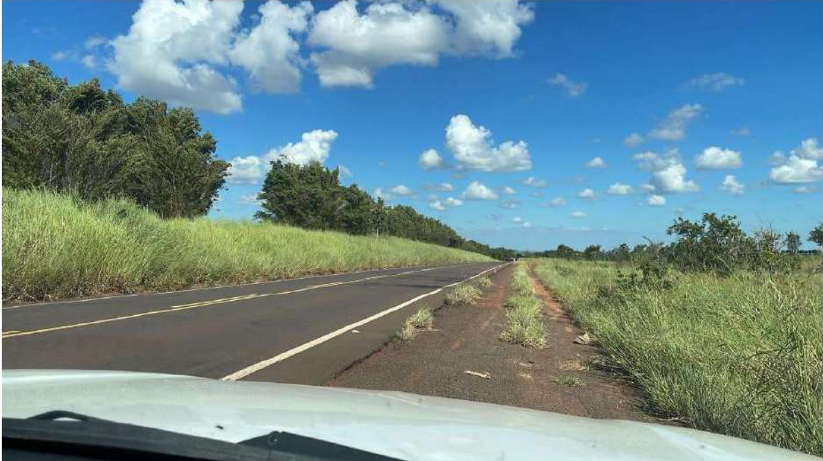
PONTO 12 - PONTO REFERENTE A FAZ. SÃO SEBASTIÃO