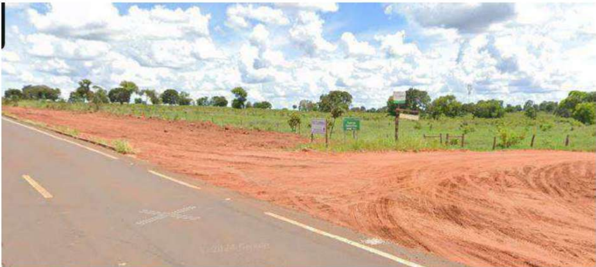
CONVERSÃO A DIREITA - ACESSO A MS-040