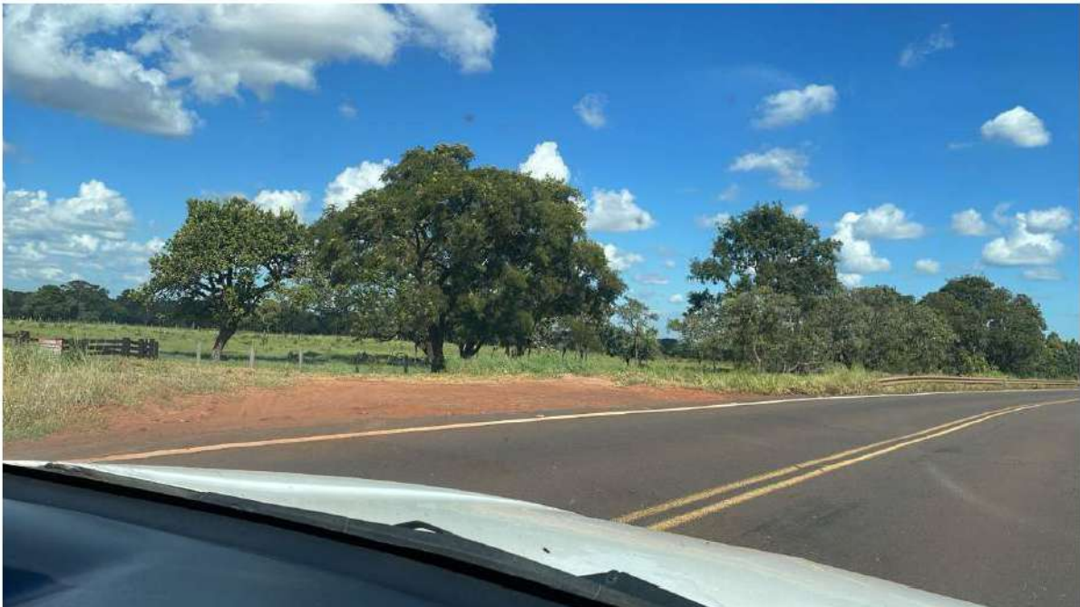
FAZ. SÃO SEBASTIÃO