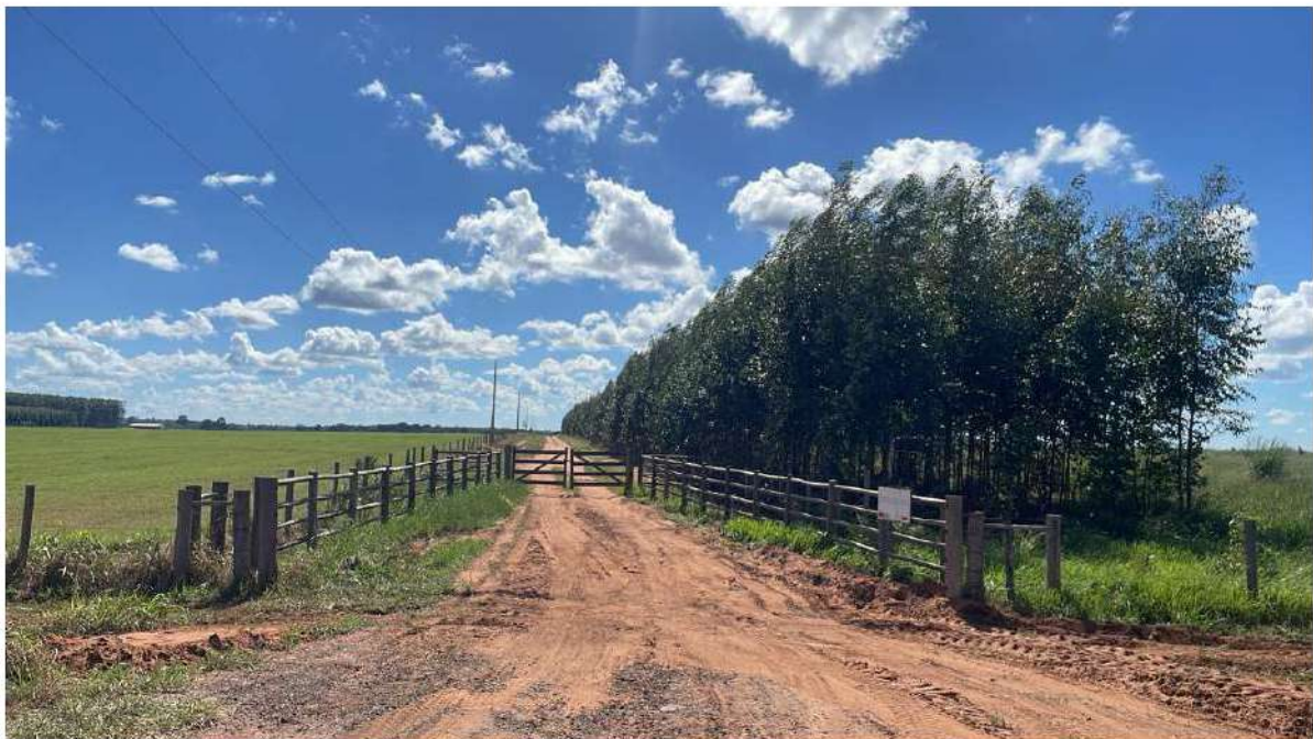
PONTO 16 - FAZ. QUITA DA ADUIE