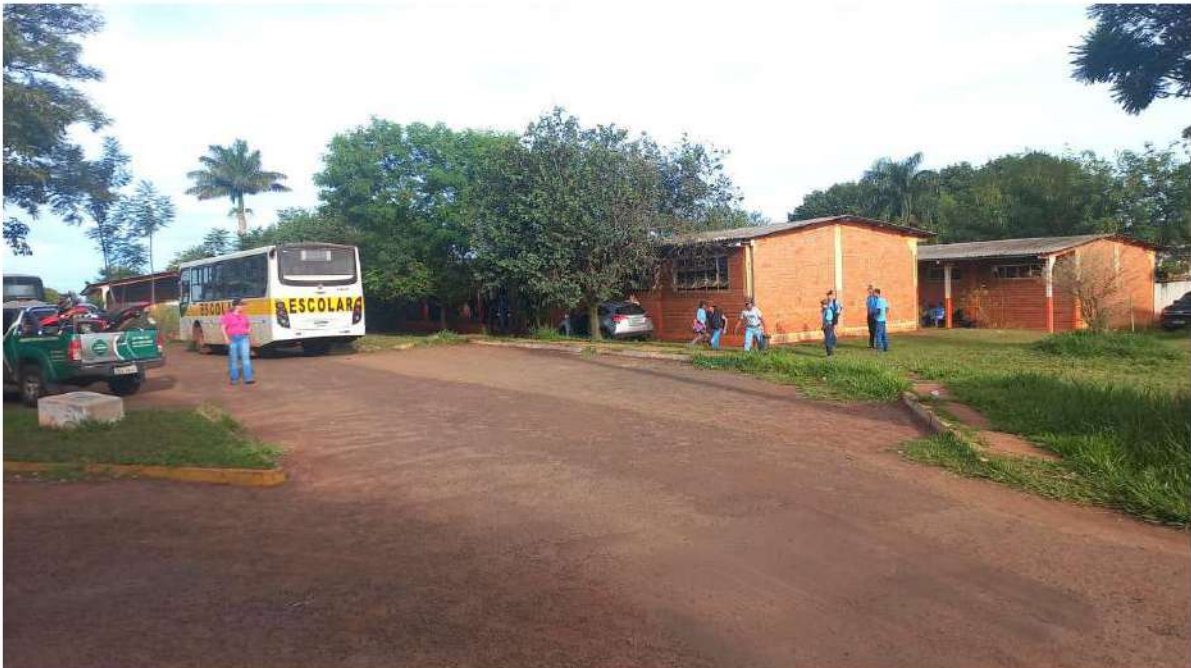
FINAL - E.M. AGRÍCOLA GOV. ARNALDO ESTEVÃO DE FIGUEIREDO