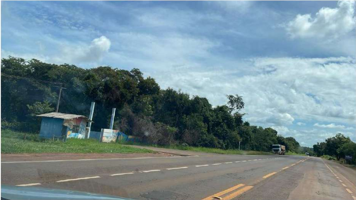
CONVERSÃO A ESQUERDA - ACESSO A ESCOLA