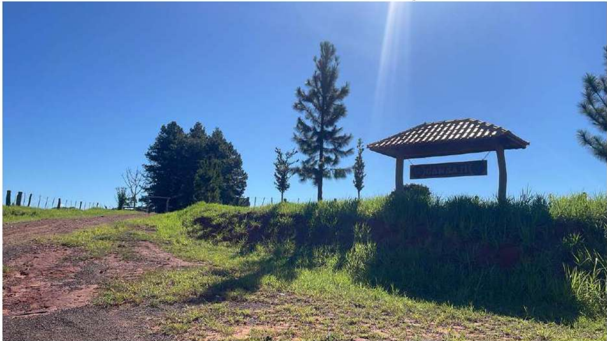
PONTO 06 - FAZ. CANAÃ