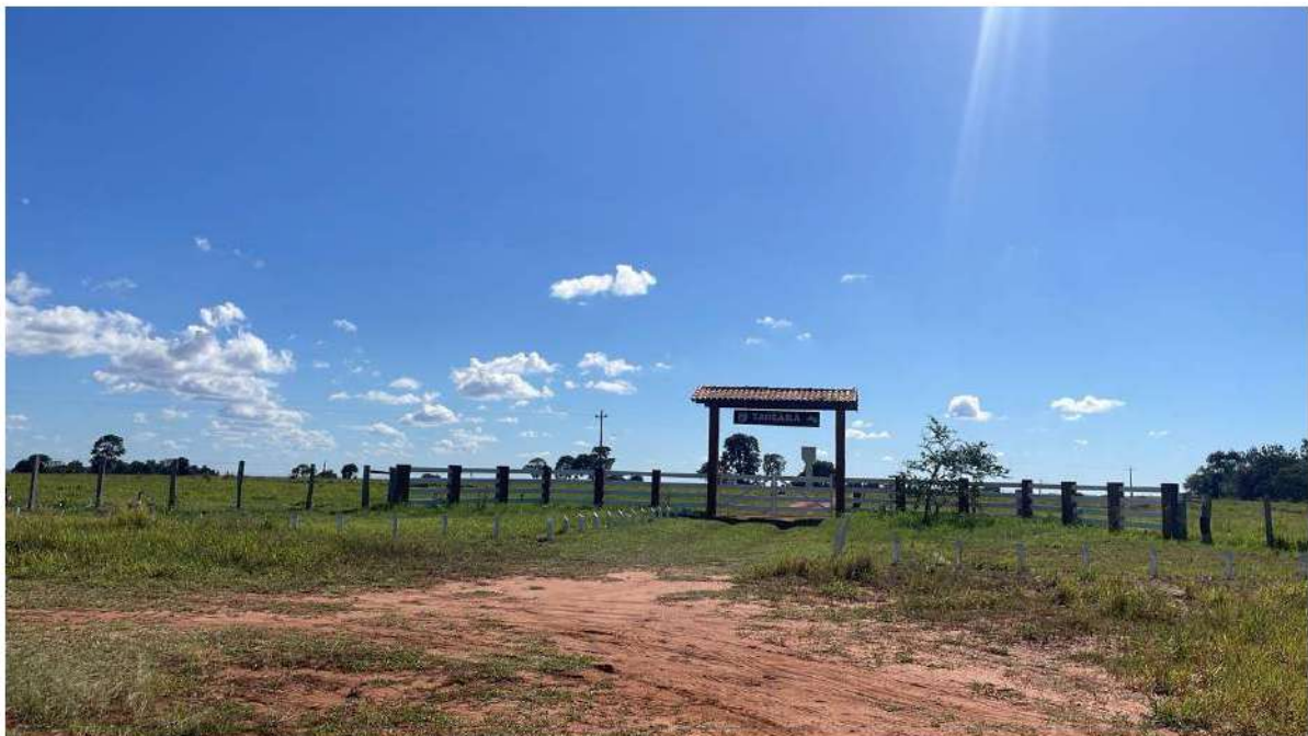
PONTO 09 - FAZ. TANGARÁ