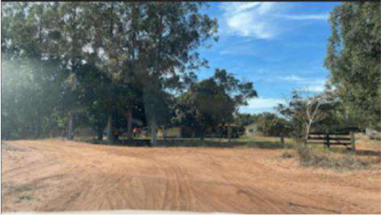
INÍCIO DA LINHA - FAZ. ÁRVORE SÓ