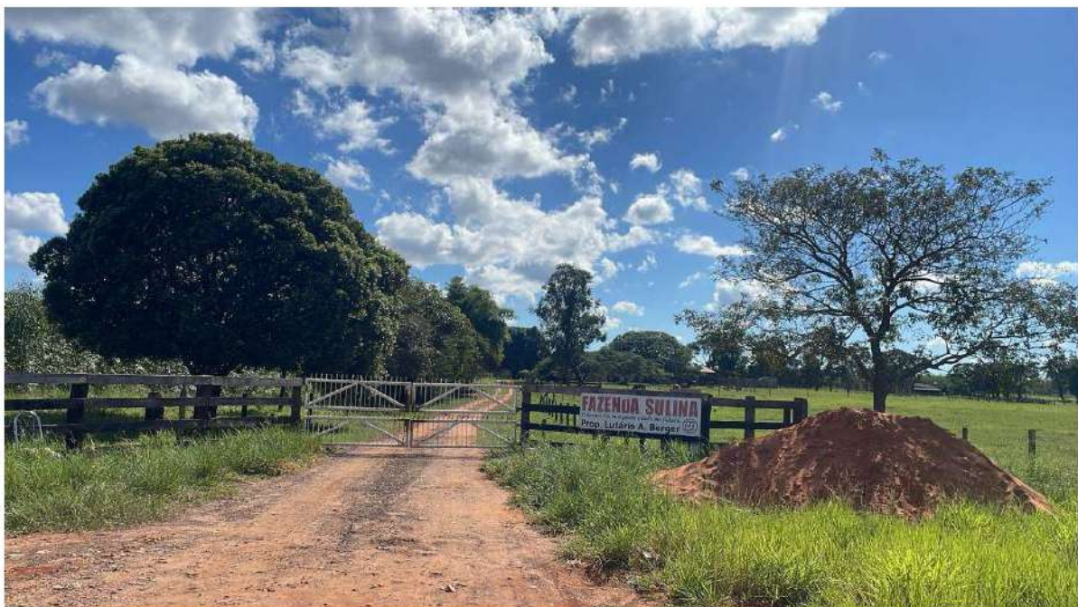
PONTO 11 - FAZ. SULINA