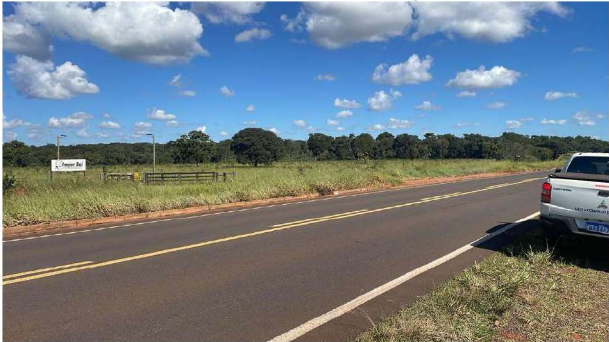
PONTO 10 - FAZ. IMPOR BOI