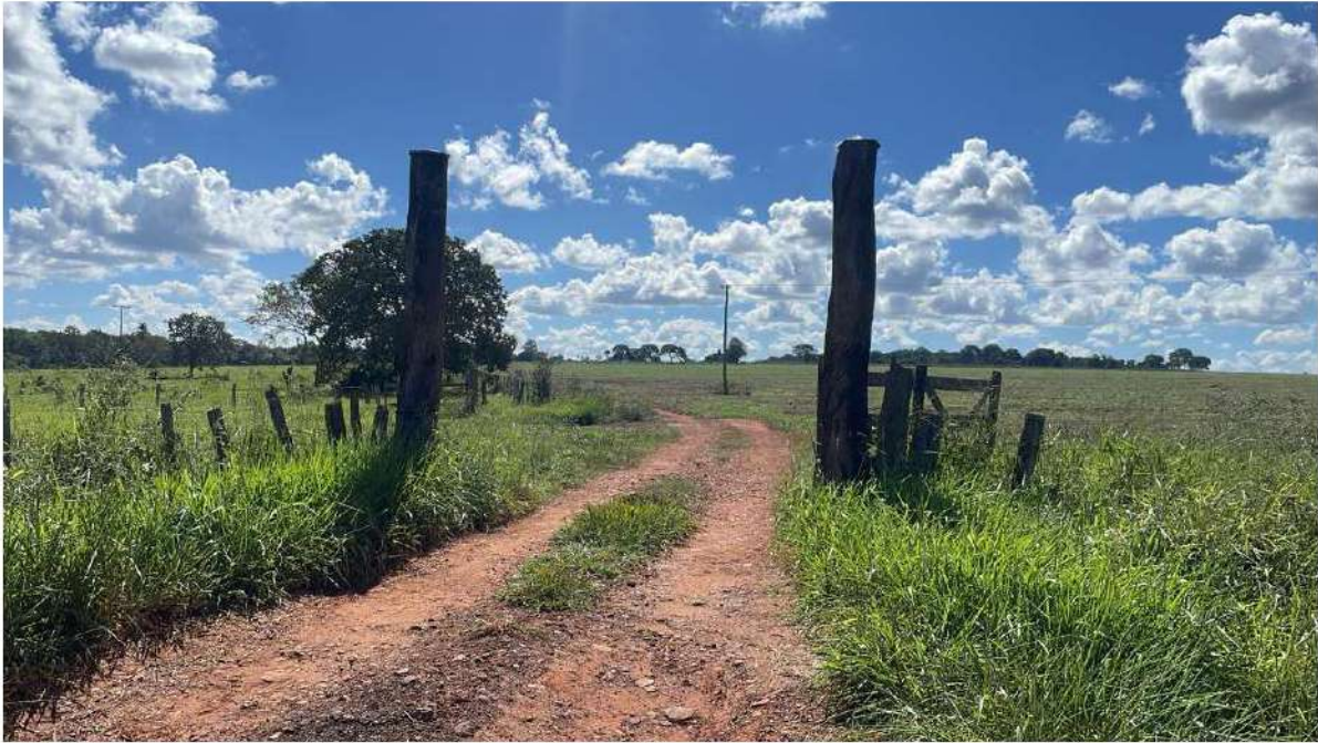
PONTO 20 - SEM NOME / FAZ. OURO VERDE