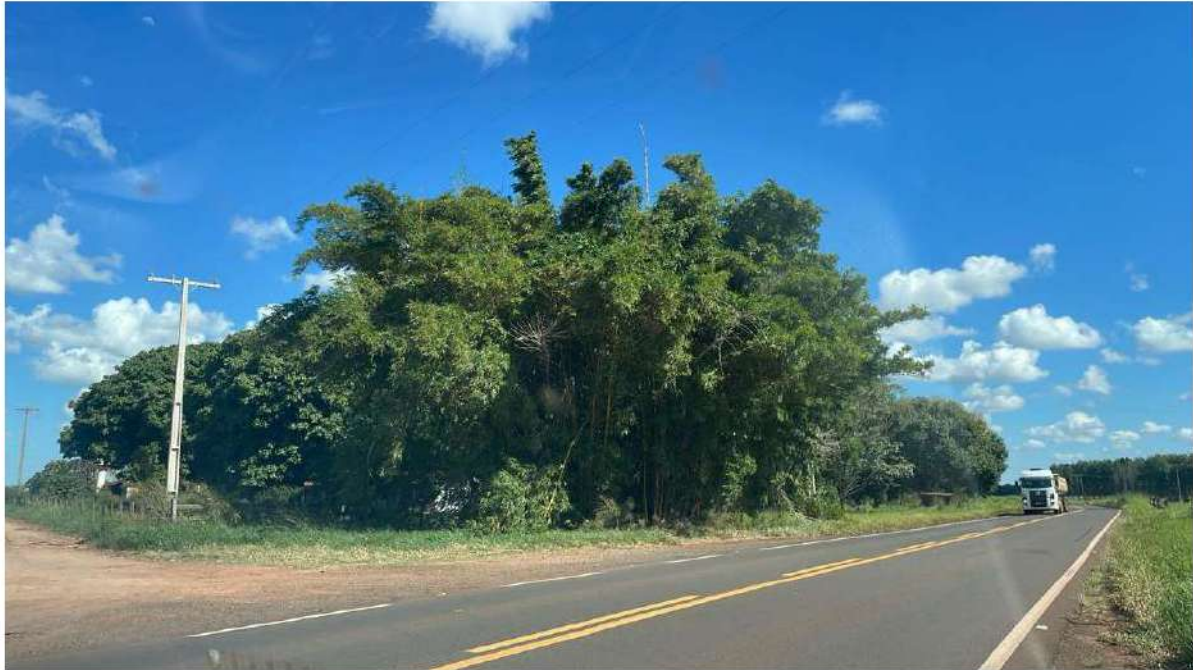
PONTO 17 - SEM NOME