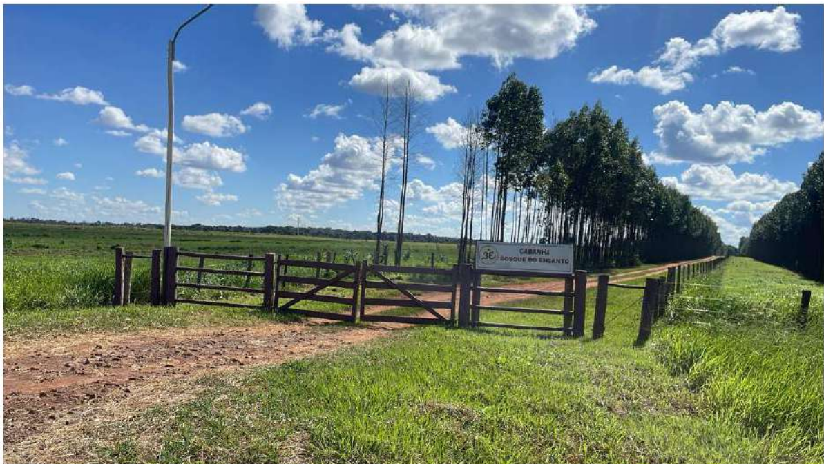
PONTO 18 - FAZ. CABANHA BOSQUE DO ENCANTO / RANCHO JP