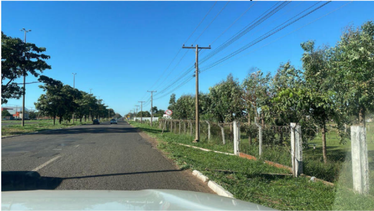
PONTO 07 - CAMPO DE FUTEBOL - AV. GURY MARQUES