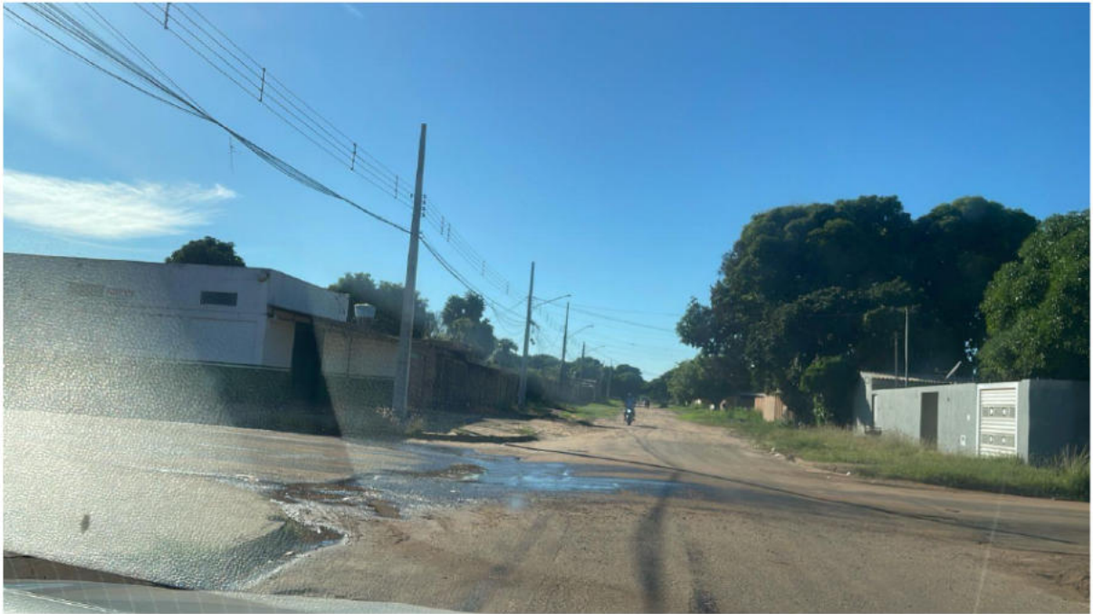
CONVERSÃO À ESQUERDA