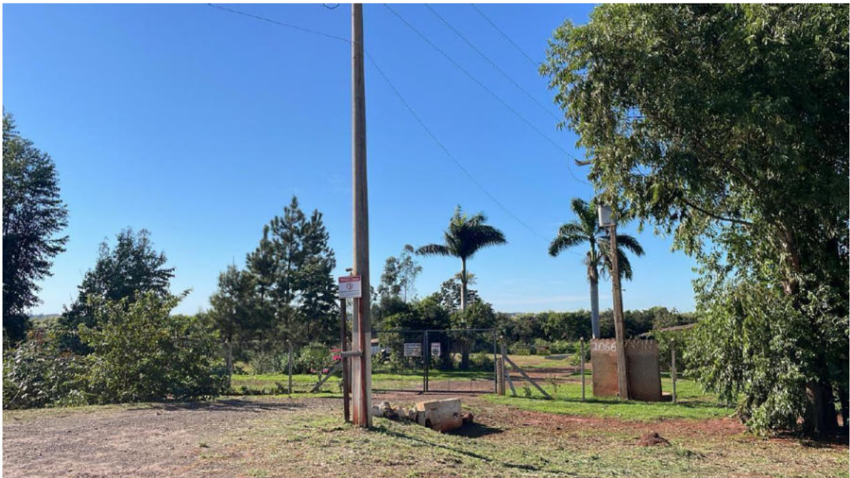
PONTO 11 - ANEL VIÁRIO