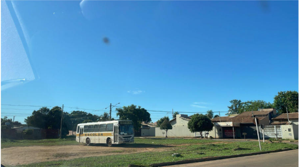
INÍCIO DA LINHA - PONTO 01 - RUA MARCOS FELIZ, JD. LOS ANGELES