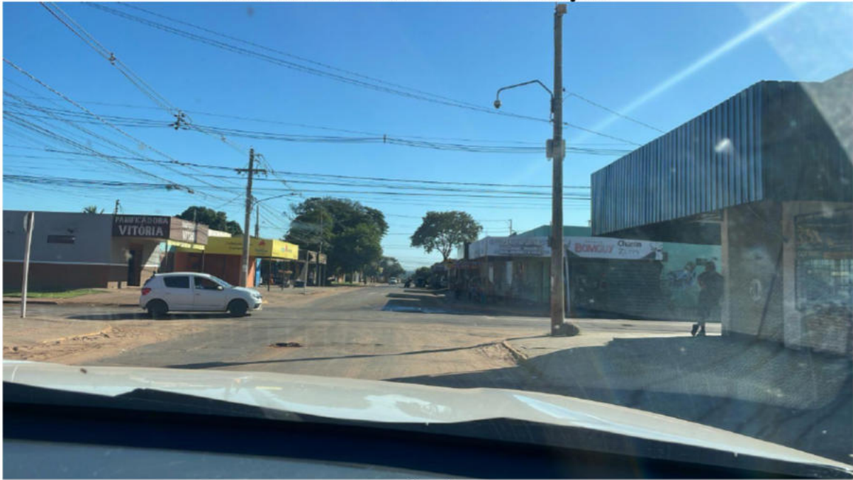
CONVERSÃO À DIREITA