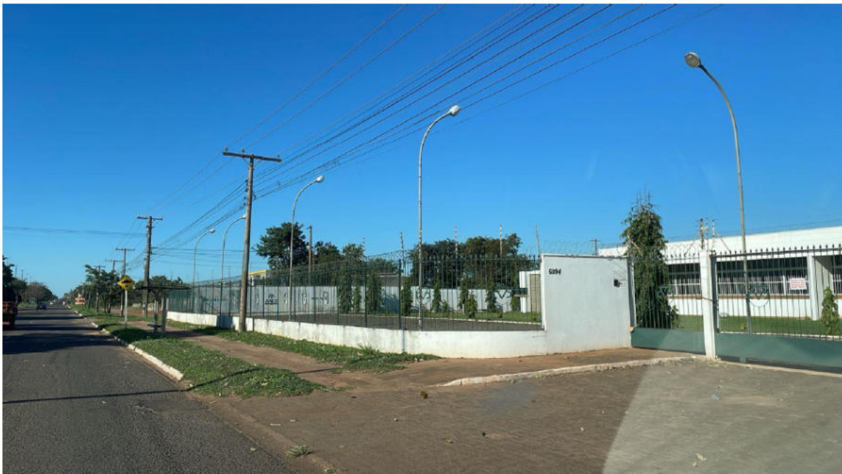
PONTO 08 - ABCZ - AV. GURY MARQUES