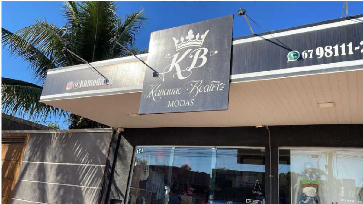
PONTO 03 - LOJA KB MODAS - RUA CASSIM CONTAR