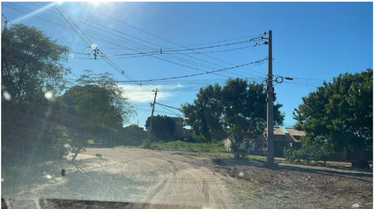
CONVERSÃO À ESQUERDA