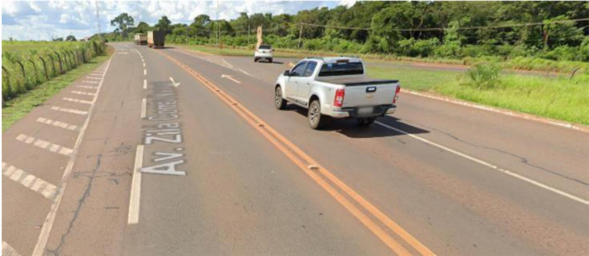
ACESSO À MS-040