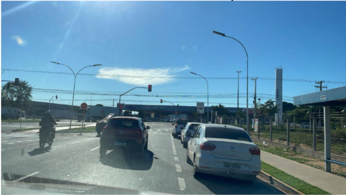
CONVERSÃO À DIREITA