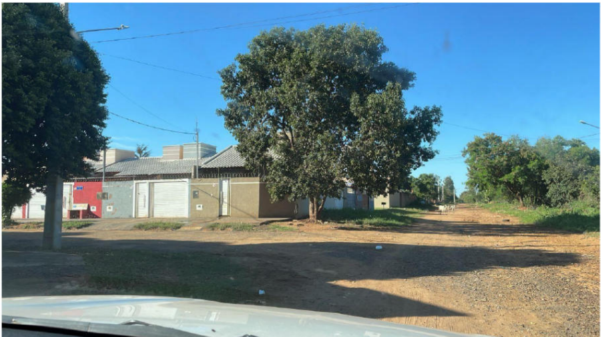
CONVERSÃO À ESQUERDA