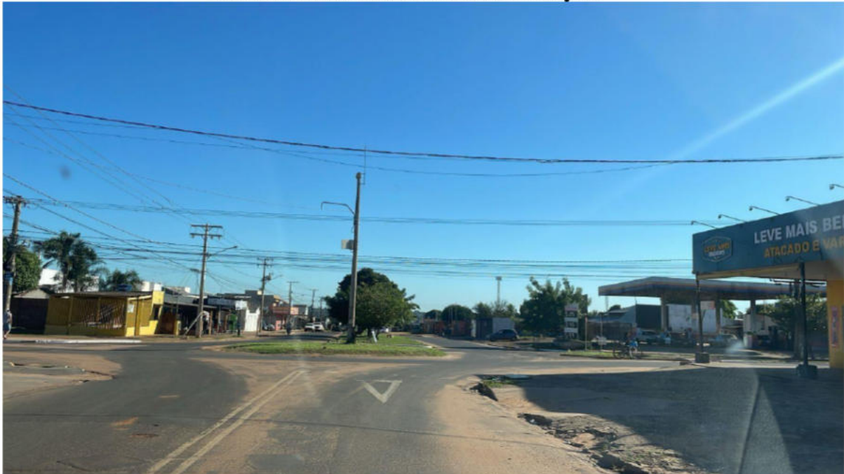
ROTATÓRIA SEGUNDA SAÍDA À DIREITA