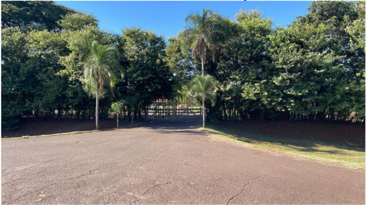
PONTO 10 - ANEL VIÁRIO