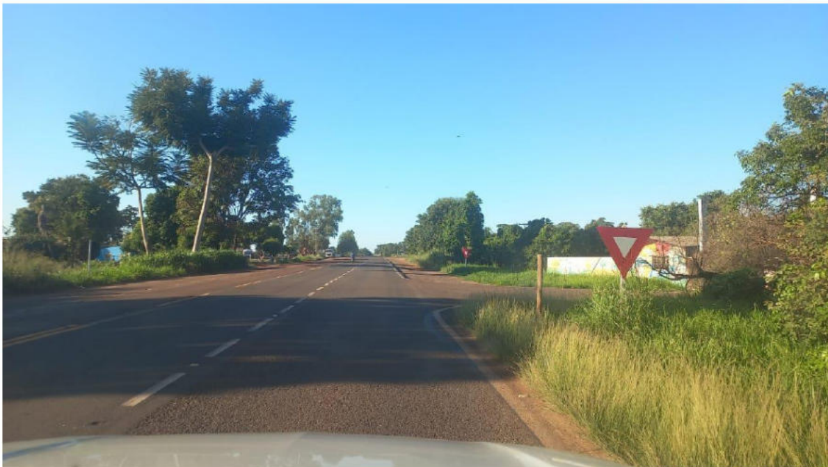
CONVERSÃO À DIREITA - ACESSO À ESCOLA