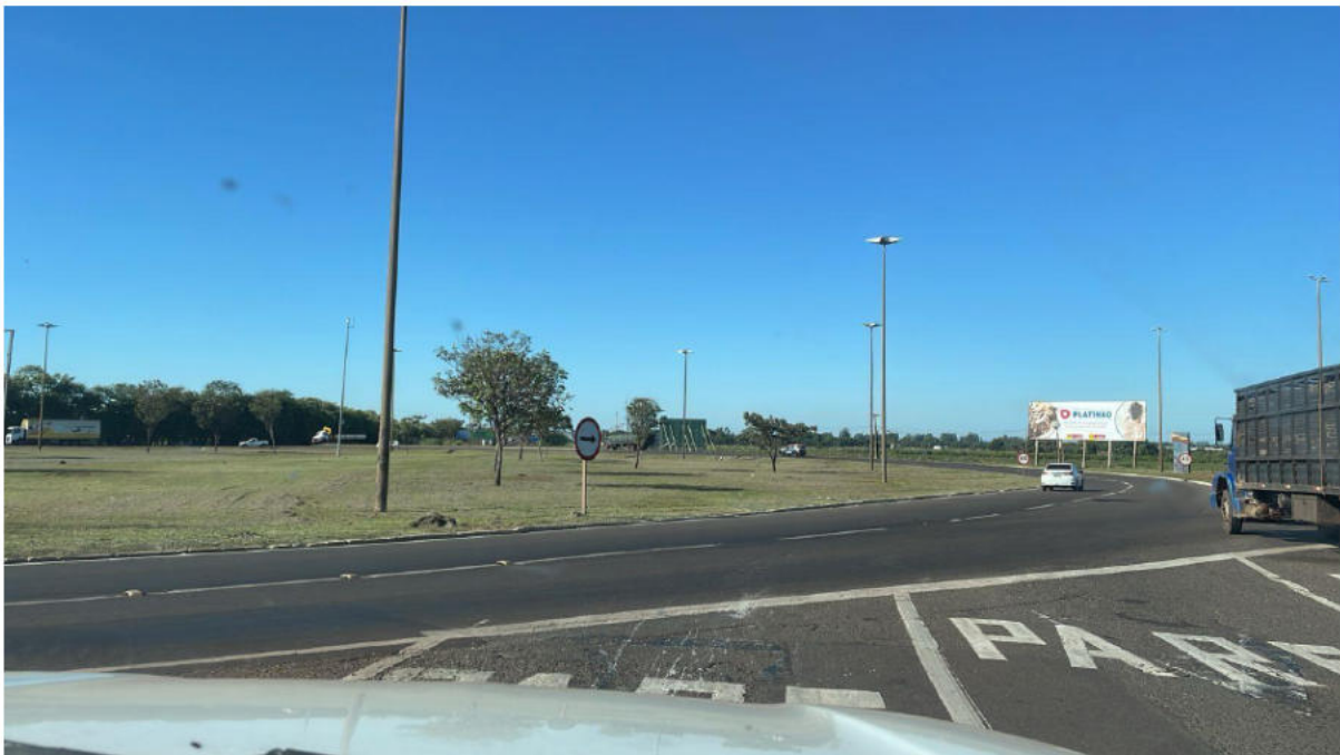
ROTATÓRIA TERCEIRA SAÍDA - SENTIDO ANEL VIÁRIO E MS-040