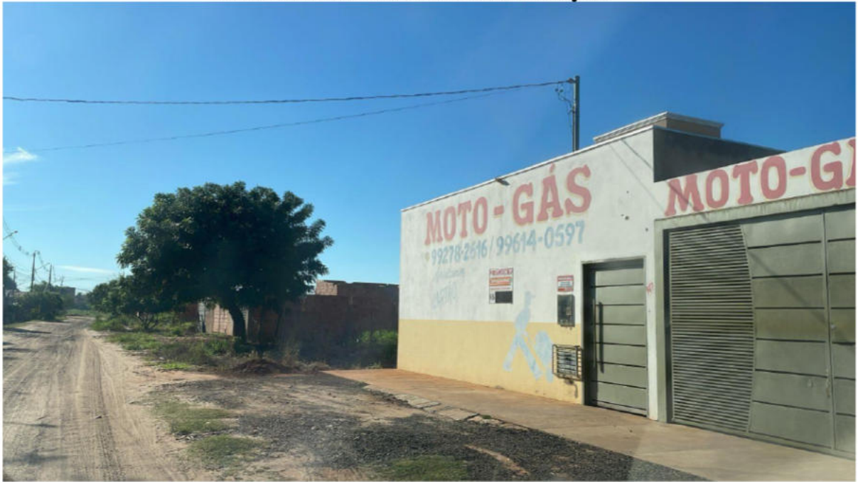
PONTO 04 - MOTO GÁS - RUA CASSIM CONTAR