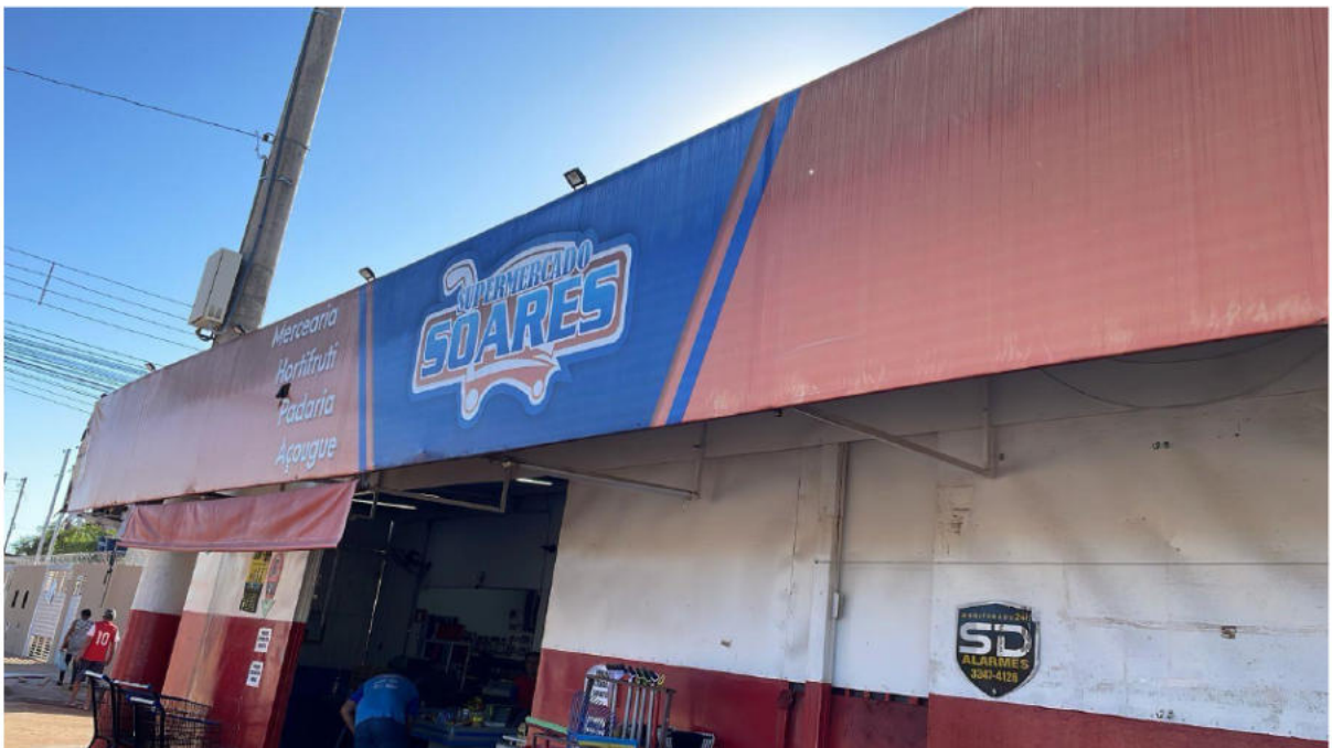
PONTO 02 - SUPERMERCADO SOARES - RUA ENGENHEIRO PAULO FRONTIN