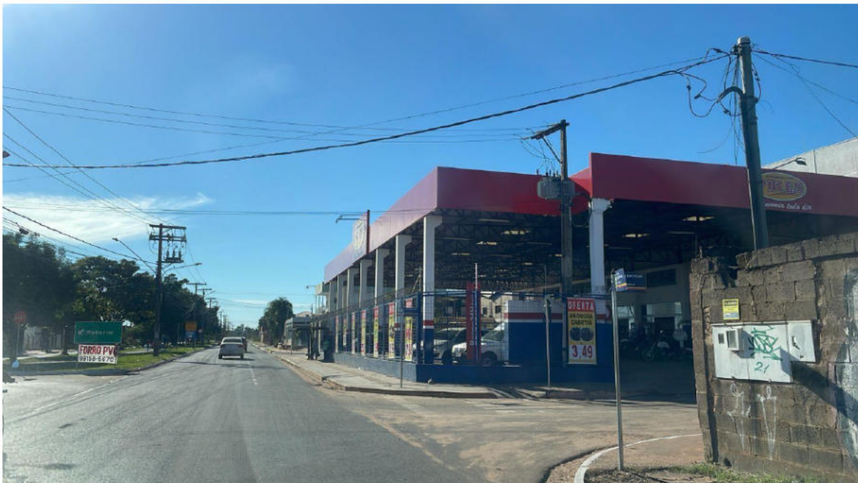
PONTO 05 - SUPERMERCADO PIRES - AV. CAFEZAIS