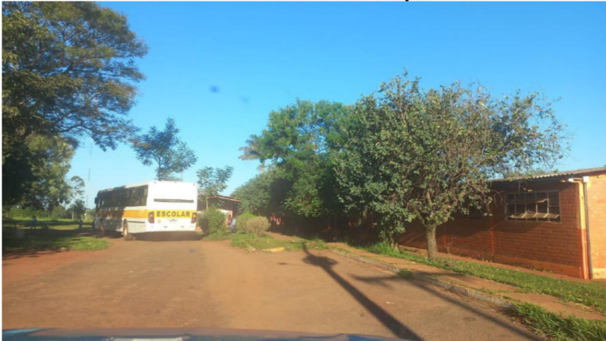
FINAL - E.M. AGRÍCOLA GOV. ARNALDO ESTEVÃO DE FIGUEIREDO