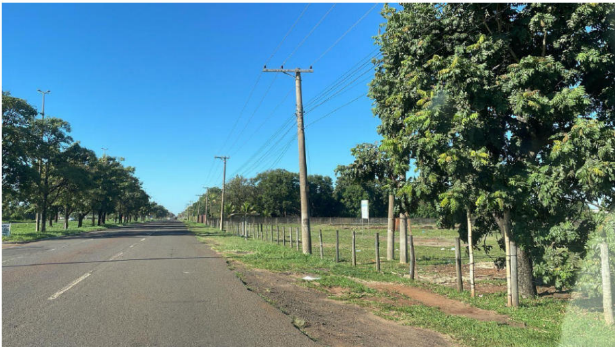
PONTO 06 - AV. GURY MARQUES