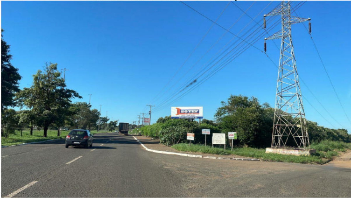
PONTO 09 - AV. GURY MARQUES