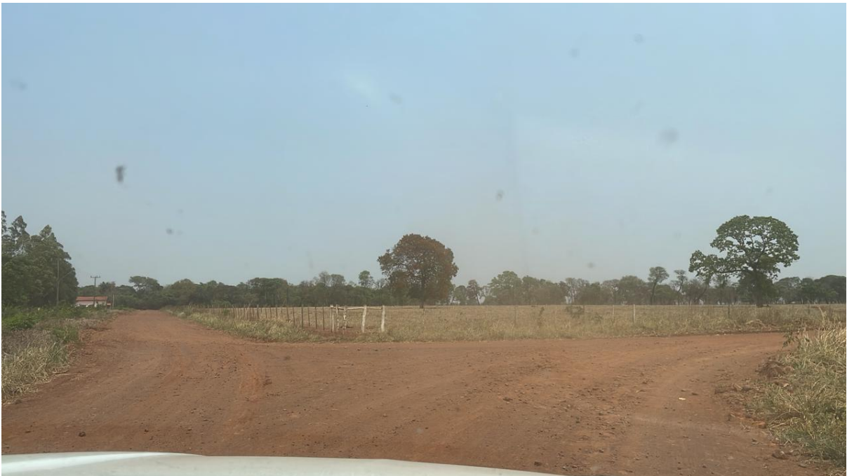
PONTO 14 - S/N