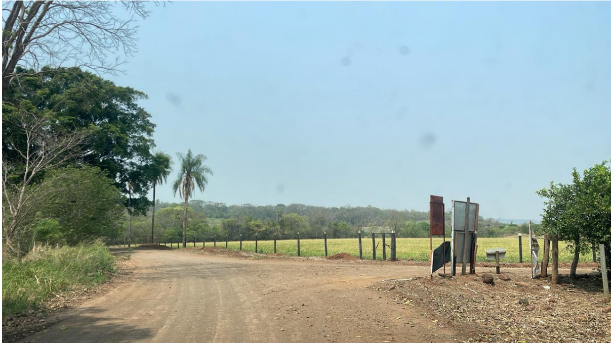
PONTO 02 - S/N