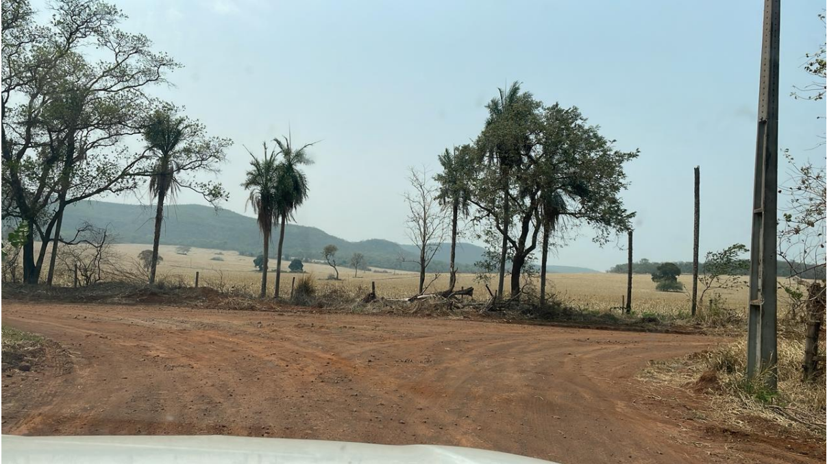
CONVERSÃO A DIREITA