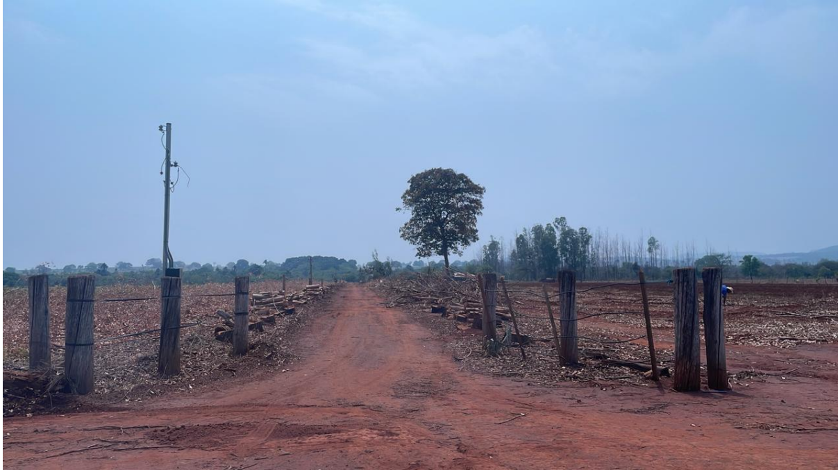
PONTO 15 - S/N