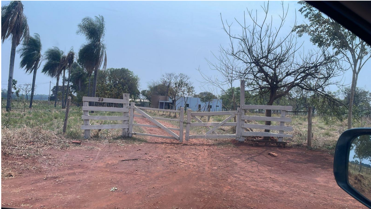
PONTO 13 -S/N