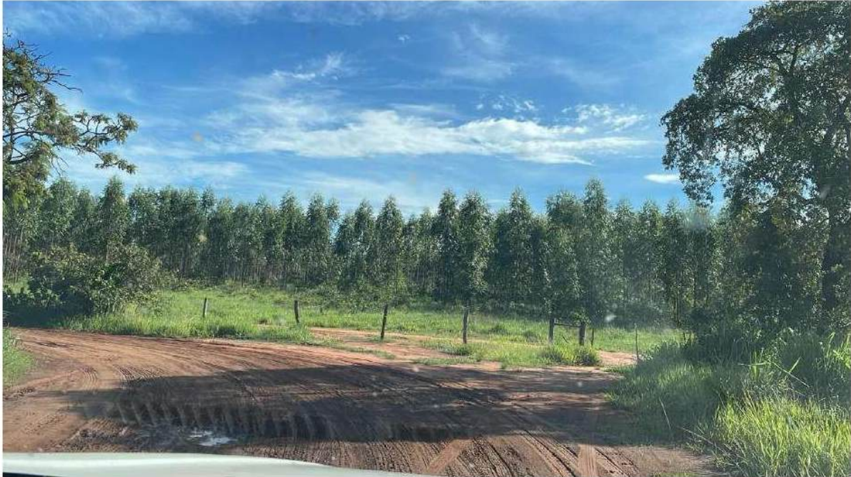
PONTO 02 - RANCHO VÔ IRANCISCO / RETORNO (VESPERTINO)