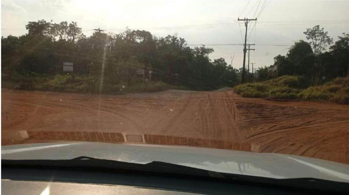
PONTO 03 - CHÁCARA CANTINHO DA PAZ