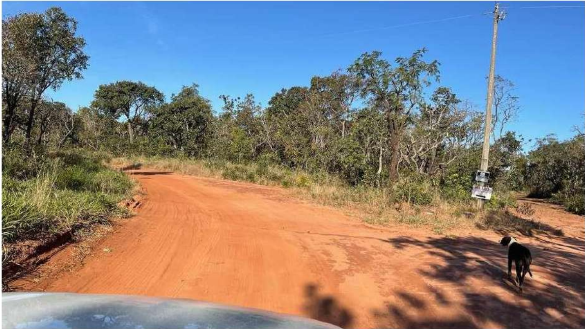
CONVERSÃO À ESQUERDA