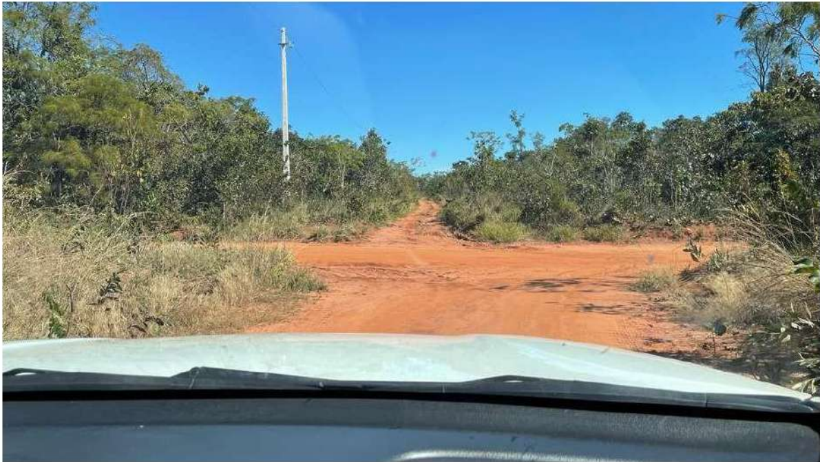
CONVERSÃO À DIREITA