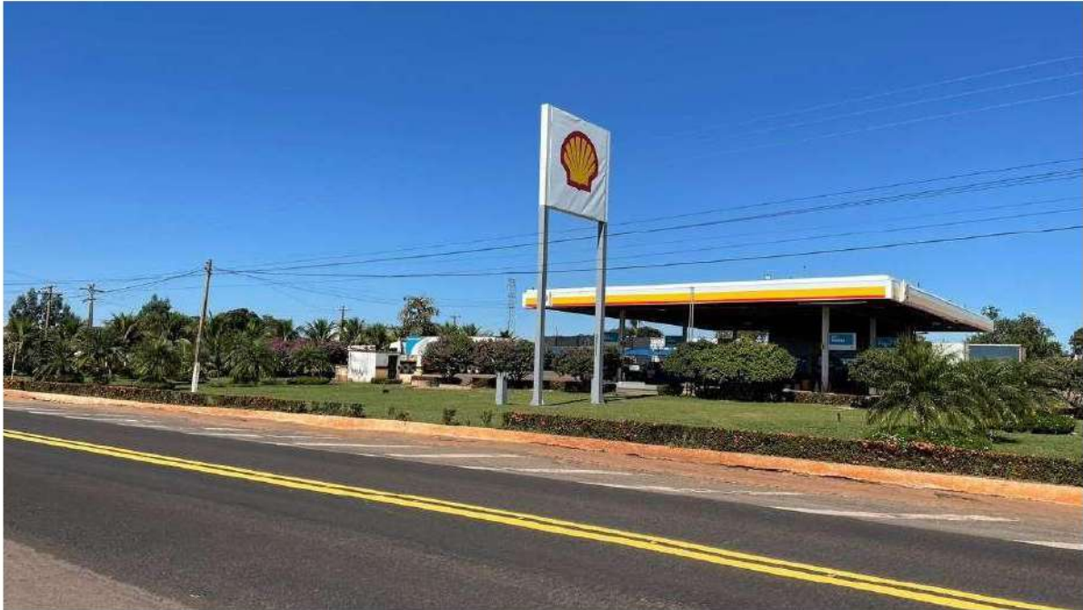
INÍCIO DA LINHA - POSTO SIMARELLI/PARADA 67 BR 262 - PONTO 01