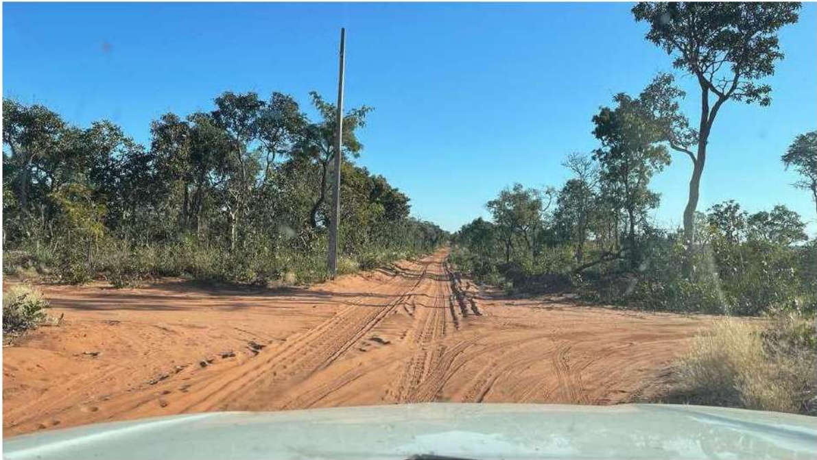
CONVERSÃO À DIREITA