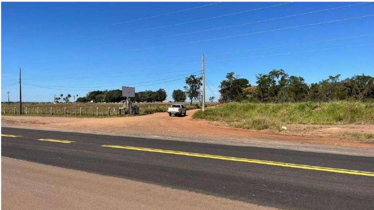
CONVERSÃO À DIREITA - ANTES DO AUTÓDROMO INTERNACIONAL DE CAMPO GRANDE