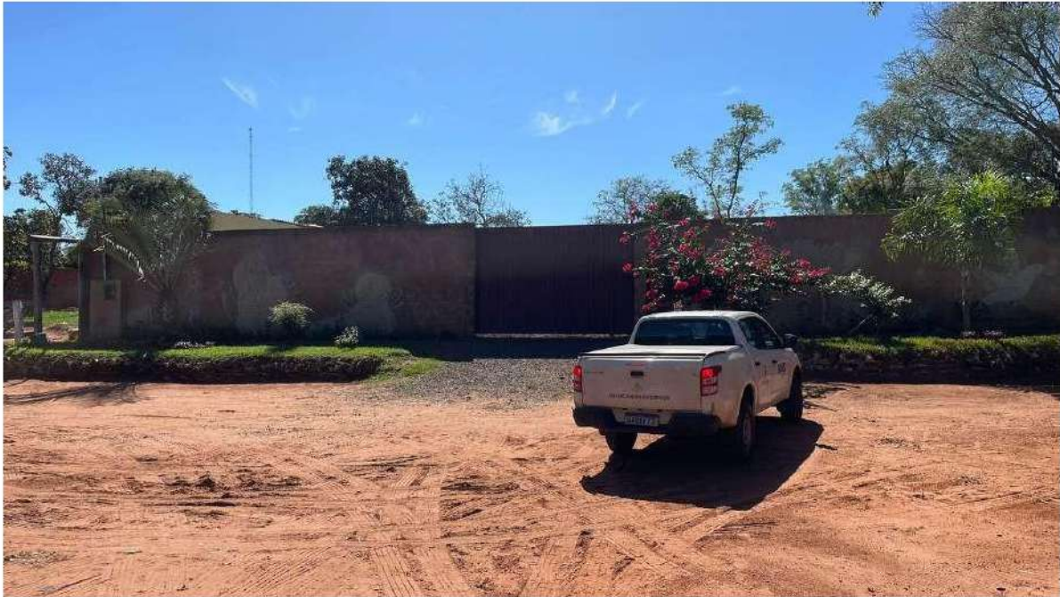
CLÍNICA DA ALMA FEMININA - PONTO 03 - RETORNO