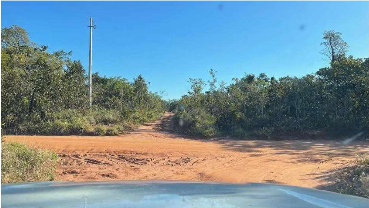
CONVERSÃO À ESQUERDA