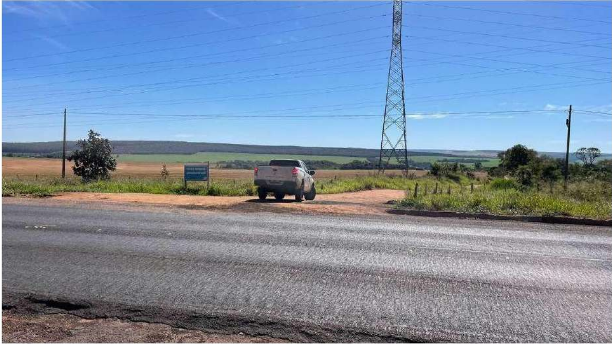
CONVERSÃO À ESQUERDA - ACESSO A E.M LEOVEGILDO DE MELO