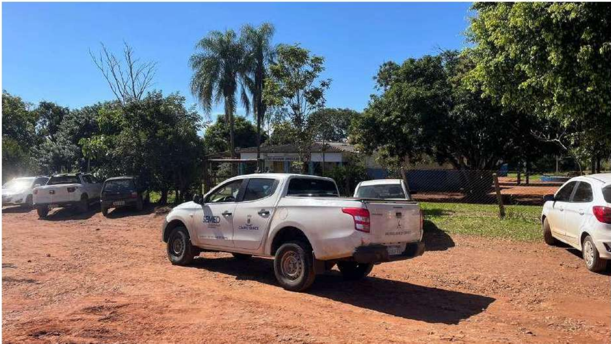
FINAL DA LINHA - E.M. LEOVEGILDO DE MELO