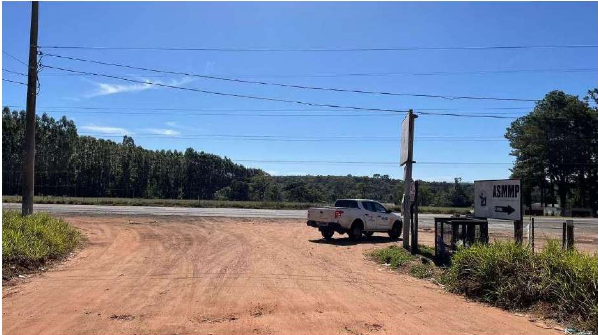
CONVERSÃO À DIREITA - ACESSO À BR 262