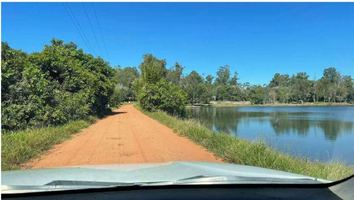
TRECHO SOBRE A LAGOA DO BALNEÁRIO ATLÂNTICO