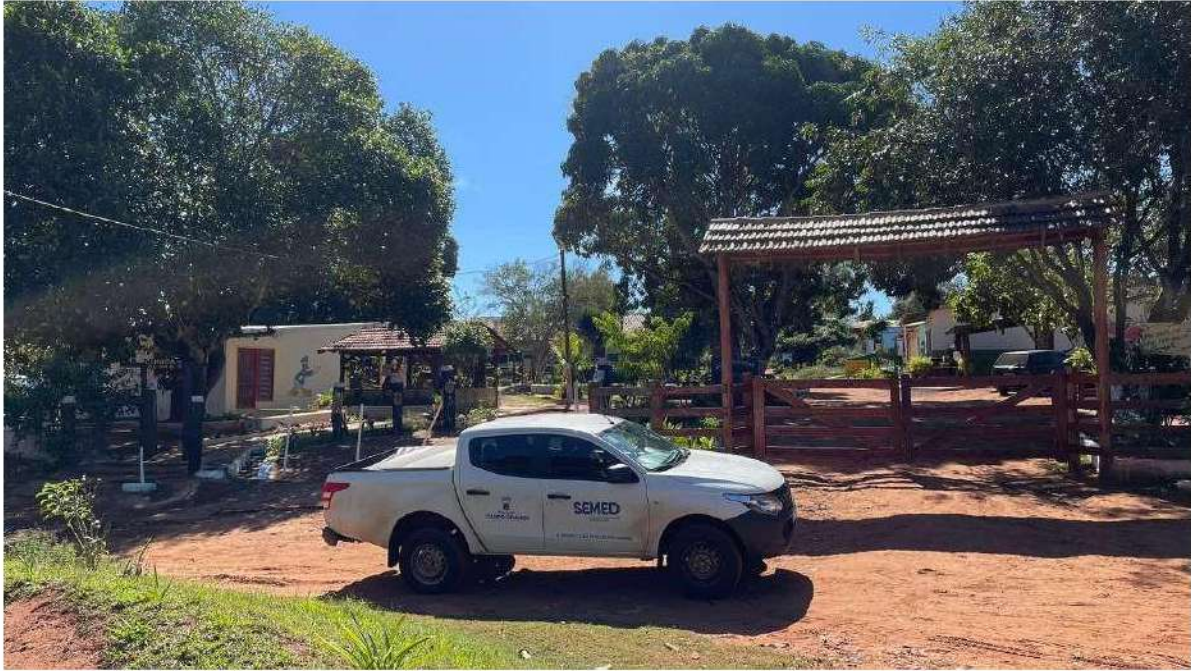
CLÍNICA DA ALMA MASCULINA - PONTO 02