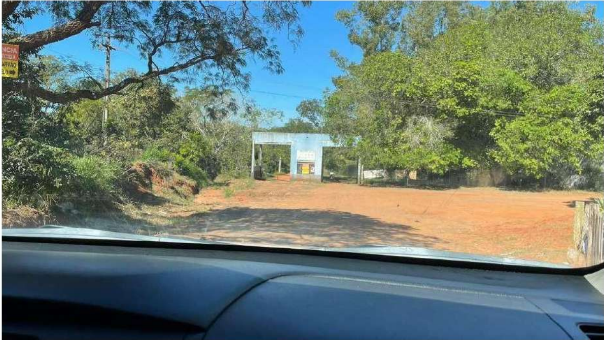
ENTRADA DO BALNEÁRIO ATLÂNTICO