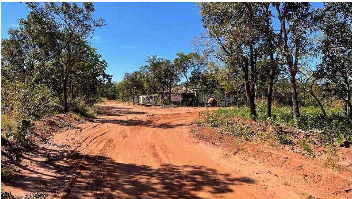
CONVERSÃO À DIREITA - ACESSO A CLÍNICA DA ALMA