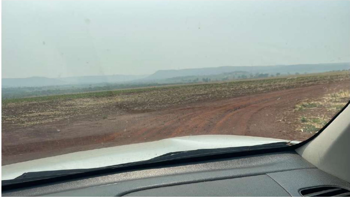
PONTO 03 - FAZ. PRIMAVERA - RETORNO