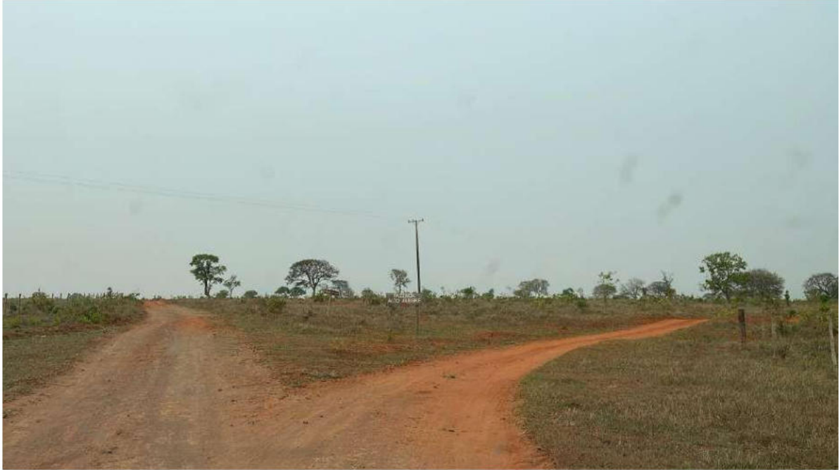
PONTO 04 - FAZ. ALTO ALEGRE