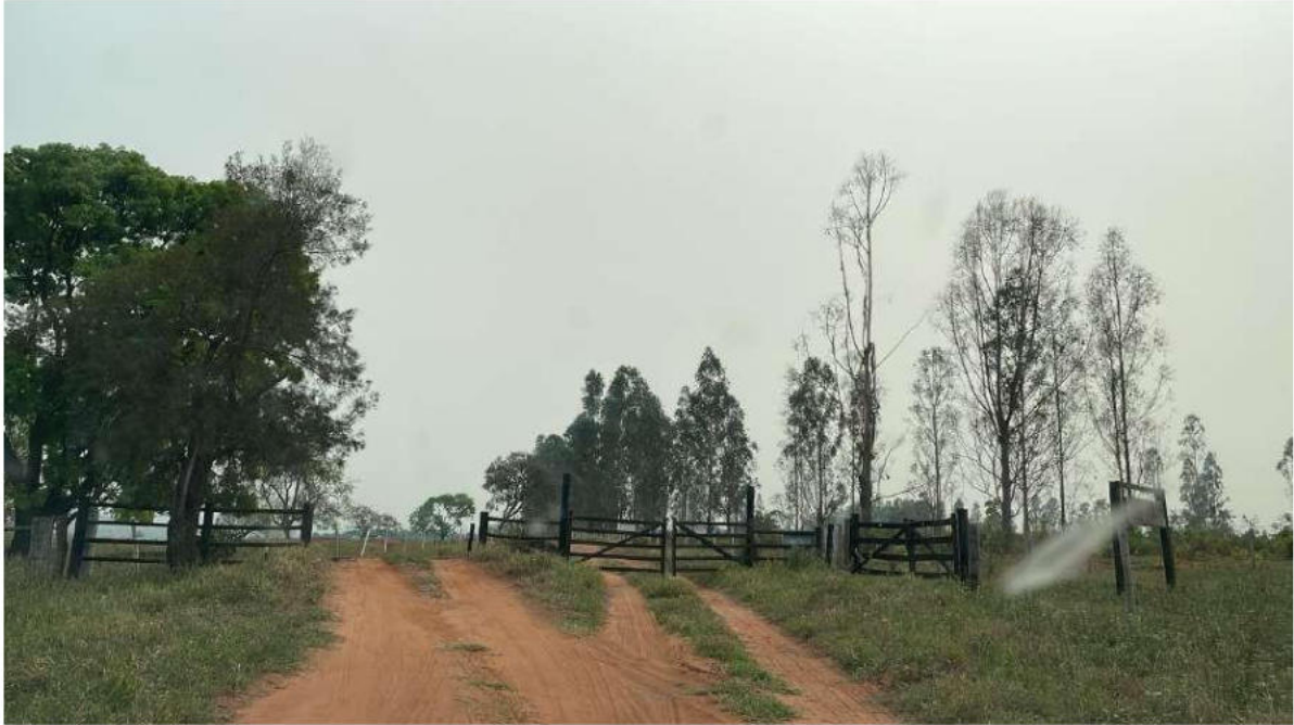
PONTO 02 - FAZ. NOVA ALVORADA