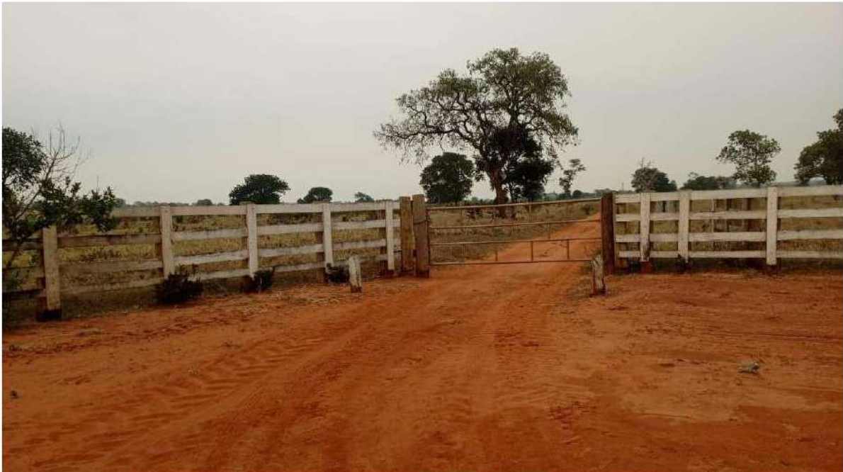
PONTO 09 - FAZ. CHAPADÃO