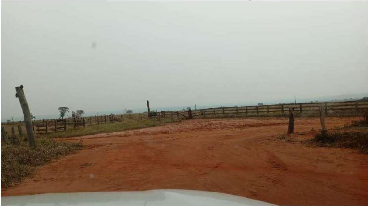
PONTO 08 - FAZ. FURNA