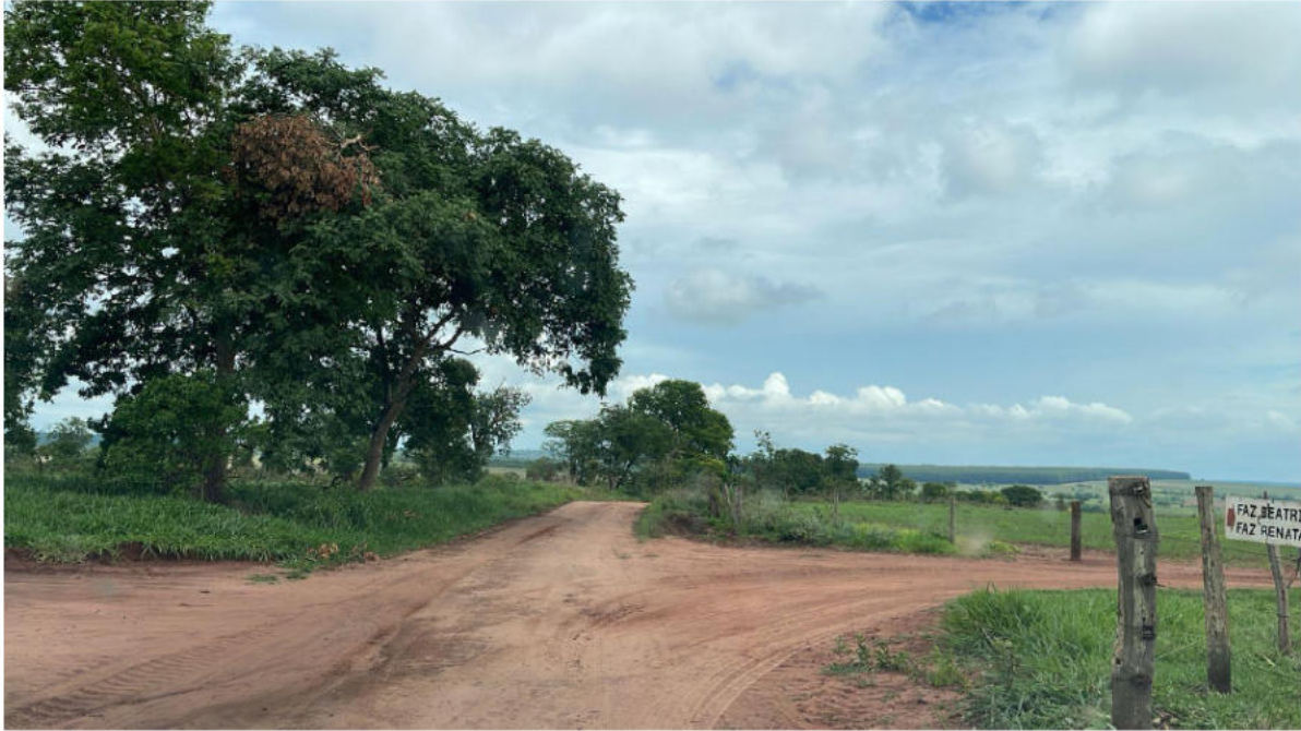
SEDE FAZ. DIVISA (REFERÊNCIA)