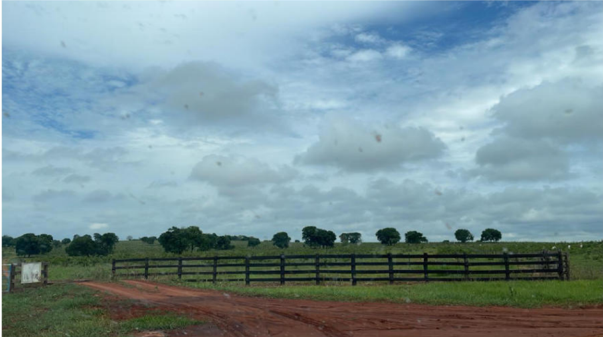
SEDE FAZ. RODEIO (REFERÊNCIA)