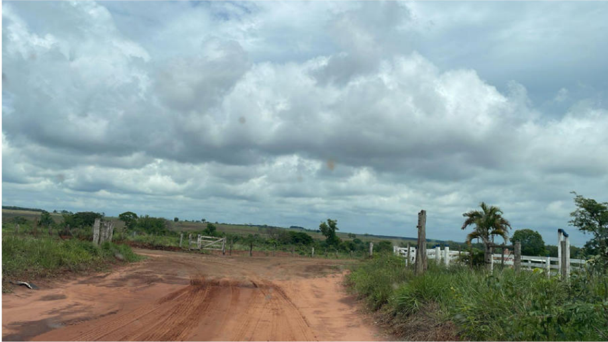
PONTO 07 - FAZ. RIO DOCE