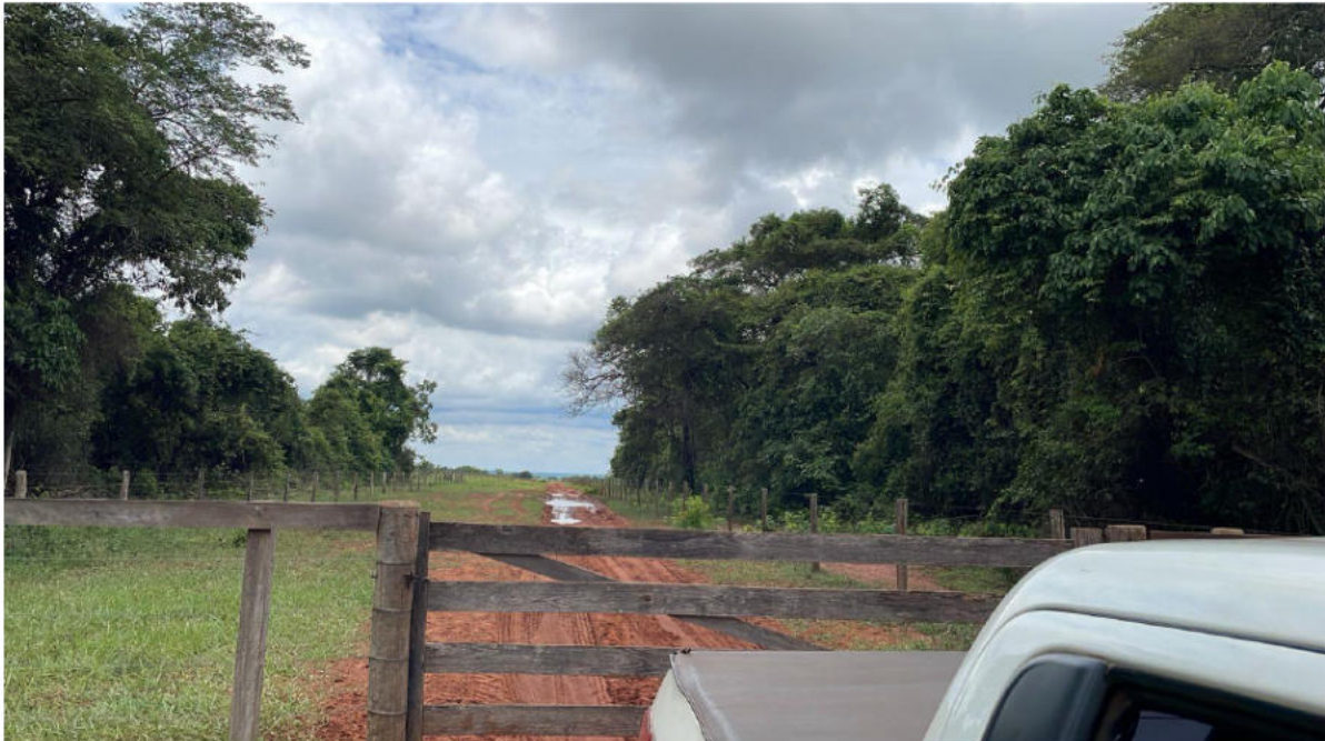
PONTO 09 - FAZ. SÃO LUIZ