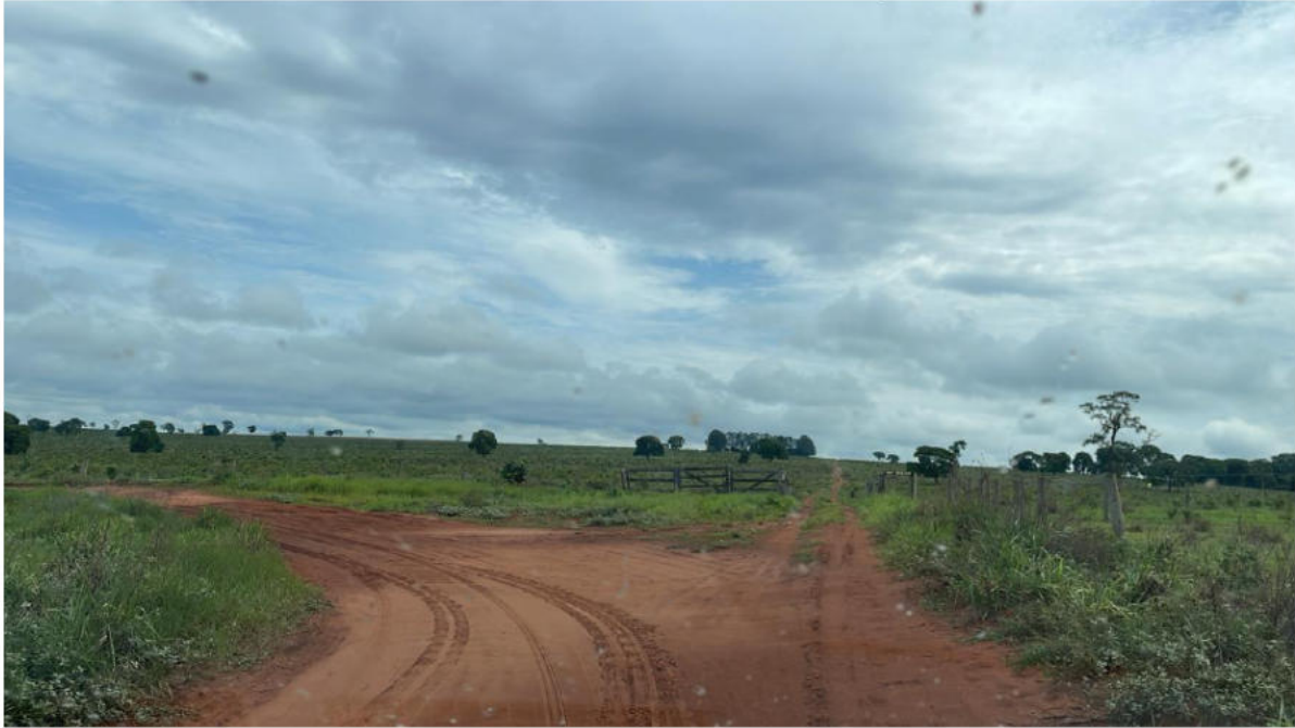
PONTO 03 - FAZ. RODEIO