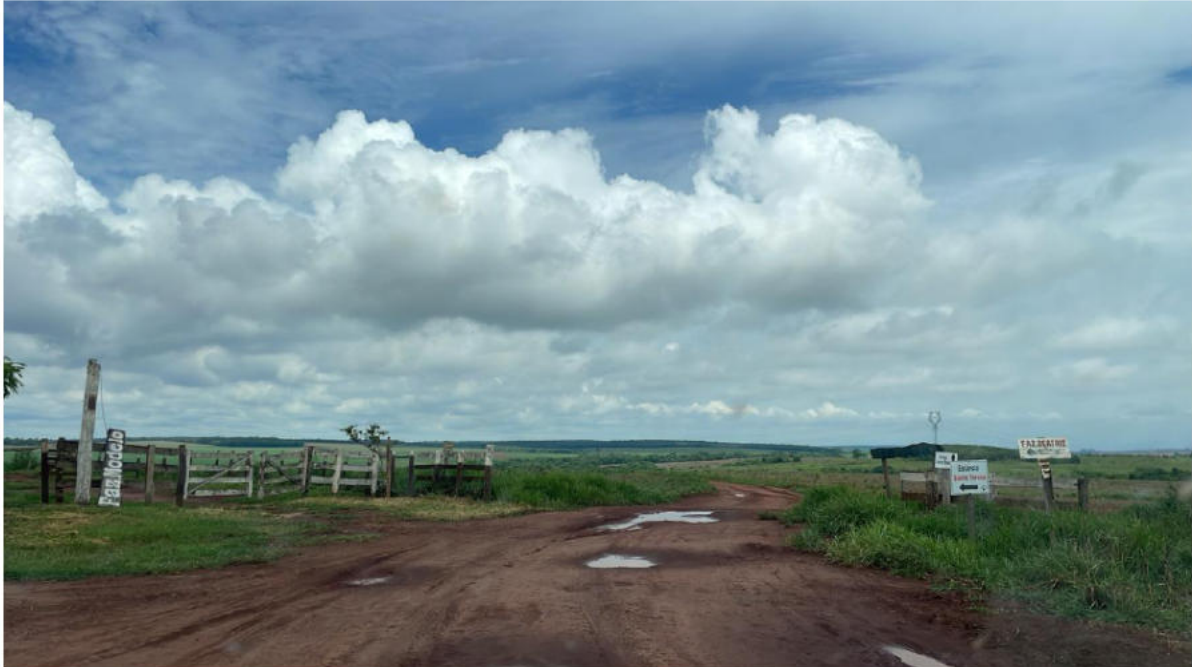
CONVERSÃO A DIREITA