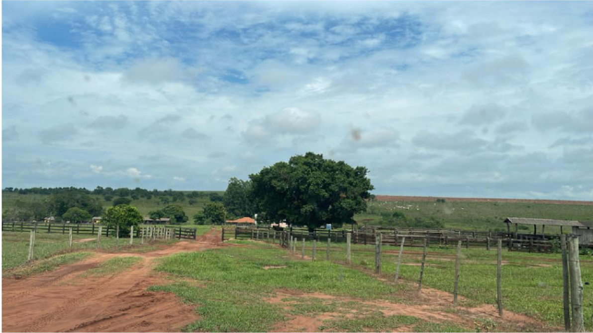
PONTO 04 - FAZ. ÁGUA LIMPA