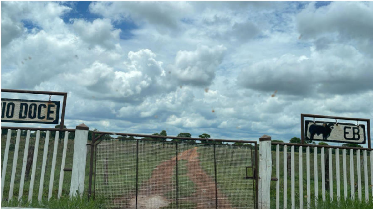
CONVERSÃO A ESQUERDA