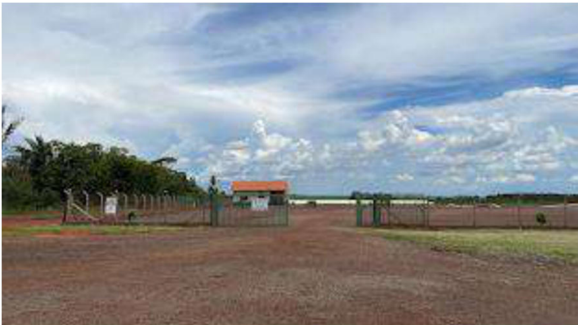
PONTO 09 - FAZ. LUZ DA LUA