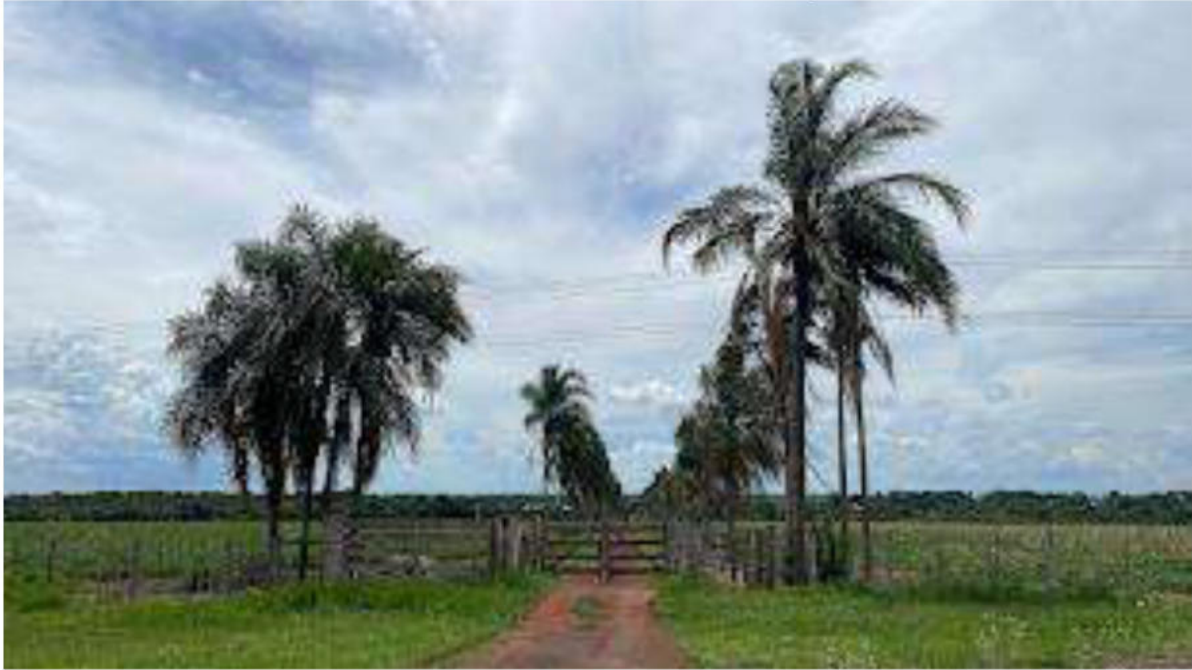
PONTO 08 - ARMAZÉM ICP CGR