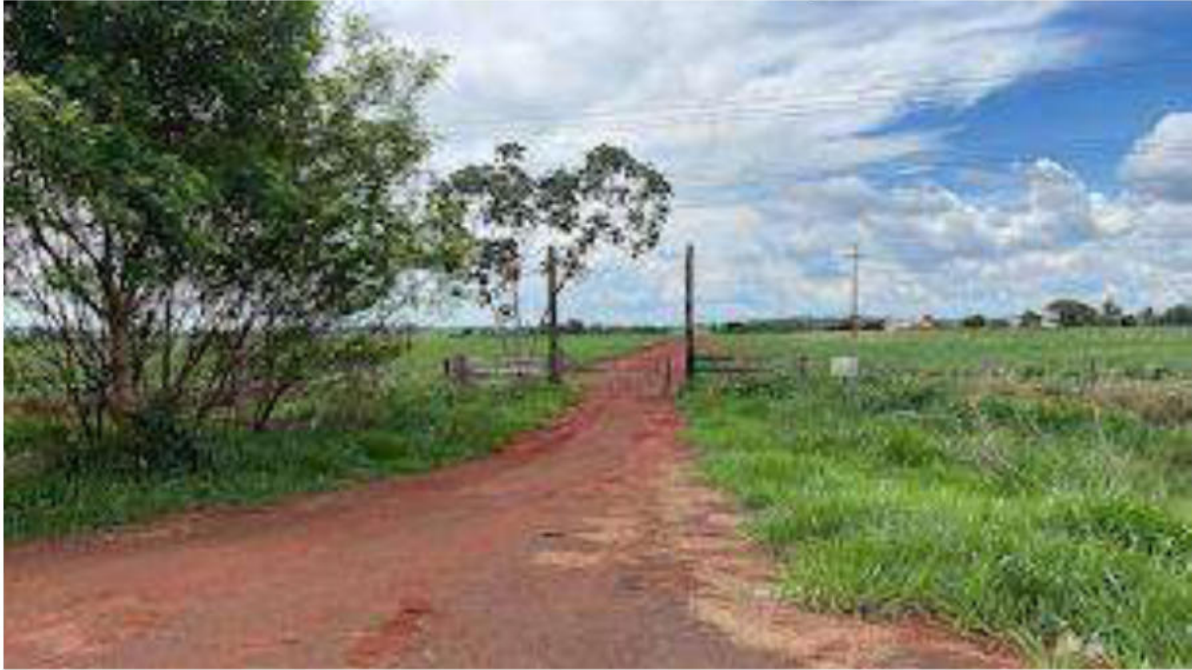
PONTO 04 - FAZ. SÃO JOSÉ