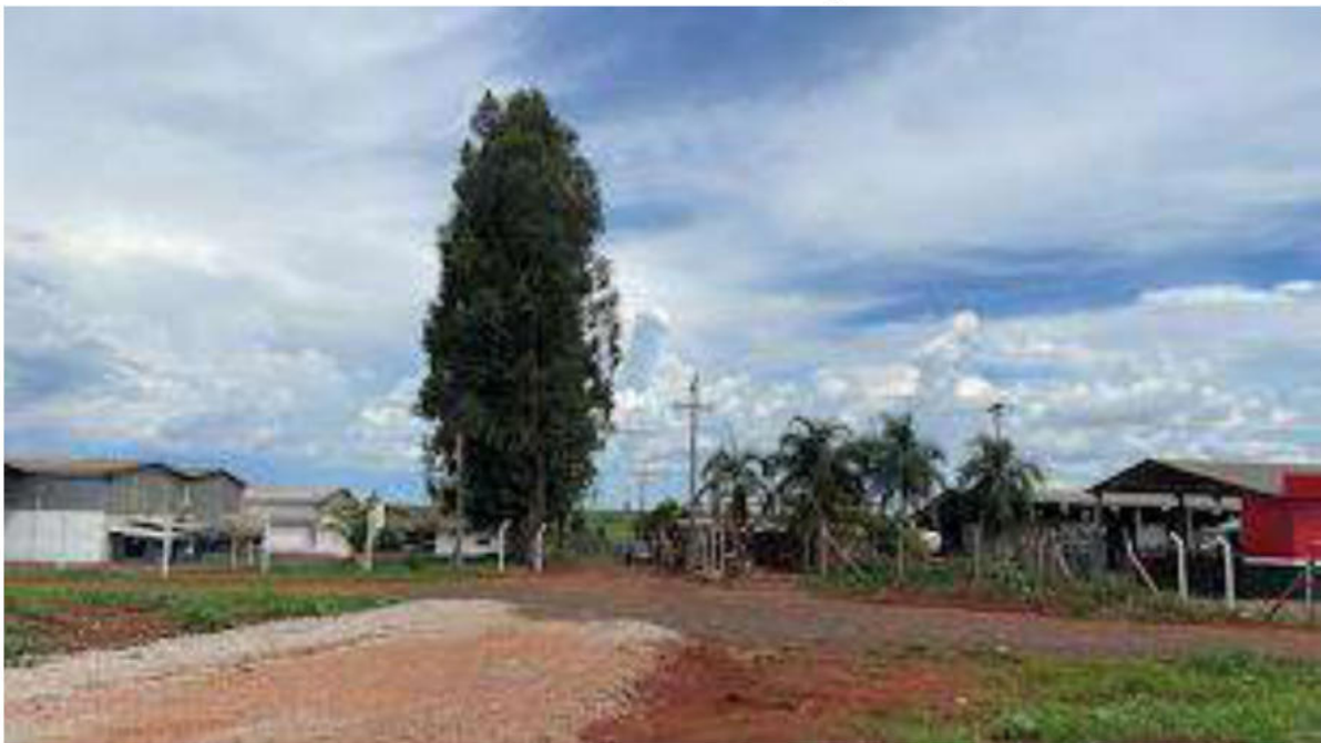
PONTO 07 - S/N