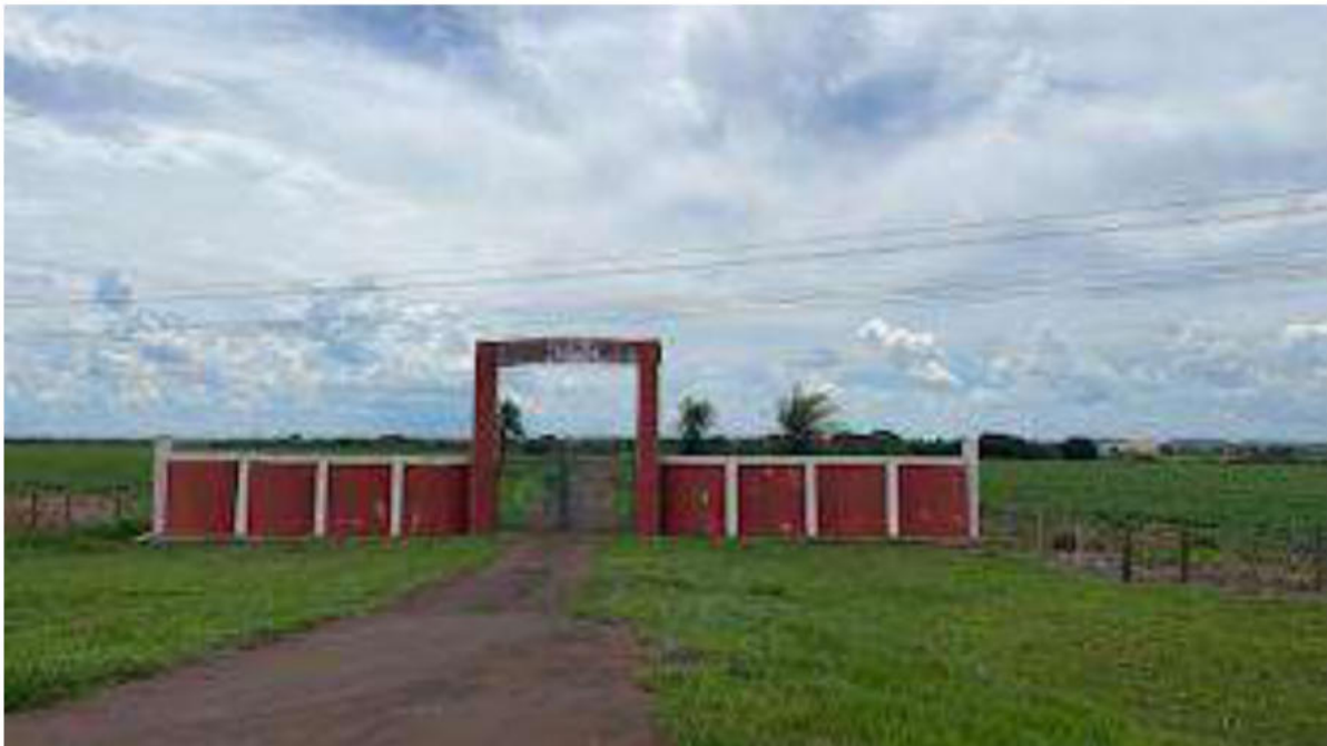
PONTO 05 - FAZ. S/N