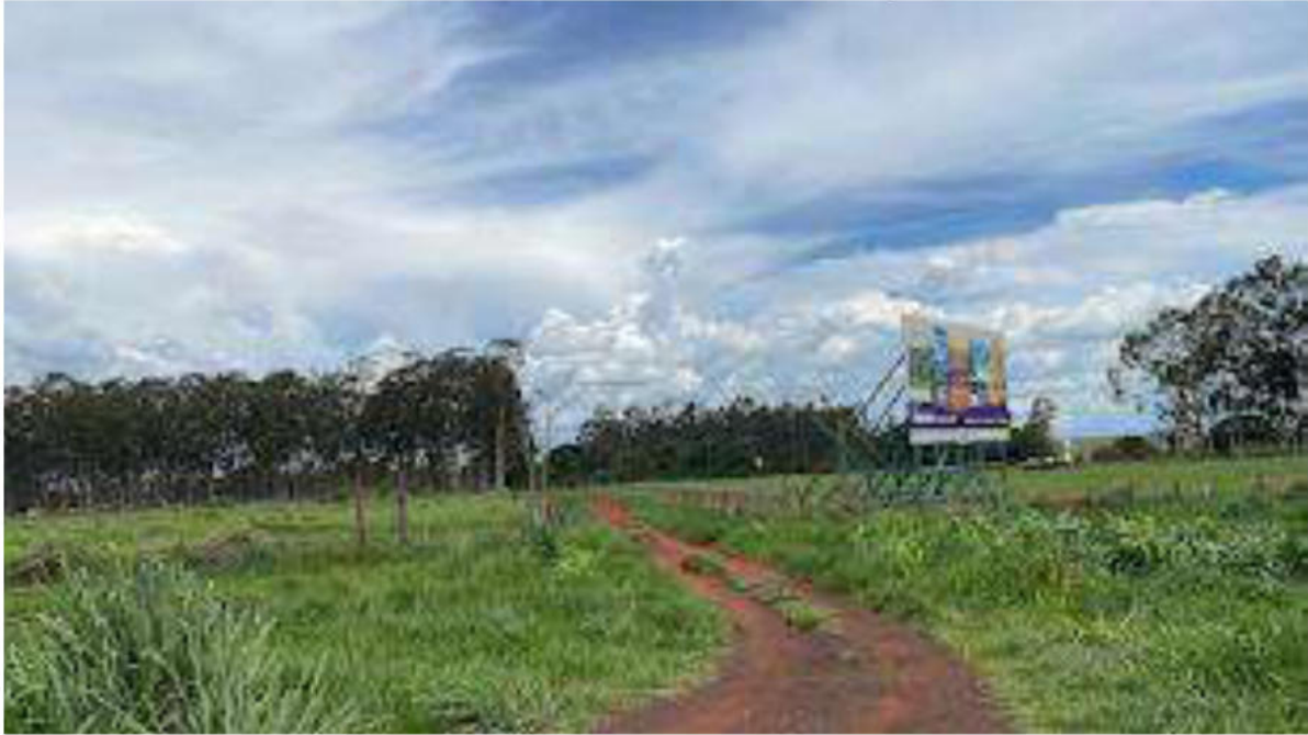
PONTO 06 - TECNOBLOCK NUTRIÇÃO ANIMAL