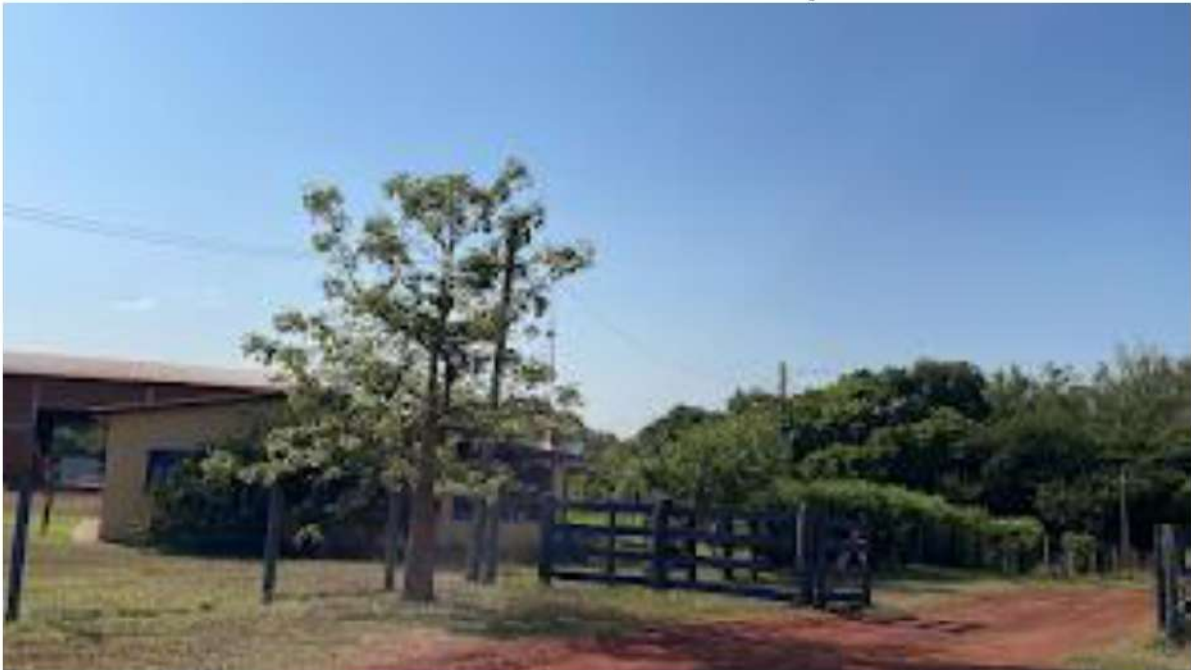
CONVERSÃO A DIREITA