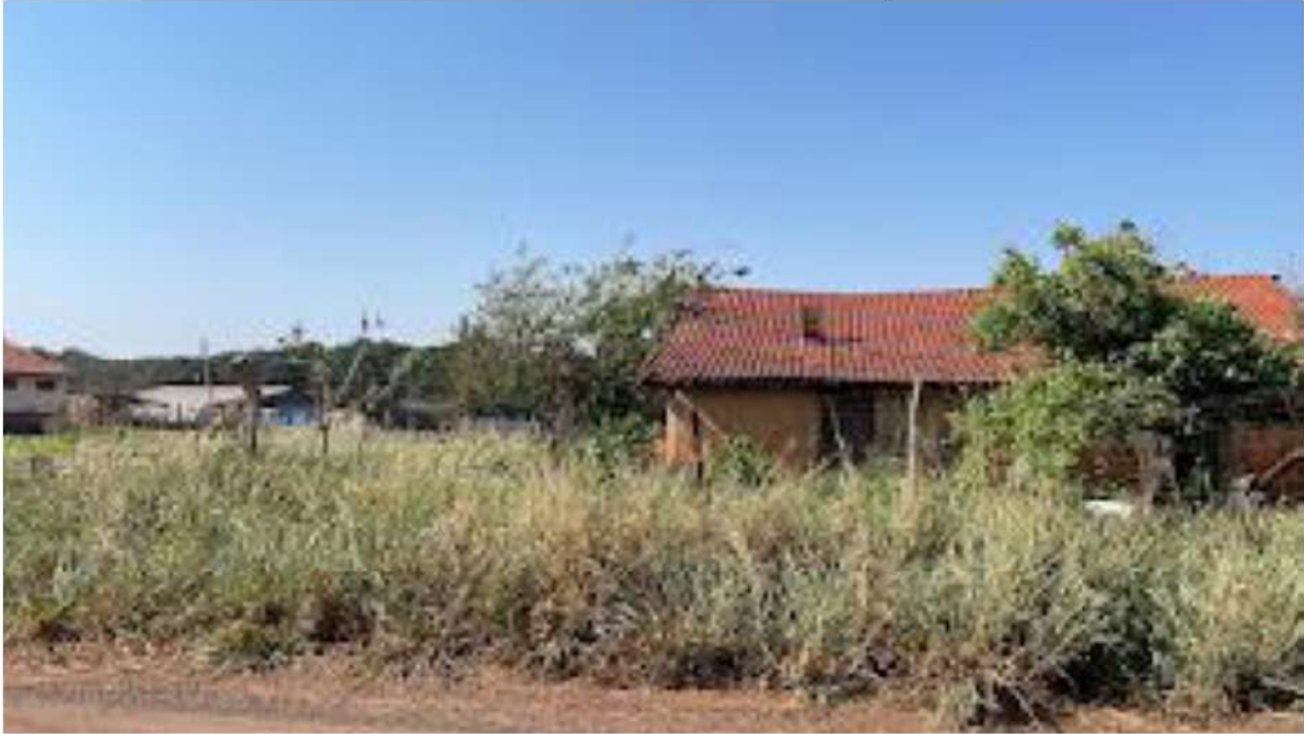
PONTO 05 - CHÁCARA FORTALEZA