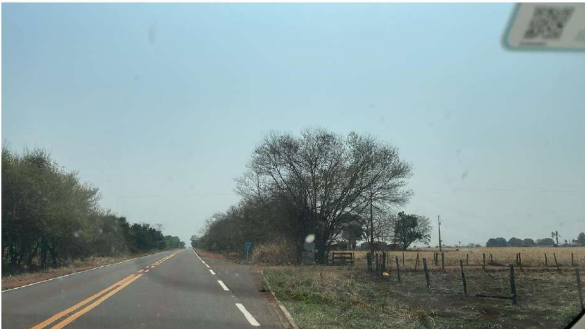
CONVERSÃO A DIREITA