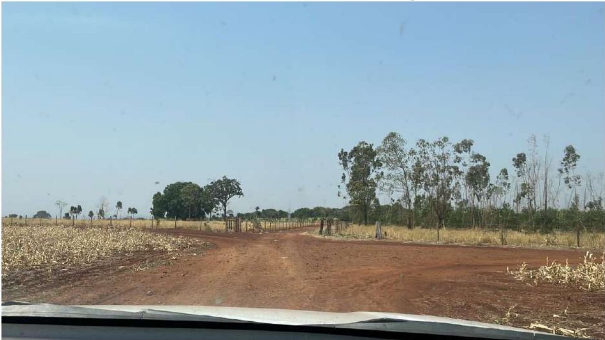
CONVERSÃO A DIREITA