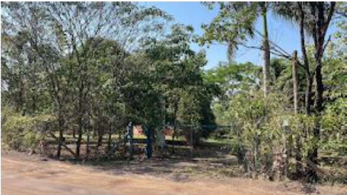
PONTO 06 - ESTÂNCIA VALE VERDE / RETORNO