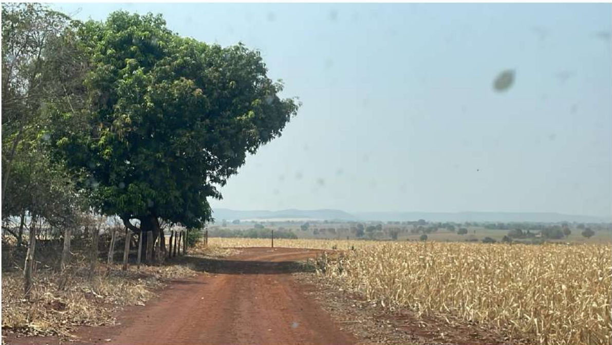
PONTO 09 - FAZ. CANGA