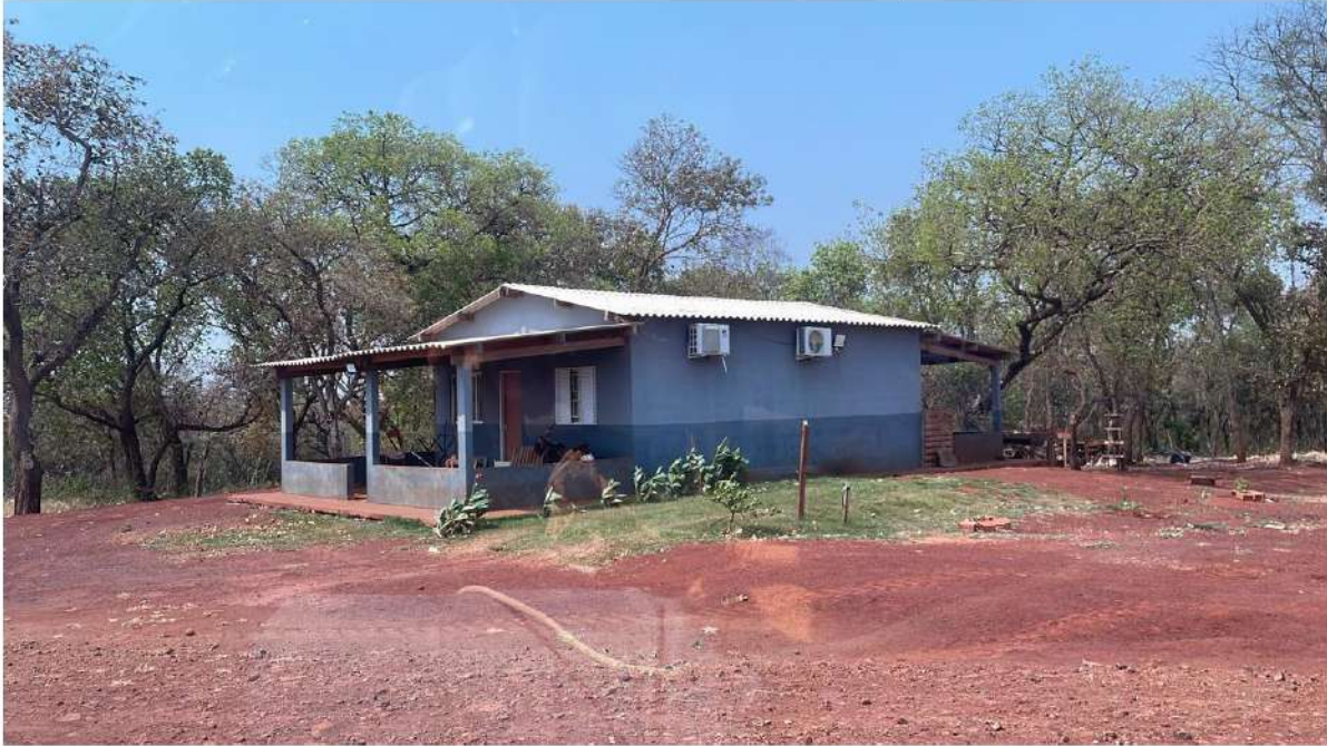
PONTO 10 - SEDE FAZ. CANGA