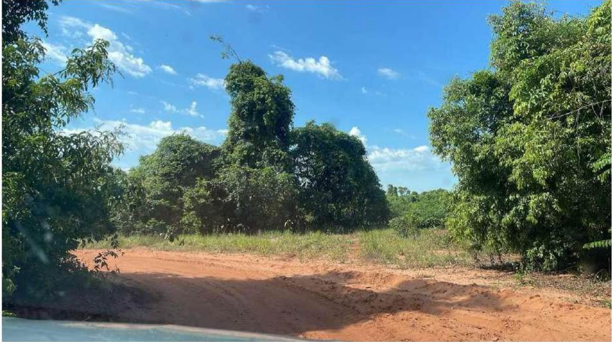
PONTO 08 - EMBARQUE DA FAZ. RECANTO ALEGRE (LEITERIA)