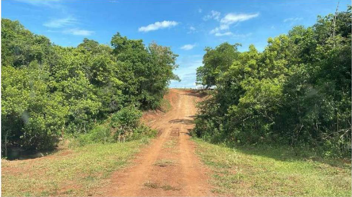
PONTO 02 - FAZ. PIONEIRA