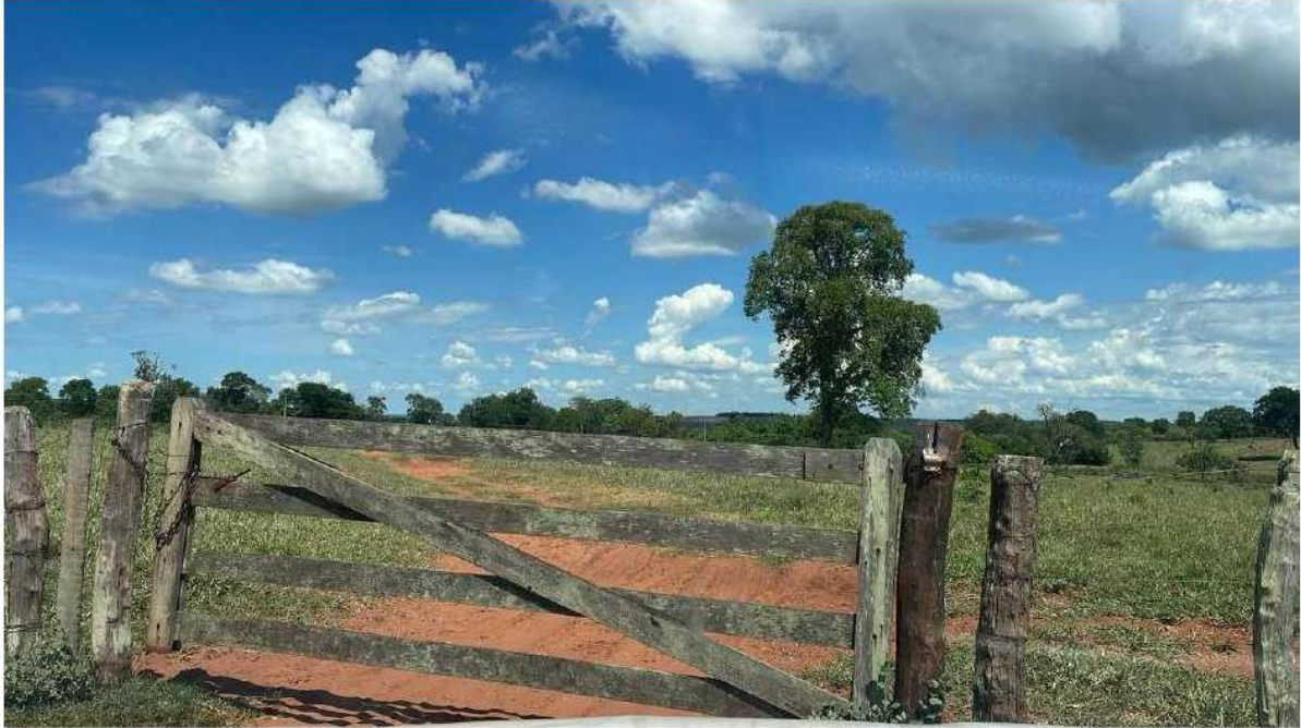
FAZ. COLINA (REFERÊNCIA)