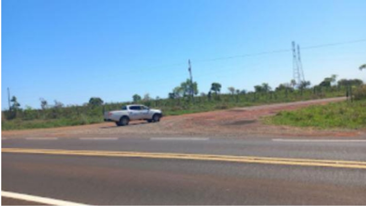
PONTO 14 - FAZ. MARANATA