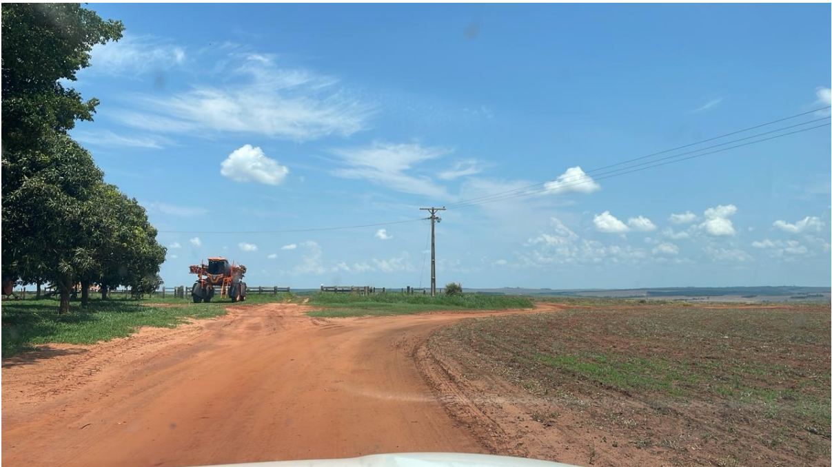
CONVERSÃO A ESQUERDA