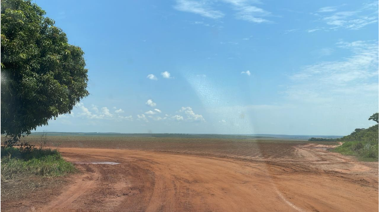
CONVERSÃO A DIREITA