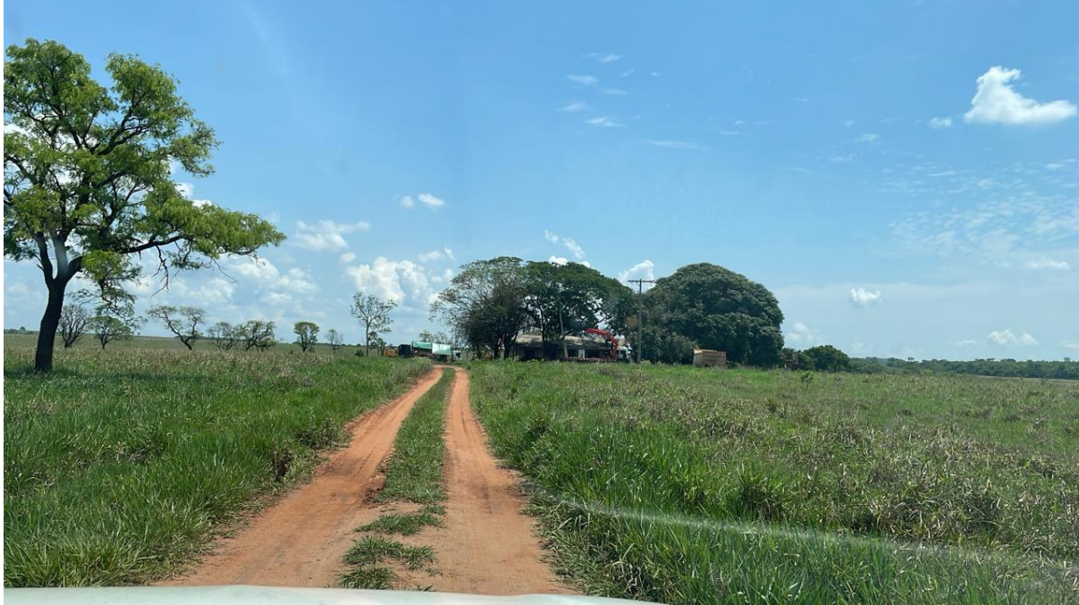
PONTO 07 - FAZ. MARCELA (CAMPINA)