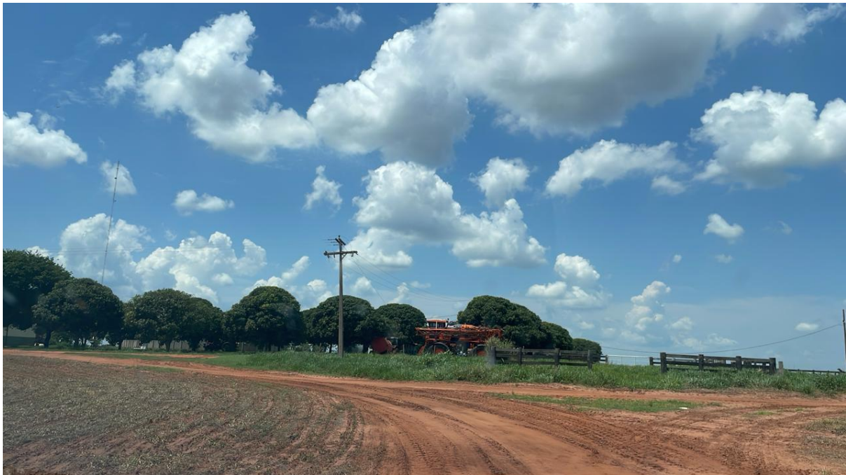
CONVERSÃO A ESQUERDA - ACESSO A FAZ. CAPÃO VERDE