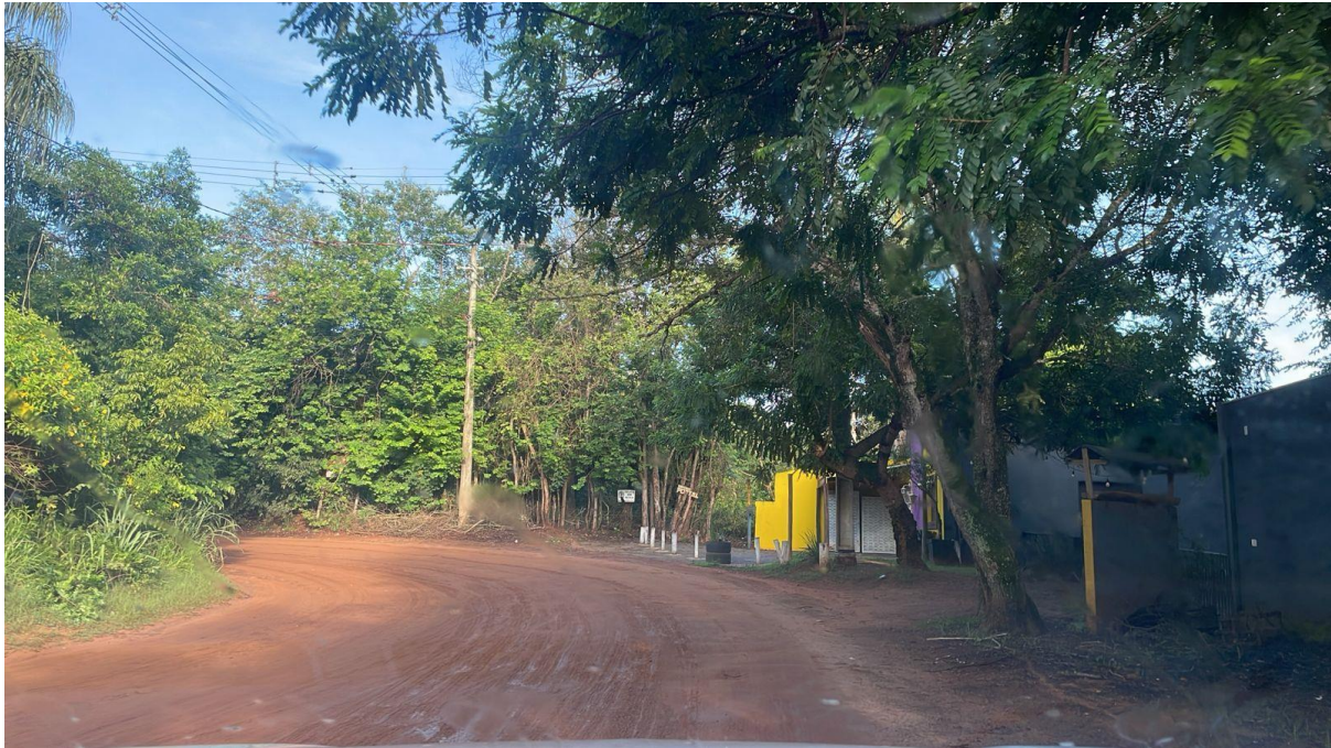
CONVERSÃO À DIREITA