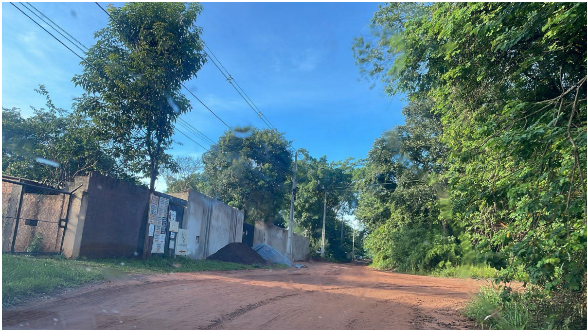
CONVERSÃO À DIREITA