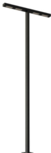
Figura 02 – Detalhe do poste retangular