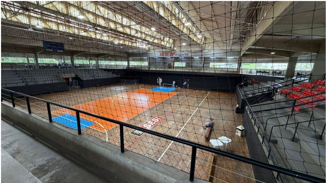
Vista do piso da quadra do ginásio coberto que receberá cobertura de carpete para proteção