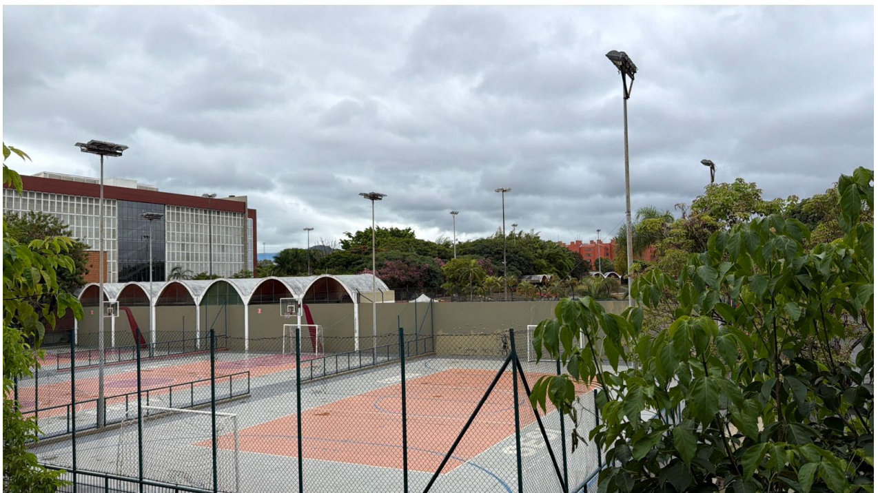
Vista lateral das quadras onde deverão ser instaladas as tendas (quadras 1, 2 e 3). Pode-se observar as tabelas, alambrados internos e externos, postes de iluminação e árvores