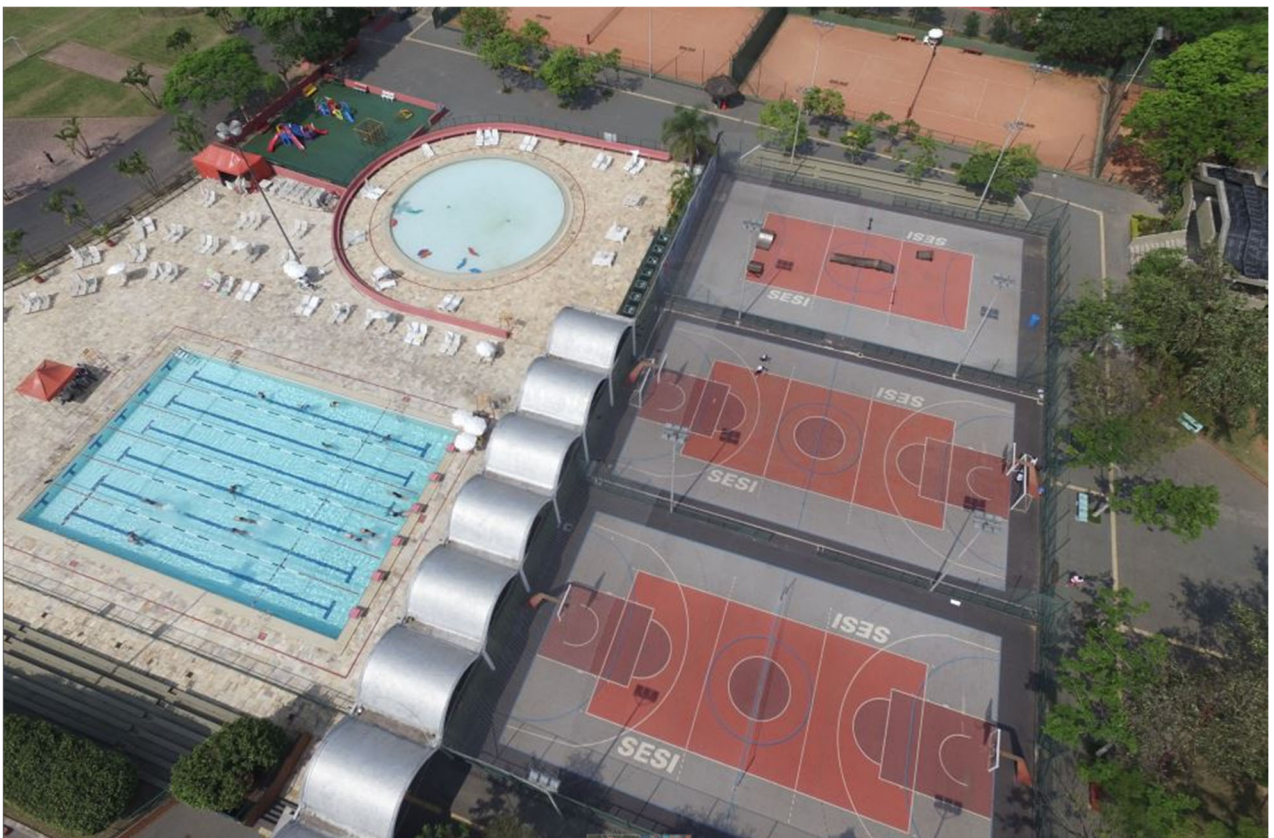
Vista aérea das quadras onde deverão ser instaladas as tendas (quadras 1, 2 e 3).