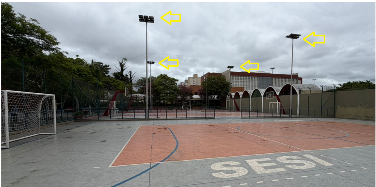
Postes de iluminação já existente nas quadras onde deverão ser instaladas as tendas (divisa entre as quadras 1, 2 e 3)