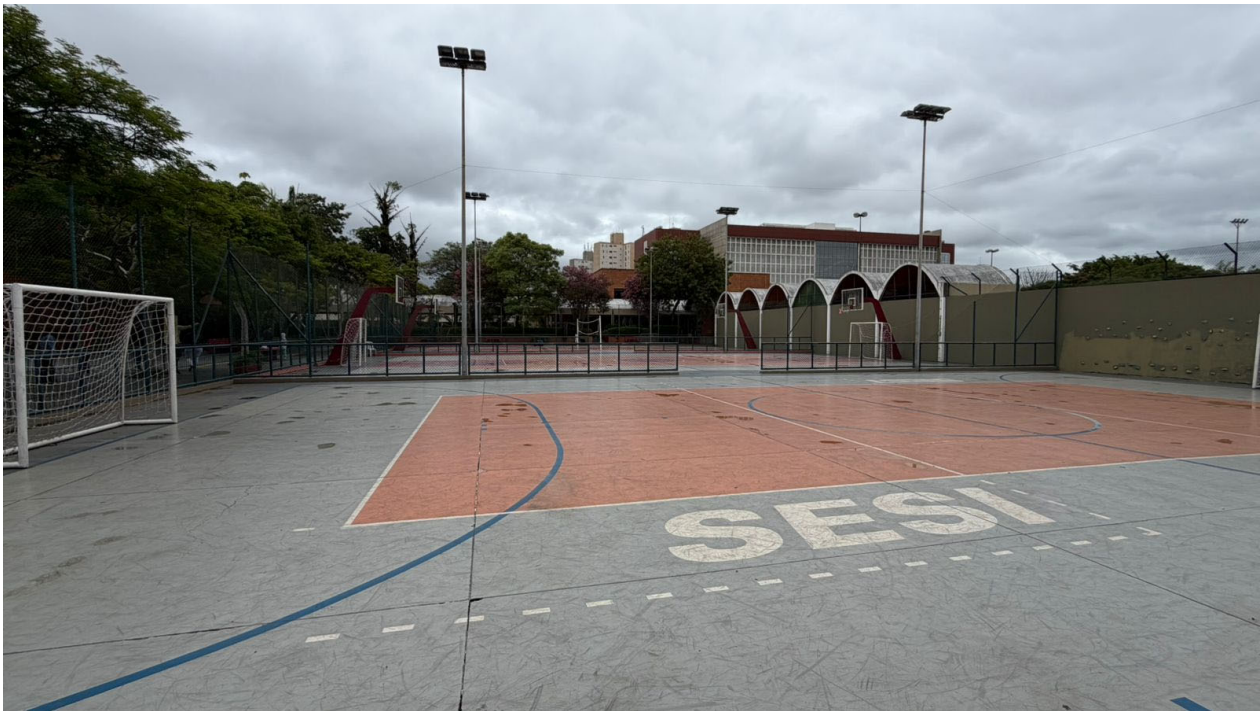
Vista interna das quadras onde deverão ser instaladas as tendas (quadras 1, 2 e 3). Pode-se observar as tabelas, alambrados internos e postes de iluminação