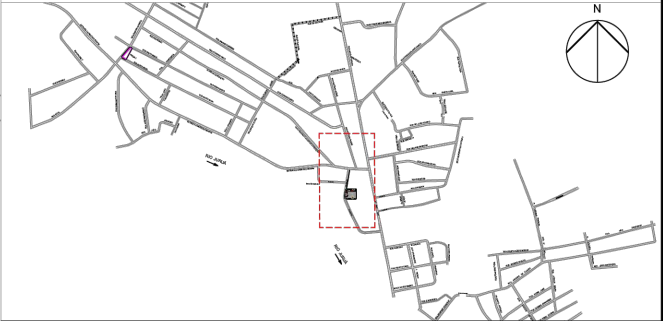
02 SITUAÇÃO 1/20.000