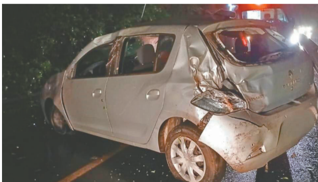
Automóvel Sandero capotou e motorista ficou ferido

ranco e capotou. Os Bombeiros Voluntários prestaram atendimento, sendo o condutor encaminhado ao Hospital Montenegro.