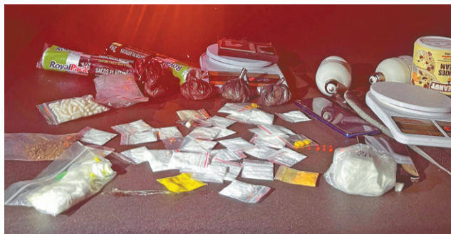
Prisões por tráfico de drogas são constantes

NÚMEROS DE ABRIL No total, em abril deste