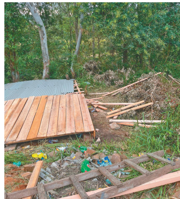
Desabamento ocorreu no bairro Estação

O jovem estaria trabalhando na construção da residência quando, por volta de 17h, acabou ocorrendo o desabamento. O Samu foi acionado e pediu o apoio dos bombeiros, mas quando chegaram a vítima já tinha sido resgatada e socorrida.