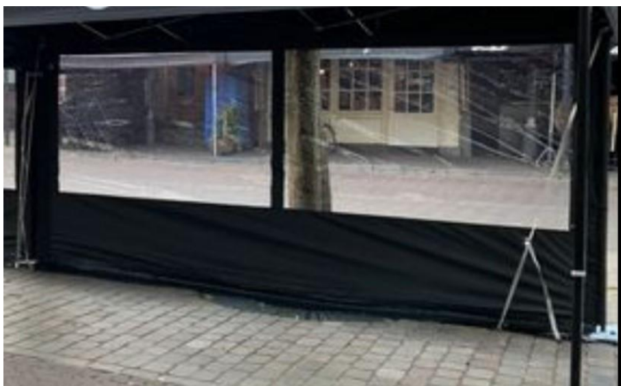
Imagem 02: modelo de fechamento lateral, com lona na mesma cor do gazebo nas bordas, sendo 50 cm na parte inferior, 10 cm nas laterais e 20 cm na parte superior, com a área central em material transparente.