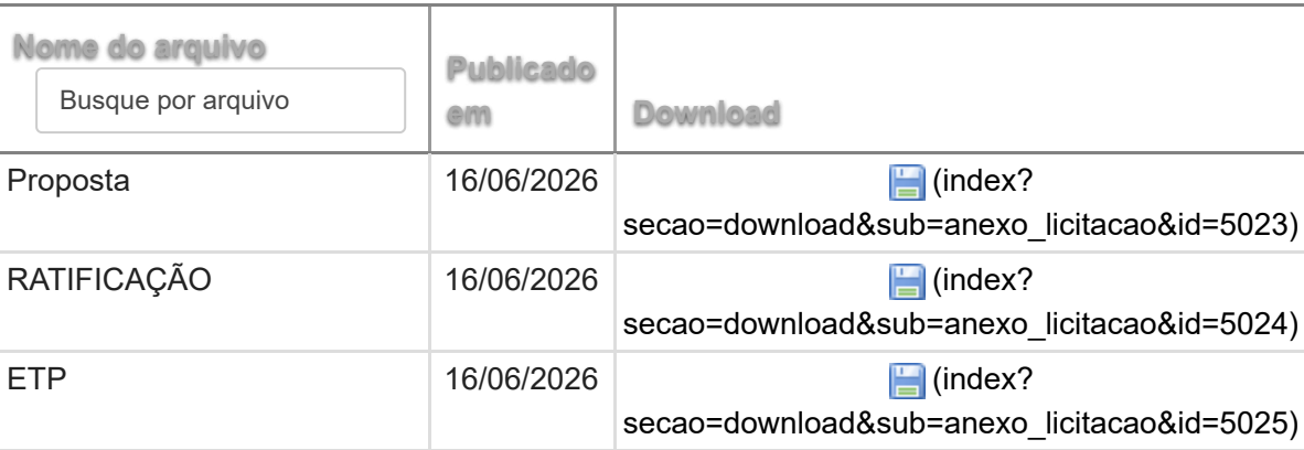
Tabela (? entidade=1&secao=dinami