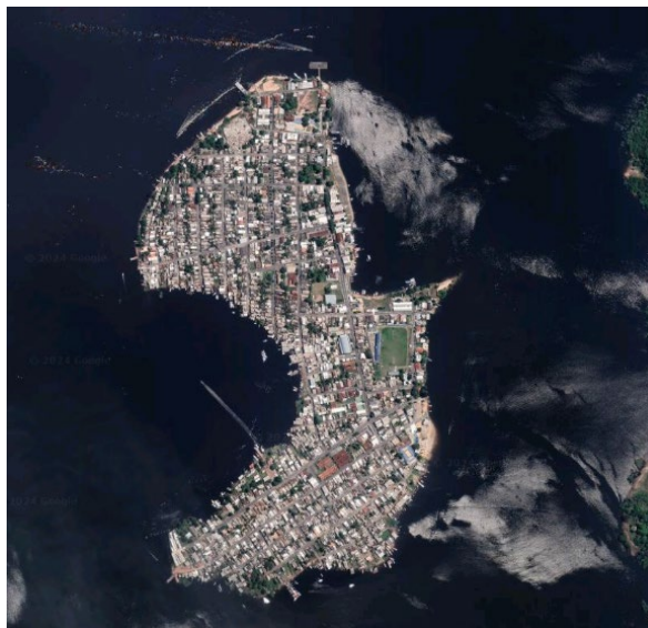
Imagem 01 – Sede do Município de Nhamundá - AM

A história de Nhamundá remonta aos povos indígenas que habitavam a região há milhares de anos. O nome "Nhamundá" deriva da língua tupi, significando "rio das águas escuras". A colonização portuguesa teve início no século XVII, com a fundação do Forte de São José do Tapajós em 1755. Em 1833, a localidade foi elevada à categoria de vila, recebendo o nome de Vila de São José do Tapajós.