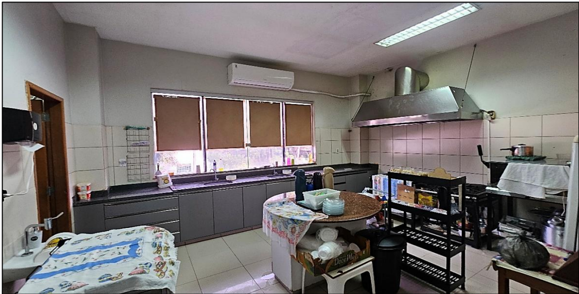
Atendimento (11,5 m 2 ):