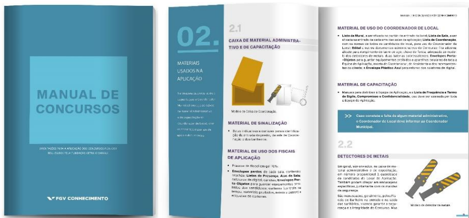
Figura 2.7.2 – Manual de Concursos

Abaixo é apresentado parte do projeto de diagramação desenvolvido pela FGV Conhecimento para o Manual de Concursos , Figura 2.7.2 , bem como a relação de capítulos que compõe o seu índice.