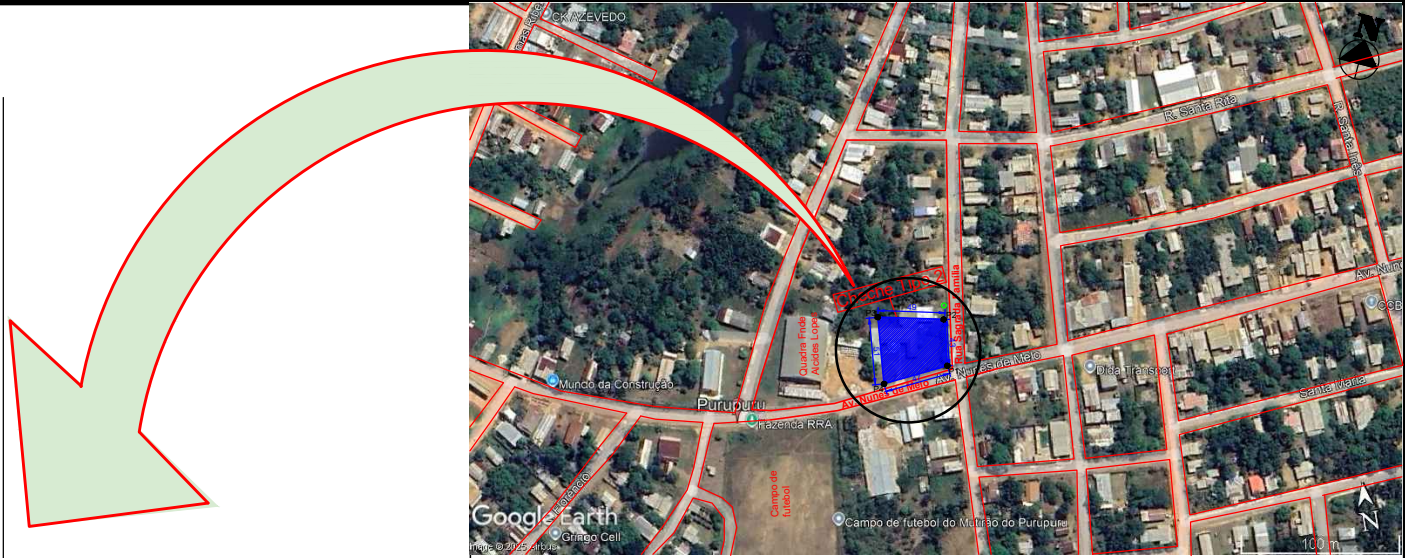
PLANTA DE SITUAÇÃO ESCALA: S/ESCALA