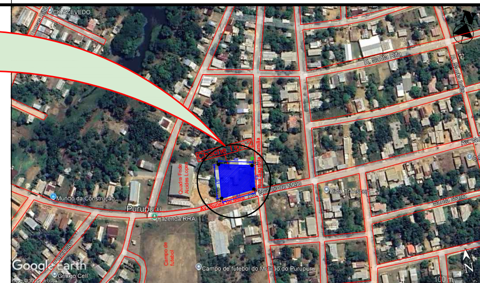
PLANTA DE SITUAÇÃO ESCALA: S/ESCALA

OBSERVAÇÕES: TERRENO: 47 m (FRENTE); 51m (LADO DIREITO); 51m (LADO ESQUERDO); 49 m (FUNDO) ÁREA: 2.668 m² PERÍMETRO: 198 m