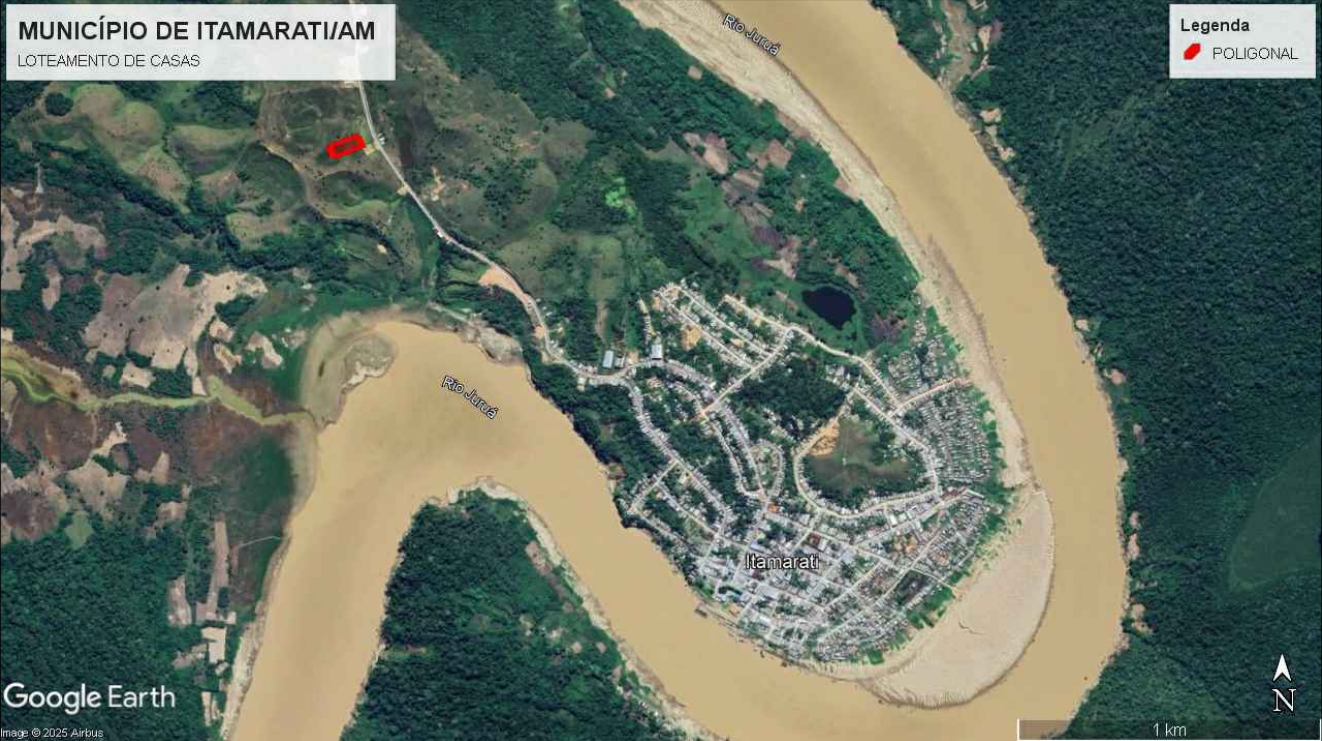
IMAGEM MACRO DE SATÉLITE - SITUAÇÃO