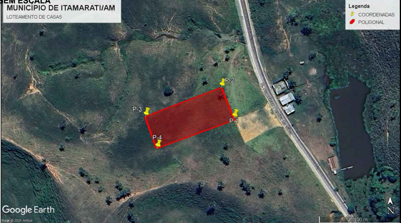
IMAGEM MICRO DE SATÉLITE - SITUAÇÃO SEM ESCALA

PREFEITURA DE ITAMARATI SECRETARIA DE OBRAS APROVADO