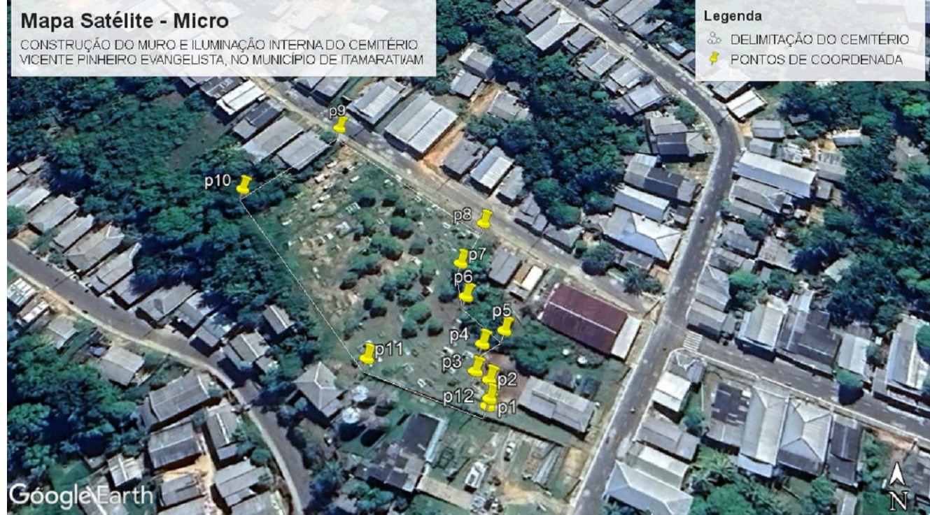
IMAGEM MICRO DE SATÉLITE - SITUAÇÃO SEM ESCALA