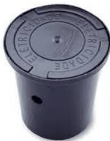
Figura: Caixa de inspeção de aterramento.

ou similar. A instalação do aterramento deverá ser conforme detalhe apresentado no projeto do SPDA.