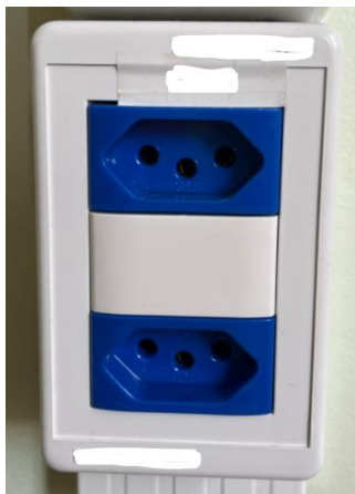
Figura: Modelo de tomadas duplas.