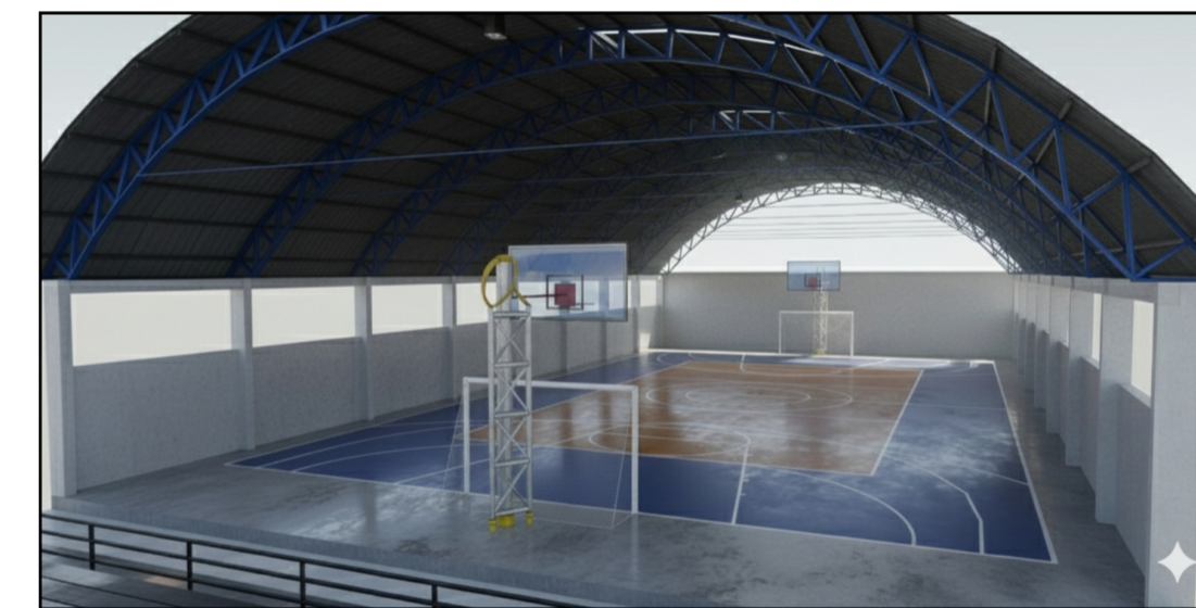
04 PERSPECTIVA SEM ESCALA