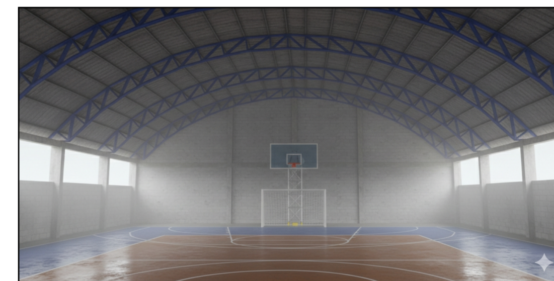
05 PERSPECTIVA SEM ESCALA