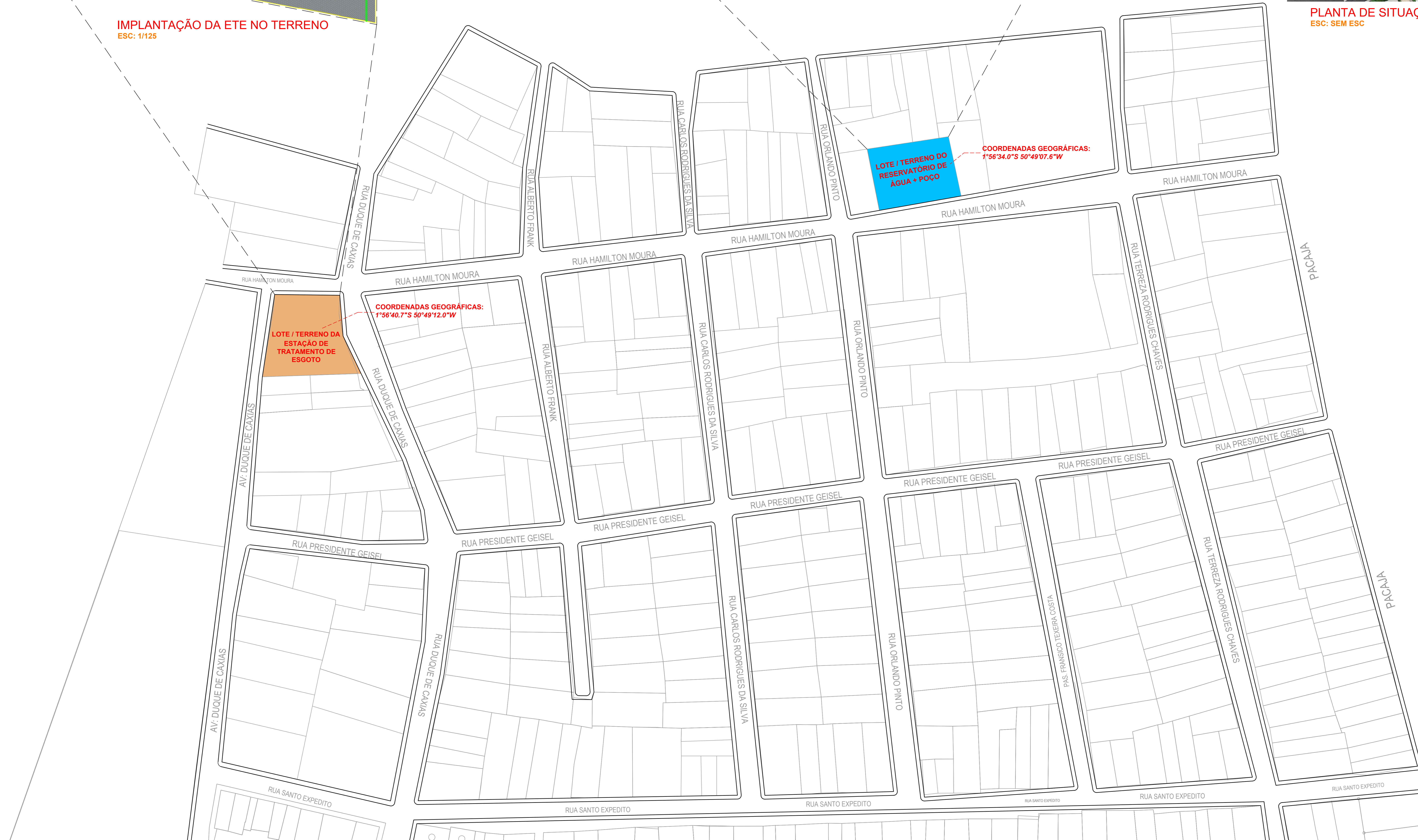
MAPA DE LOCALIZAÇÃO C/ COORDENADAS - TERRENOS ETE E RESERVATÓRIO ESC: 1/600