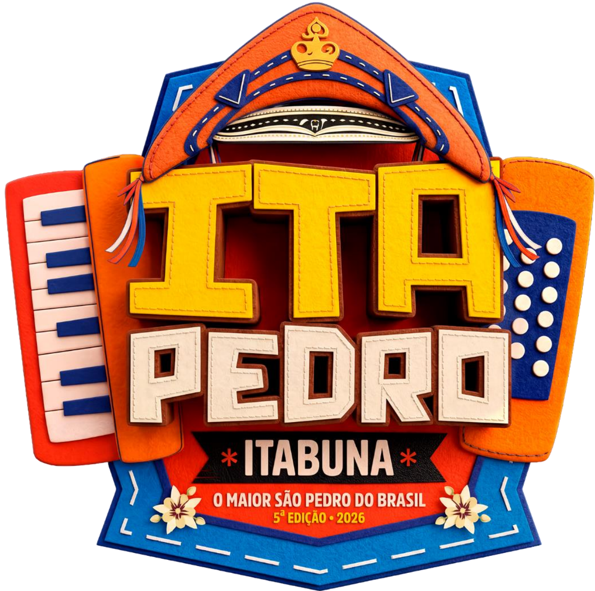
LOGO ITAPEDRO 2026