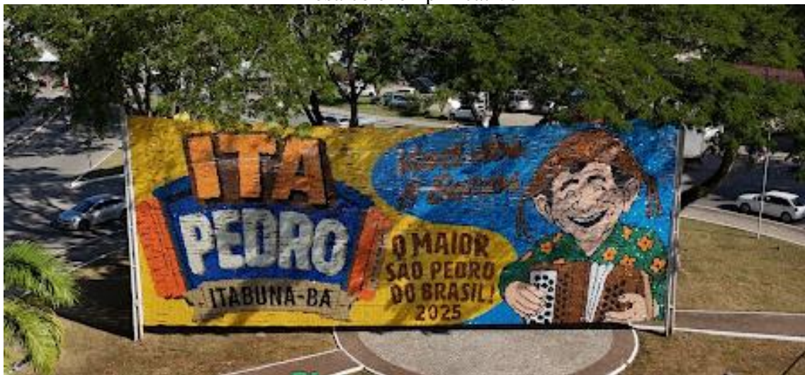
Mosaico exemplificativo painel outdoor