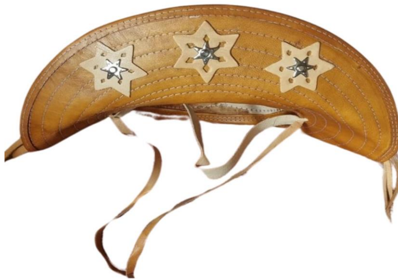
Chapéu de Couro