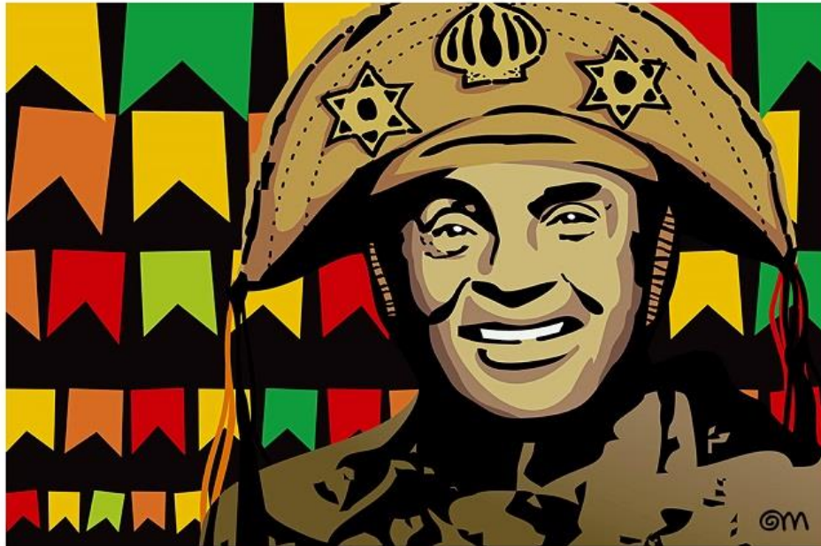
Luiz Gonzaga – O Rei do Baião