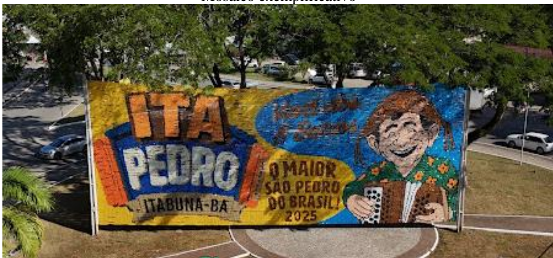
Mosaico exemplificativo painel outdoor