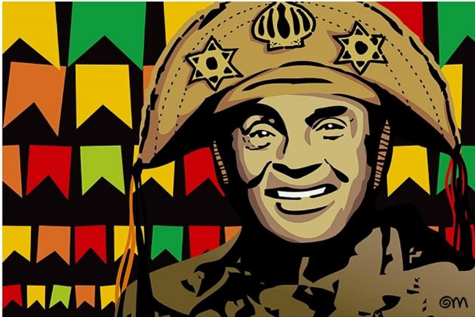
Luiz Gonzaga – O Rei do Baião