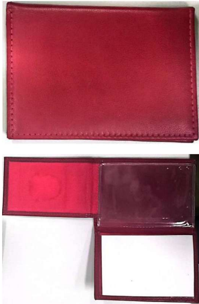
4:MODELO DE CARTEIRA FRE

A carteira funcional deverá possuir os seguintes elementos institucionais: