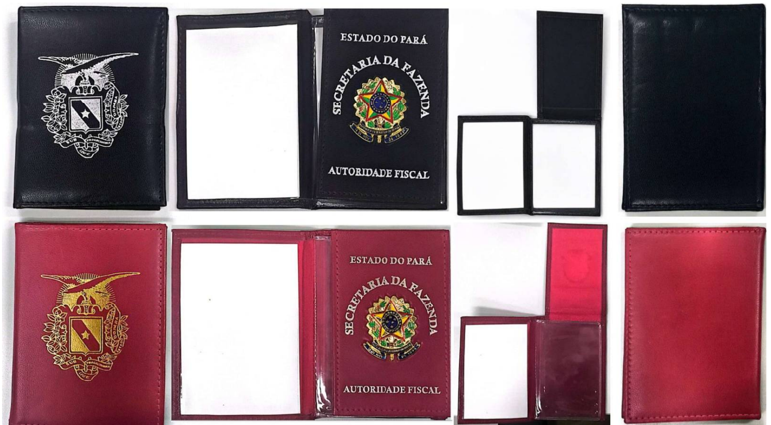
Figura 1: Carteira de Auditor Fiscal de Receitas Estaduais - AFRE acima, carteira de Fiscal de Receitas Estaduais - FRE.