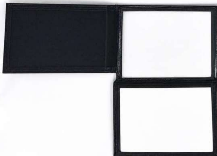
1: MODELO DE CARTEIRA AFRE

A carteira funcional deverá possuir os seguintes elementos institucionais: