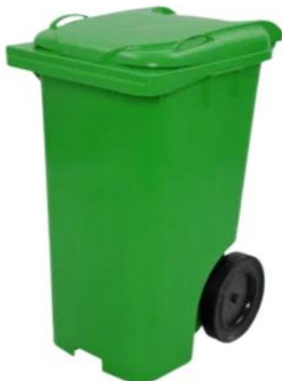
Modelo Carro coletor 120 e 240 litros

ESTADO DO PARÁ MUNICÍPIO DE ANANINDEUA PREFEITURA MUNICIPAL SECRETARIA MUNICIPAL DE LICITAÇÃO PROCESSO ADMINISTRATIVO Nº 24.002/2024- SEURB/PMA CONCORRÊNCIA ELETRÔNICA Nº 3/2024.024 SEURB/PMA