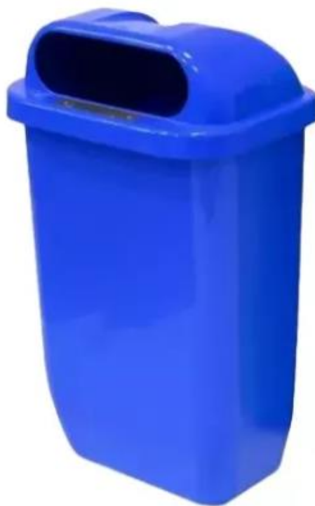
Modelo das Papeleiras

3.10.2- A Contratada deverá considerar a substituição das papeleiras e carros coletores instaladas a cada 2 anos.