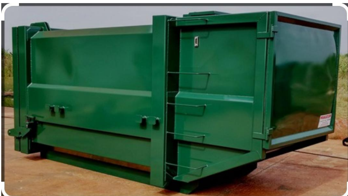
Modelo Coletor Estacionário