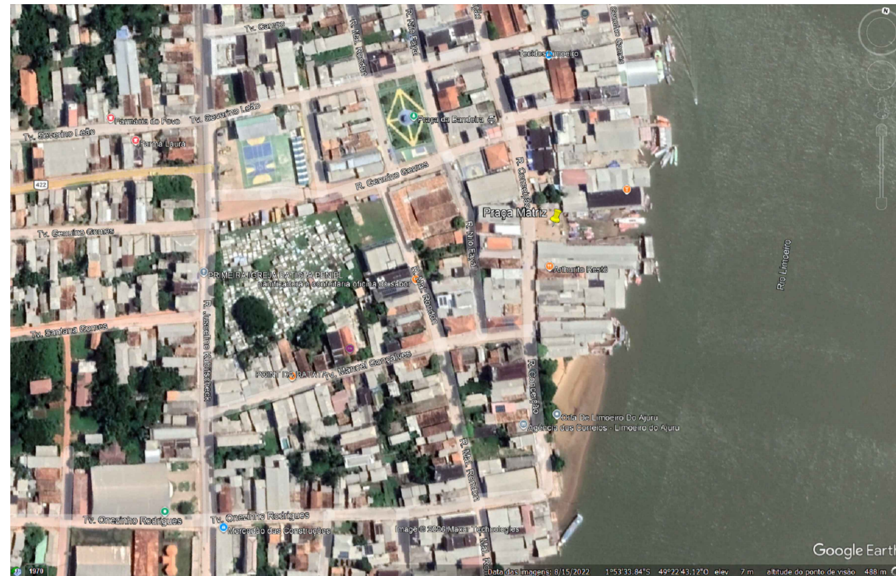
Mapa de Localização Sem Escala