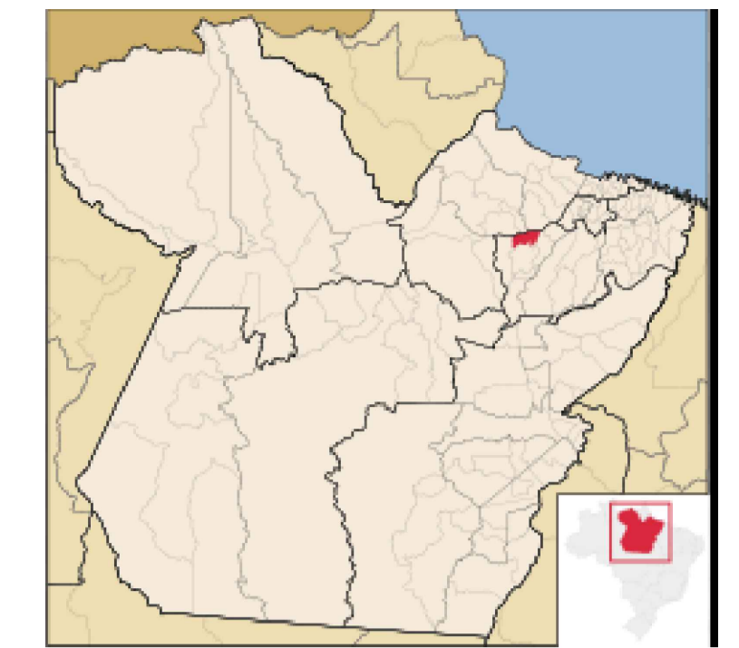
LIMOEIRO DO AJURU-PA