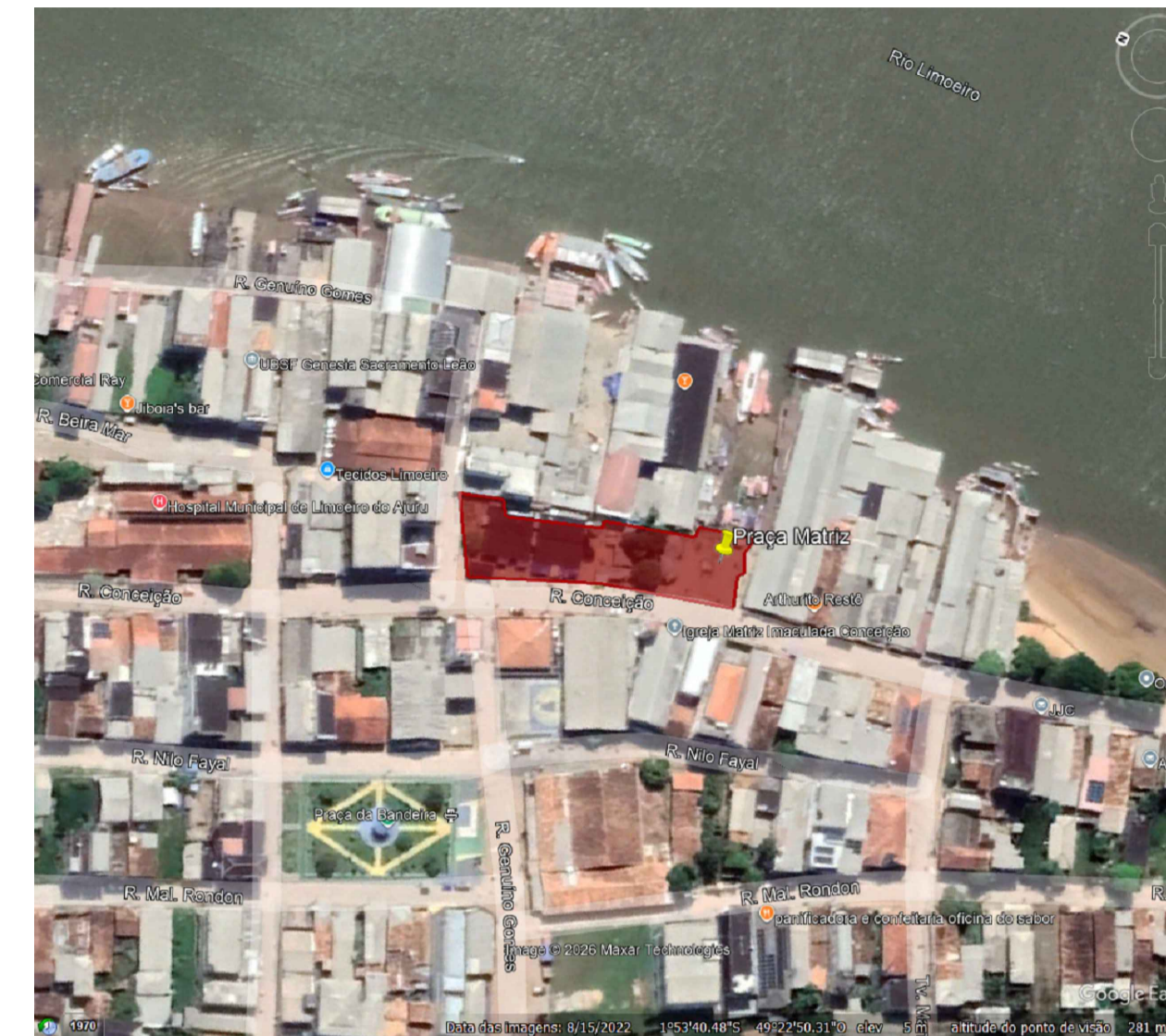
Mapa de Situação da Praça Sem Escala