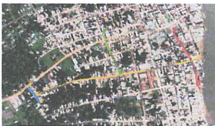
Mapa de Situação - Ref. Google Earth

Pavimentação em Blokret nas vias : TRAVESSA ONEZINHO RODRIGUES (740,79m); TRAVESSA ONEZITO RODRIGUES 2 (100,32m); RUA ANTÔNIO MORAES (224,94); RUA MARECHAL RONDON (274,32m). LOCAL: MUNICÍPIO DE LIMOEIRO DO AJURU- PARÁ EXTENSÃO: 1340,37m