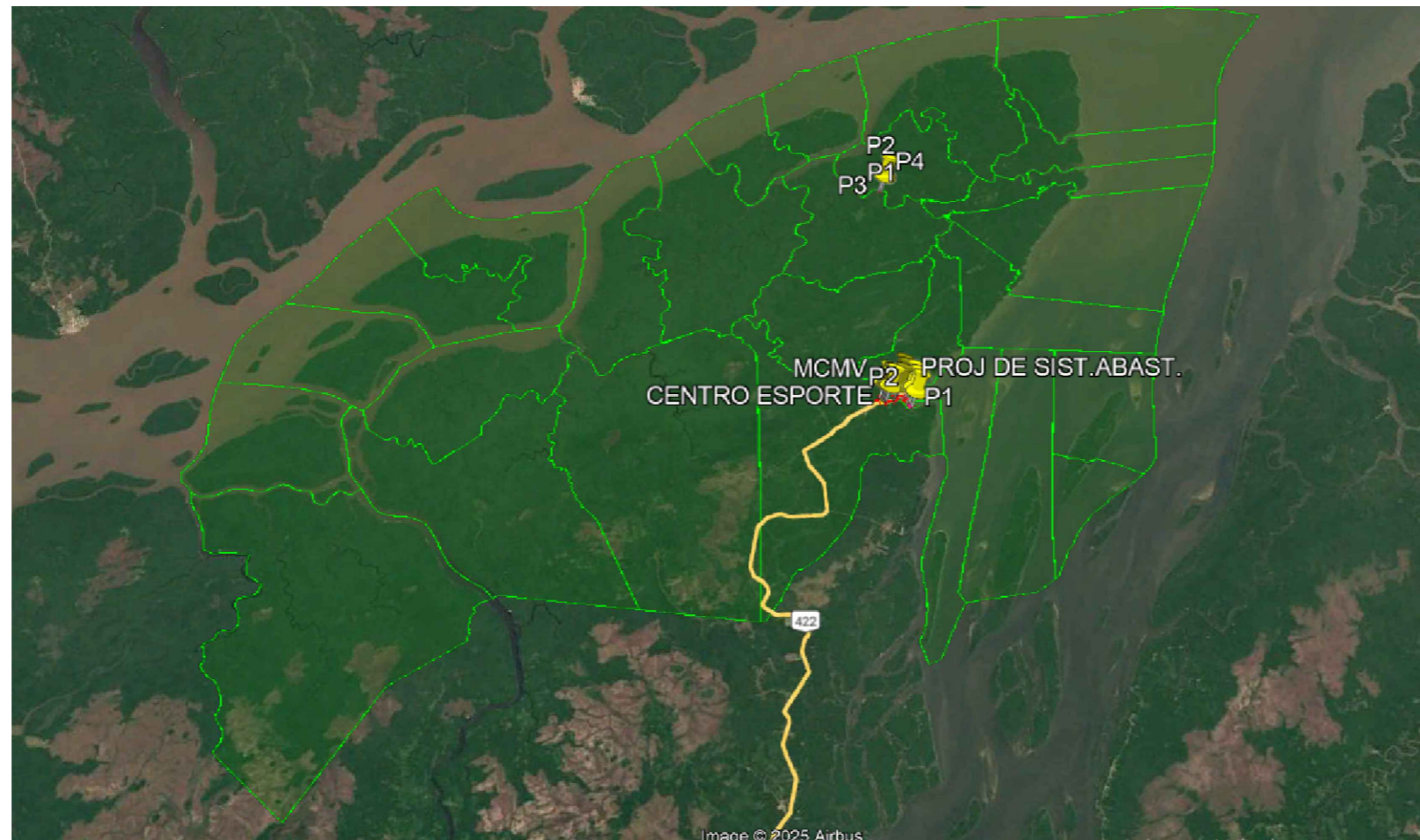
Mapa limite territorial S/Escala