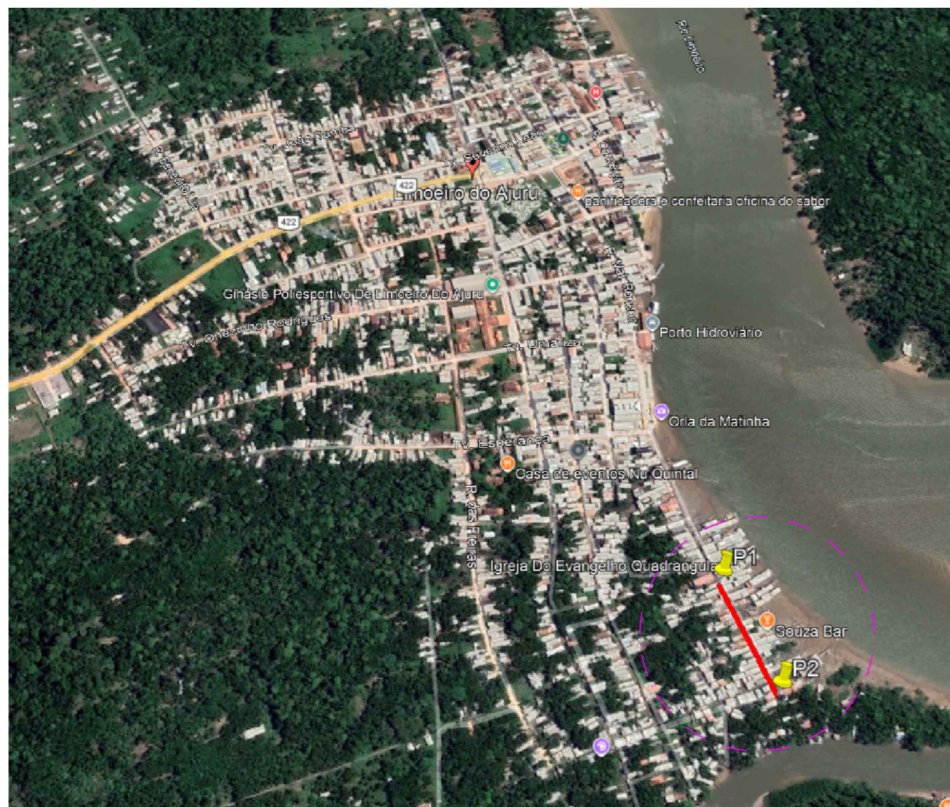
Mapa de Localização - Google Earth S/Escala