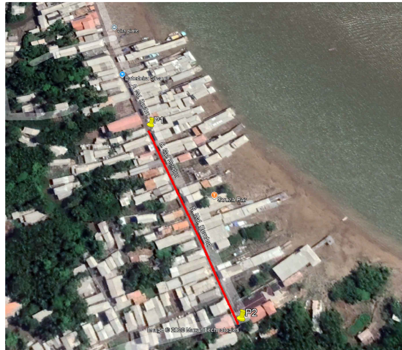
Mapa de Situação - Google Earth S/Escala

NOTAS - MEDIDAS E NÍVEIS EM METROS; - VERIFICAR POSIÇÃO EXATA DOS PILARES NO PROJETO ESTRUTURAL; - VERIFICAR DETALHES CONSTRUTIVOS PERTINENTES NAS PRANCHAS DE DETALHAMENTO; - EM CASO DE CONFLITO DE INFORMAÇÕES ENTRE O PROJETO GRÁFICO E O MEMORIAL DESCRITIVO, PREVALECE A INFORMAÇÃO CONTIDA NOS DESENHOS; - ALTERAÇÕES NESTE PROJETO SOMENTE COM AUTORIZAÇÃO EXPRESSA DO AUTOR REFERÊNCIAS: - PLANILHA DE QUANTITATIVOS - MEMORIAL DESCRITIVO E ESPECIFICAÇÕES TÉCNICAS