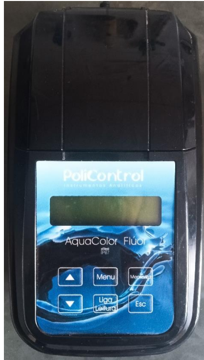
Figura 1 – Equipamento utilizado para determinação de flúor em amostras de água.