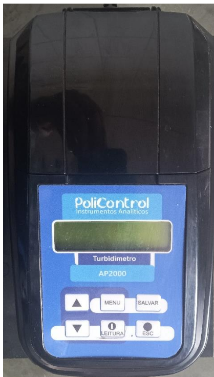
Figura 3 – Equipamento utilizado para análise de cor aparente da água.