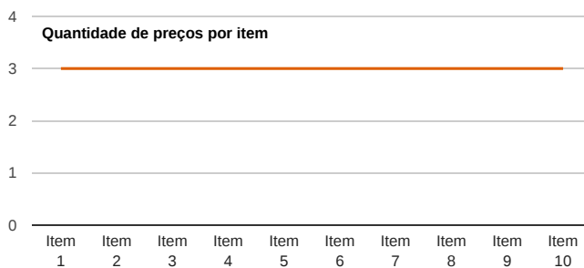
Quantidade de preços por item