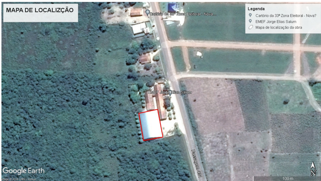
Figura 1 – Localização da Construção PAC 2 / Quadra Escolar Coberta (Lat:1°12'50.93"S; Long:47°23'9.10"O)

A seguir, é possível visualizar, através de uma imagem obtida por satélite, a área da quadra em questão, conforme Figura1.