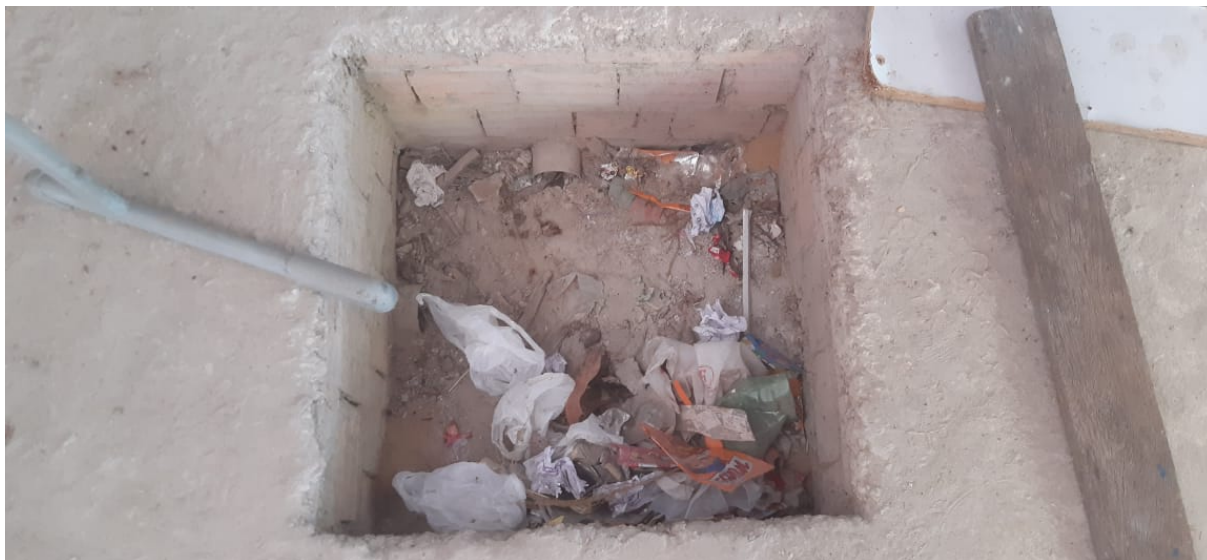
Figura 13 – Instalações hidrossanitárias parcialmente executadas (caixa de inspeção entupido de lixo).

PREFEITURA MUNICIPAL DE NOVA TIMBOTEUA ADMINISTRAÇÃO 2021 – 2024 SECRETARIA DE ADMINISTRAÇÃO AV. BARÃO DO RIO BRANCO Nº 2312 CNPJ Nº 05.149.125/0001-00