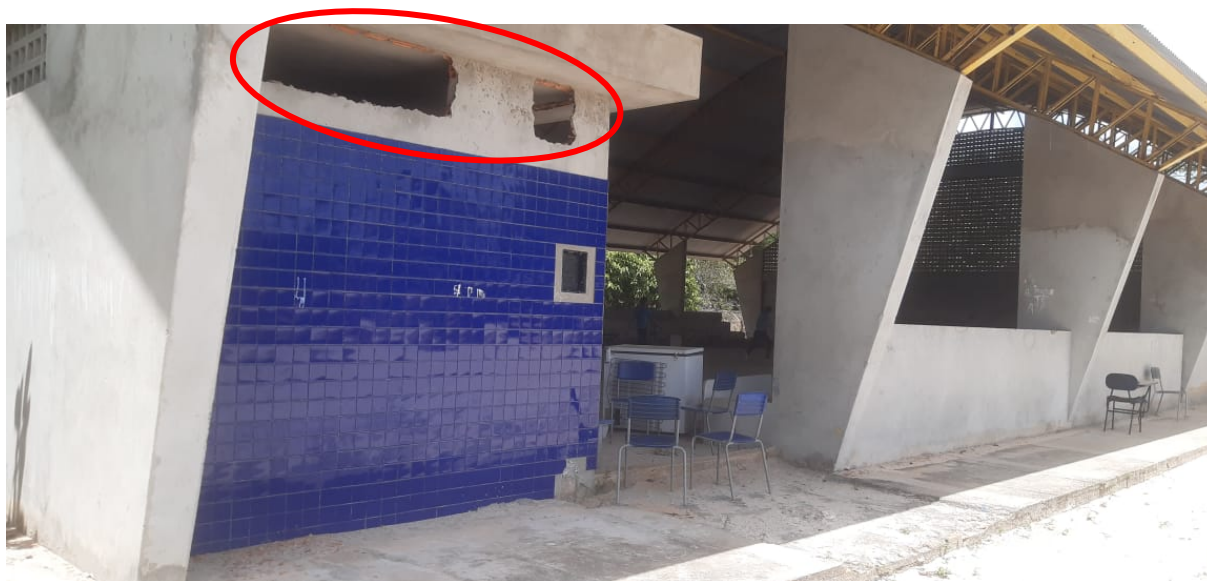
Figura 4 – Serviços de esquadrias não realizadas.