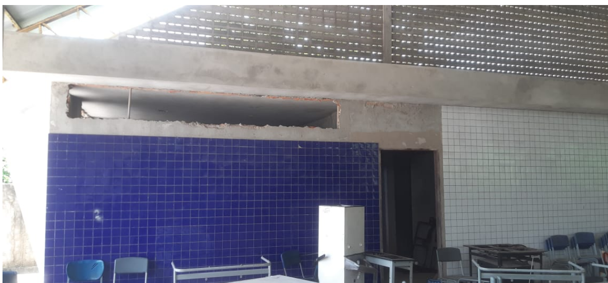
Figura 14 – Revestimento cerâmico parcialmente executado nas paredes externas do vestuário.