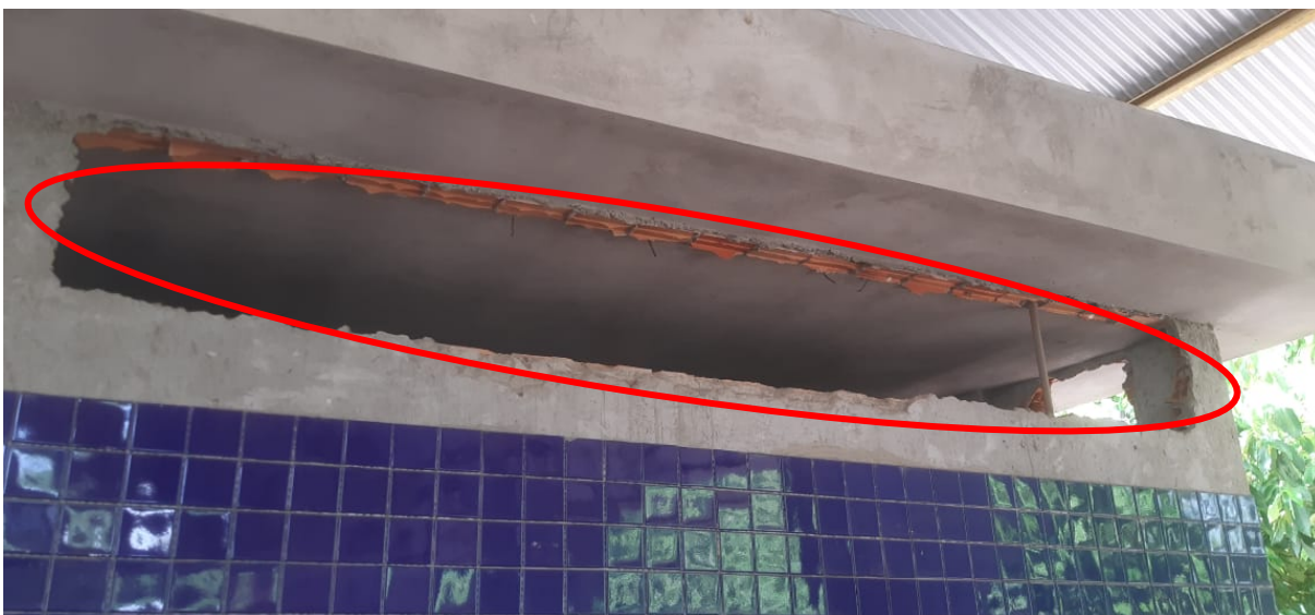
Figura 6 – Serviços de esquadrias não realizadas.