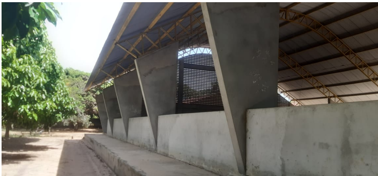
Figura 9 – Serviços de pintura não realizados.

PREFEITURA MUNICIPAL DE NOVA TIMBOTEUA ADMINISTRAÇÃO 2021 – 2024 SECRETARIA DE ADMINISTRAÇÃO AV. BARÃO DO RIO BRANCO Nº 2312 CNPJ Nº 05.149.125/0001-00