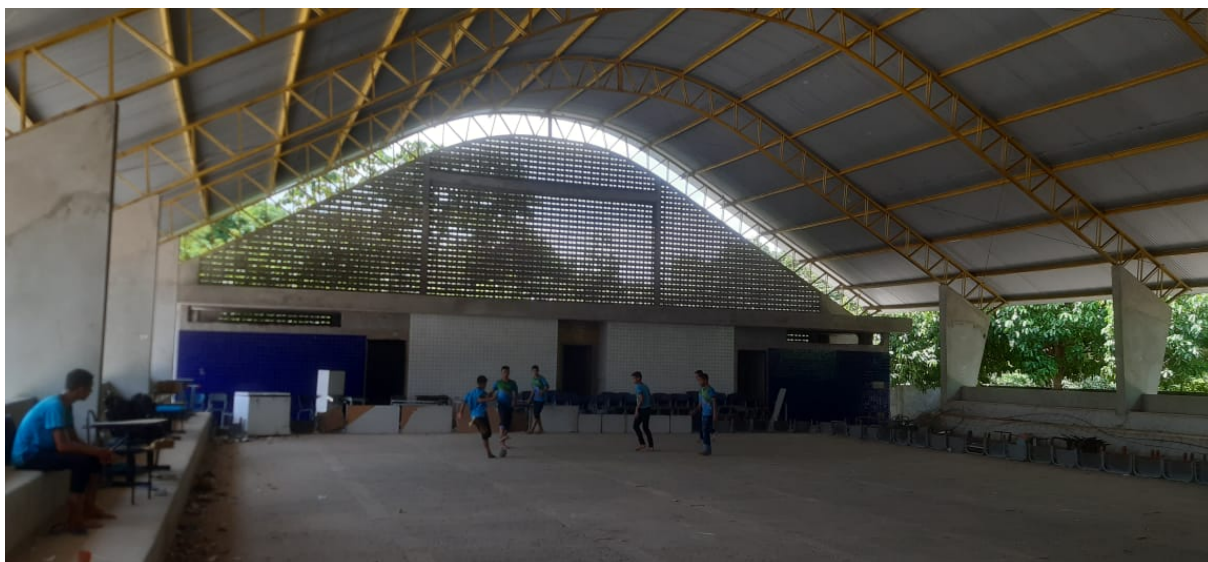
Figura 15 – Visão interna da quadra.