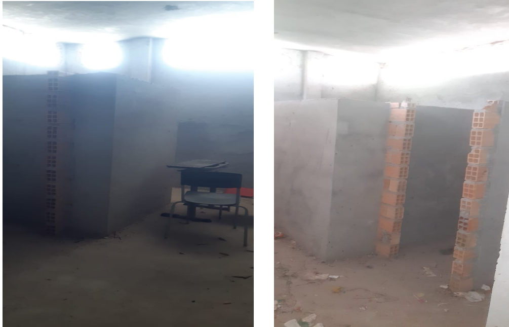
Figura 7 – Alvenaria de vedação no vestiário parcialmente executados e piso cerâmico esmaltado não executado.