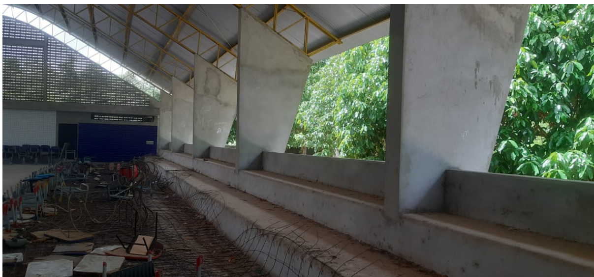
Figura 10 – Piso parcialmente executado em concreto armado com tela e juntas de dilatação na quadra.