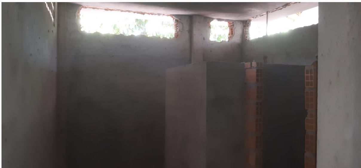
Figura 15 – Ausência de revestimento cerâmico nas paredes internas do vestuário.

PREFEITURA MUNICIPAL DE NOVA TIMBOTEUA ADMINISTRAÇÃO 2021 – 2024 SECRETARIA DE ADMINISTRAÇÃO AV. BARÃO DO RIO BRANCO Nº 2312 CNPJ Nº 05.149.125/0001-00