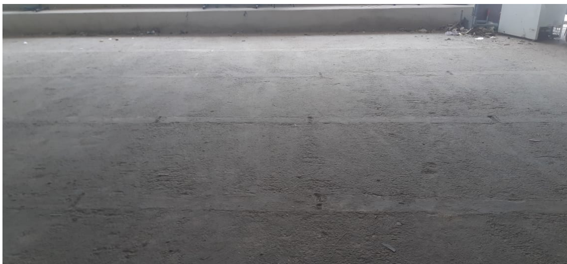
Figura 11 – Piso parcialmente executado em concreto armado com tela e juntas de dilatação na quadra. Fonte: elaboração própria.

PREFEITURA MUNICIPAL DE NOVA TIMBOTEUA ADMINISTRAÇÃO 2021 – 2024 SECRETARIA DE ADMINISTRAÇÃO AV. BARÃO DO RIO BRANCO Nº 2312 CNPJ Nº 05.149.125/0001-00