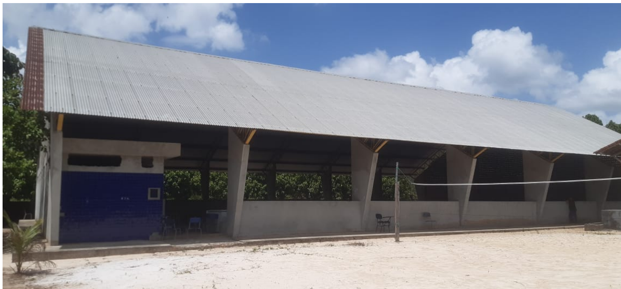
Figura 3 – Visão geral da quadra escolar.