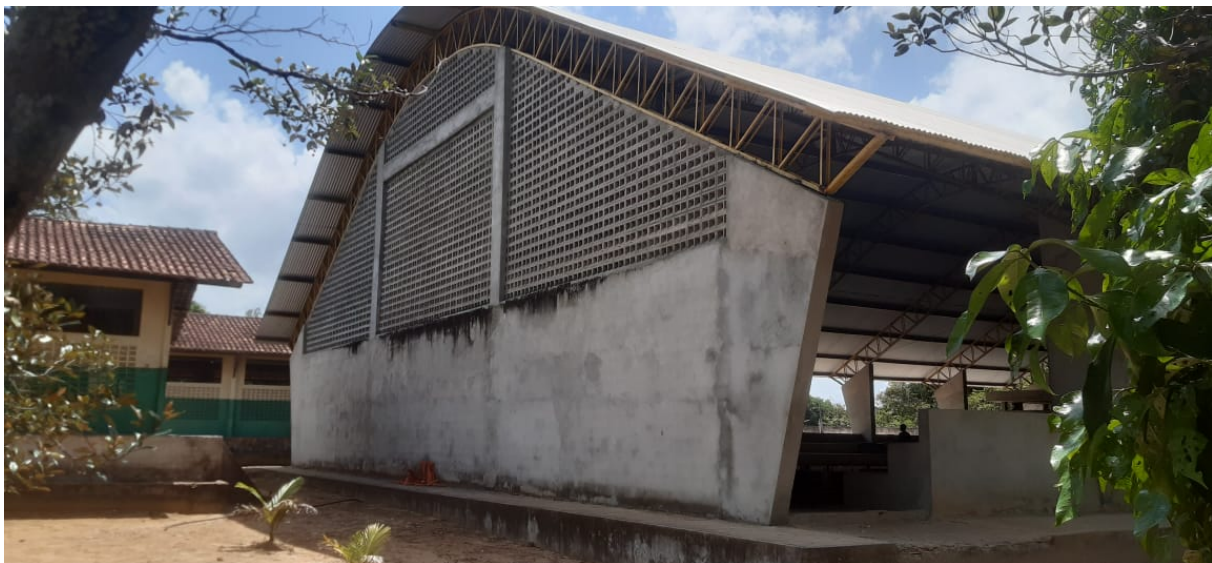
Figura 8 – Serviços de pintura não realizados.