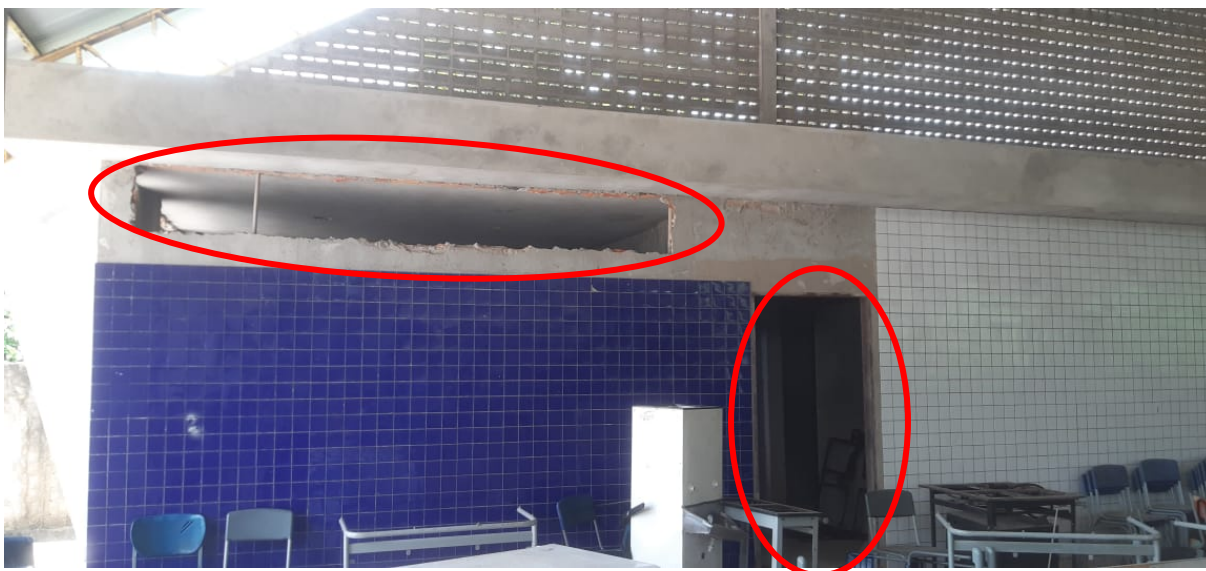
Figura 5 – Serviços de esquadrias não realizadas. Fonte: elaboração própria.

PREFEITURA MUNICIPAL DE NOVA TIMBOTEUA ADMINISTRAÇÃO 2021 – 2024 SECRETARIA DE ADMINISTRAÇÃO AV. BARÃO DO RIO BRANCO Nº 2312 CNPJ Nº 05.149.125/0001-00