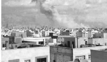
Guerra no Oriente Médio impulsiona renda fixa e pressiona Bolsas