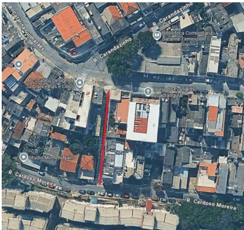
Figura 1 - Trecho de Intervenção

O presente documento tem por objeto a apresentação das diretrizes para a contratação de serviços técnicos especializados para a execução de obras de requalificação da viela sito à Rua Cardoso Moreira alt. Nº 1015 x Rua Catarina Guimaraes - Jd. Olinda - São Paulo/SP.