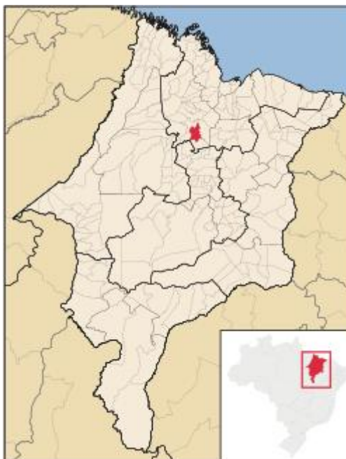
Figura 01 - Mapa de localização do município de Vitória do Mearim.

Vitória do Mearim é um município brasileiro do estado do Maranhão, Região Nordeste do país. Sua população estimada pelo Instituto Brasileiro de Geografia e Estatística (IBGE) era de 31.859 habitantes em 2022 e uma extensão territorial de 715,625 km 2 .