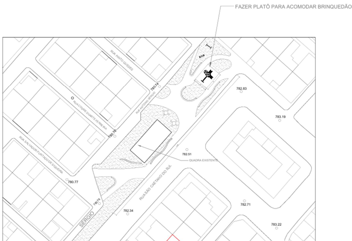
PRAÇA SÃO CAETANO DO SUL - BNH

OBJETO: CONTRATAÇÃO DE EMPRESA ESPECIALIZADA EM ENGENHARIA PARA EXECUÇÃO DE OBRAS DE REVITALIZAÇÃO DA PRAÇA LOCALIZADA NA RUA SÃO CAETANO DO SUL E PRAÇA JOSÉ BELO RESENDE, LOCALIZADA NA RUA JEQUITUBA X RUA OSCAR BARRETO FILHO – GRAJÁ – SÃO PAULO .SP, , CONFORME ESPECIFICAÇÃO CONSTANTES NO TERMO DE REFERÊNCIA ANEXO I, IA E IB E DEMAIS PARTES INTEGRANTES DESTES EDITAIS