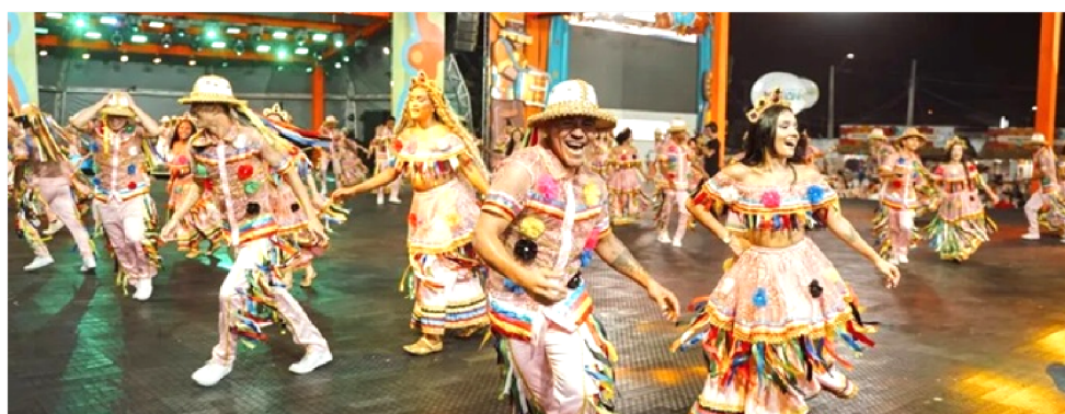
O ARRAIAL DO COHATRAC COMEÇA A FUNCIONAR NESTA SEXTA-FEIRA (12)

A programação oficial do São João do Maranhão 2026, que este ano tem como tema “O São João do Maranhão Te Abraça”, teve início no dia 10 de maio com o Maranhão de Rencontros, na Concha Acústica da Lagoa da Jansen. A festa contará com mais de 60 dias de programação e a participação de centenas de atrações culturais, entre grupos de bumba meu boi, dan-