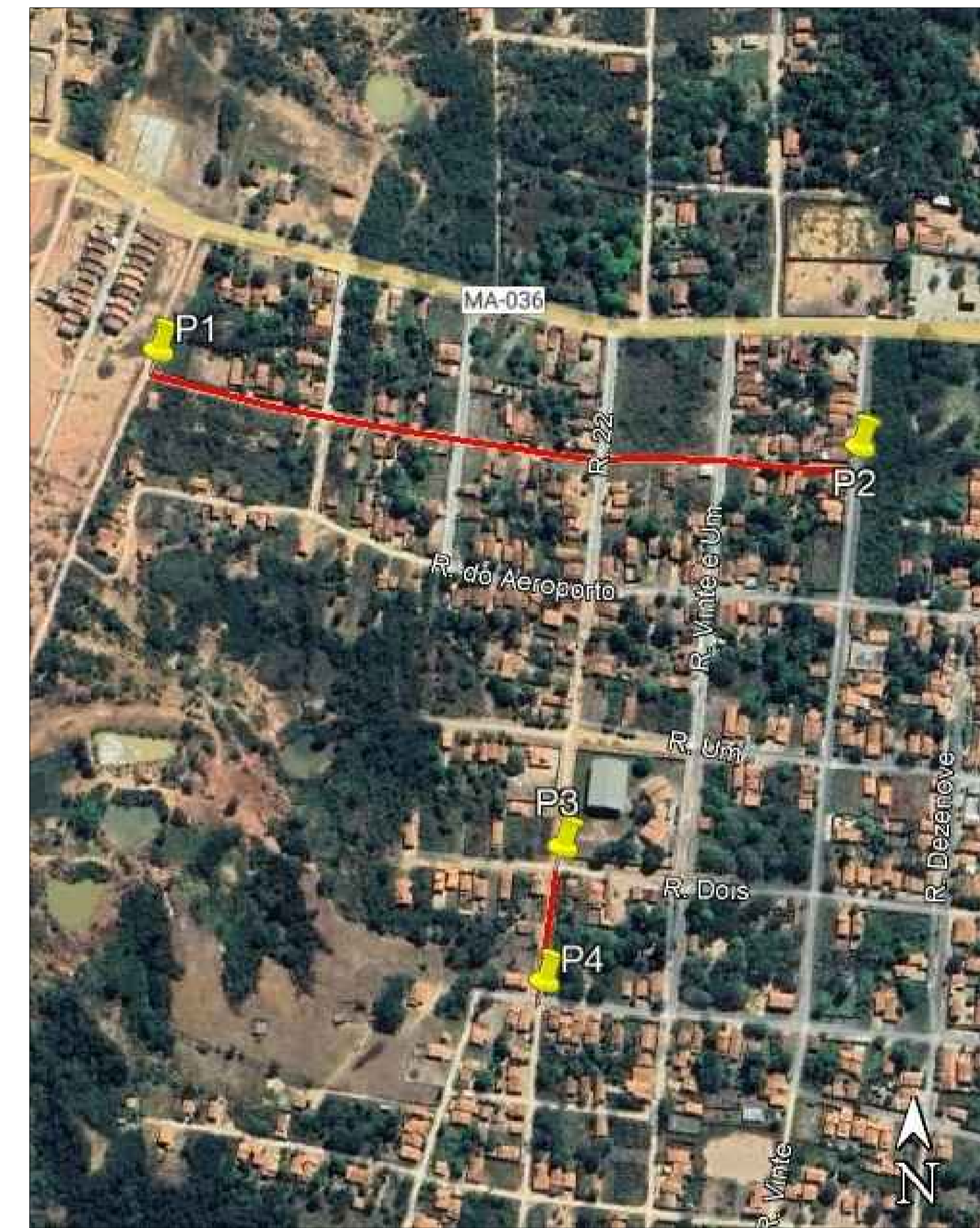
COORDENADAS DOS TRECHOS QUE SERÃO PAVIMENTADAS NA SEDE DO MUNICÍPIO - PARNARAMA / MA