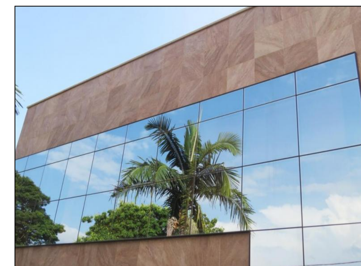
DETALHE PAINEL DE VIDRO

A "Pele de Vidro", tecnicamente conhecida como Structural Glazing, é um sistema de fachada que utiliza silicone estrutural de alta performance para fixar painéis de vidro (refletivo ou espelhado) resultando em uma superfície envidraçada contínua e uniforme, sem perfis metálicos aparentes.